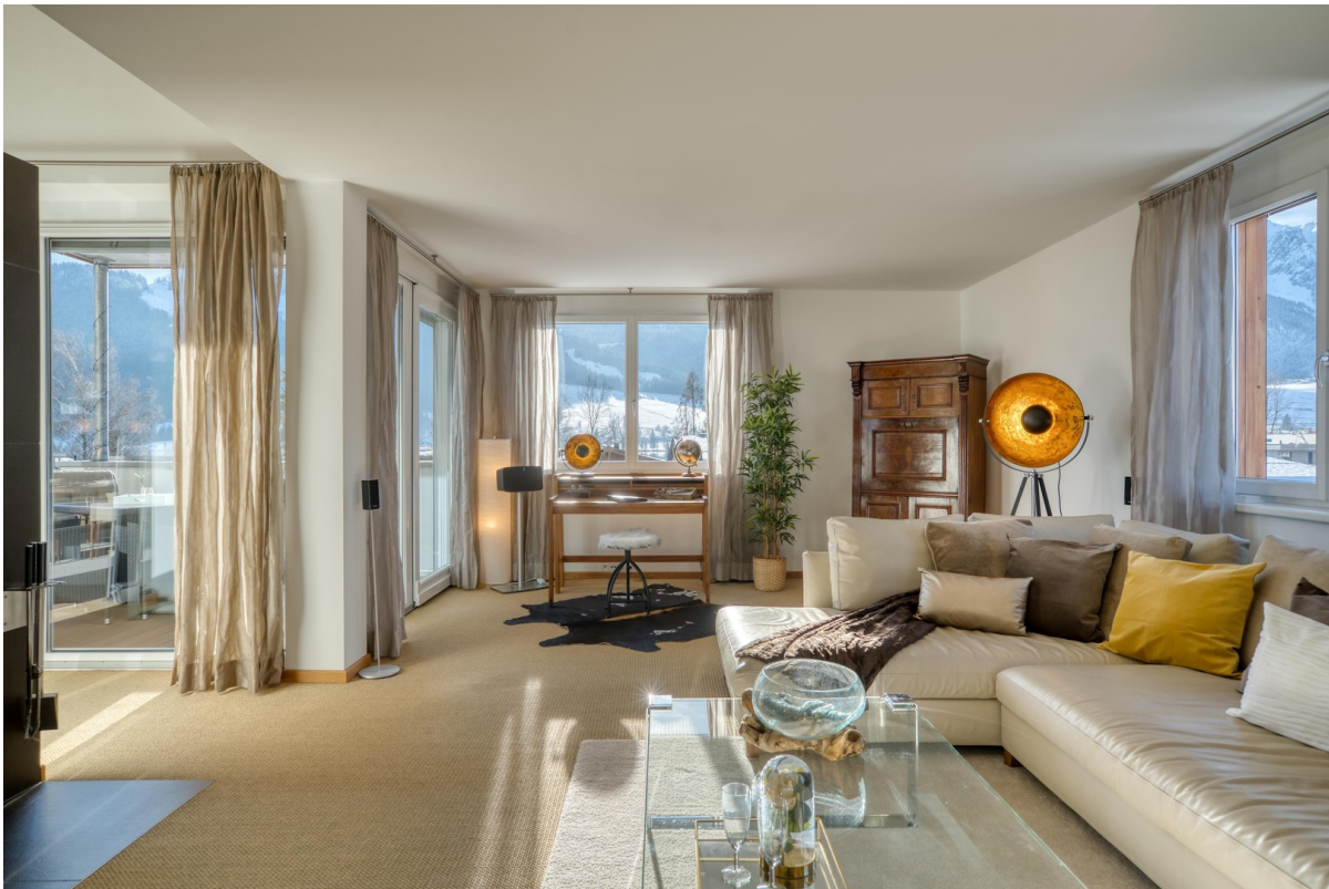
Wohnraum mit Bergblick