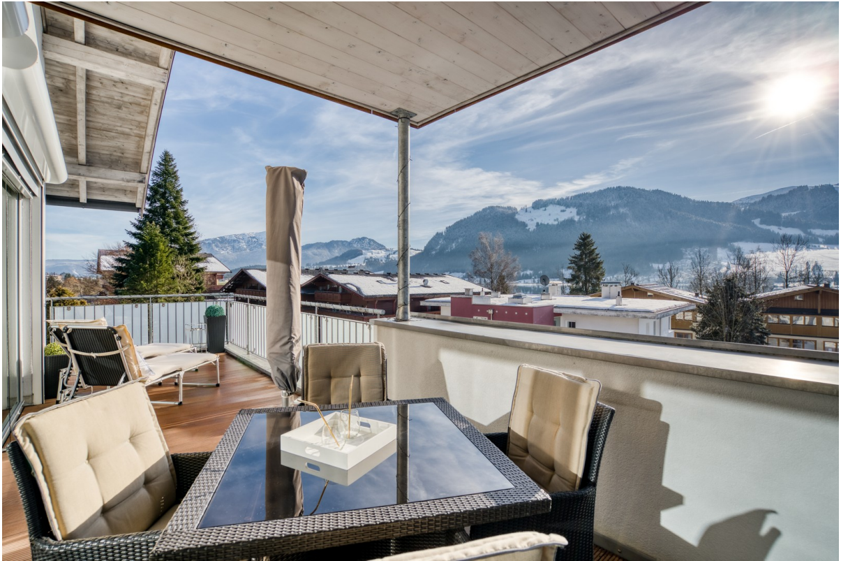
Berg- und Seeblick