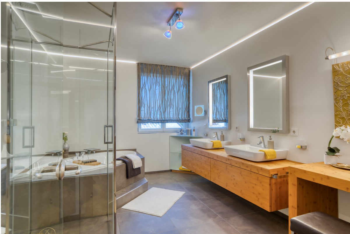
Das Masterbad mit Whirlpool