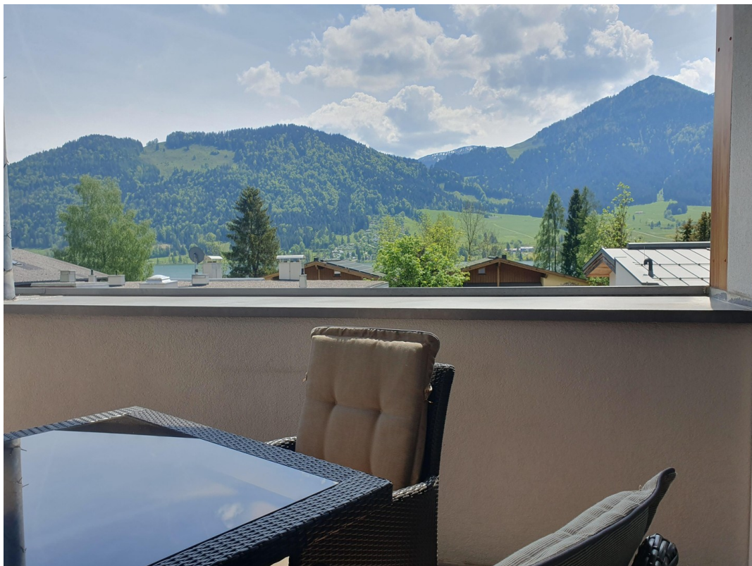
Bergblick vom Sitzplatz