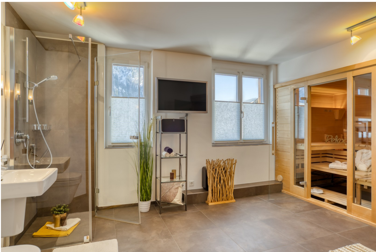
Sauna - Gäste Bad