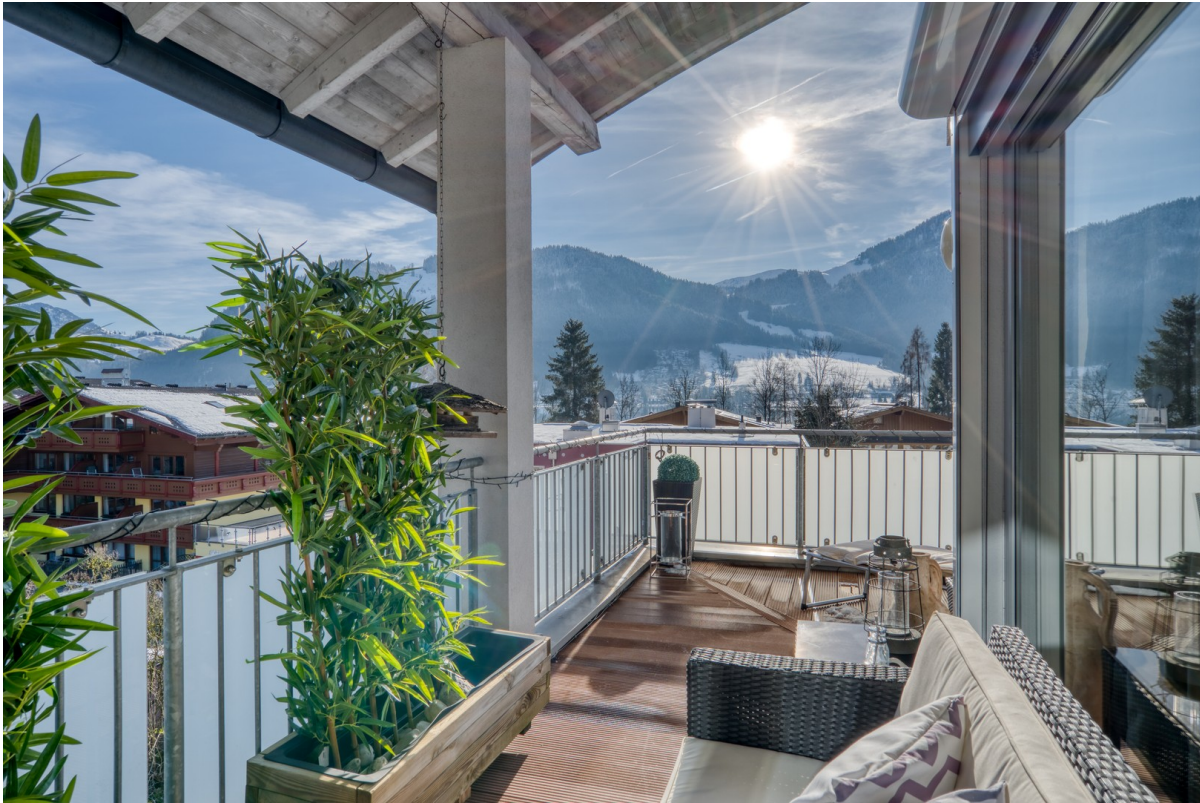
Der überdachte Loungebereich