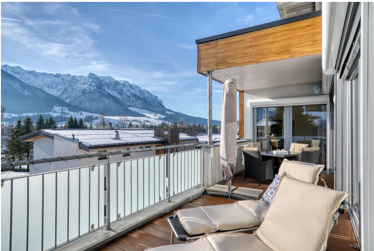
Südterrasse mit Panoramablick