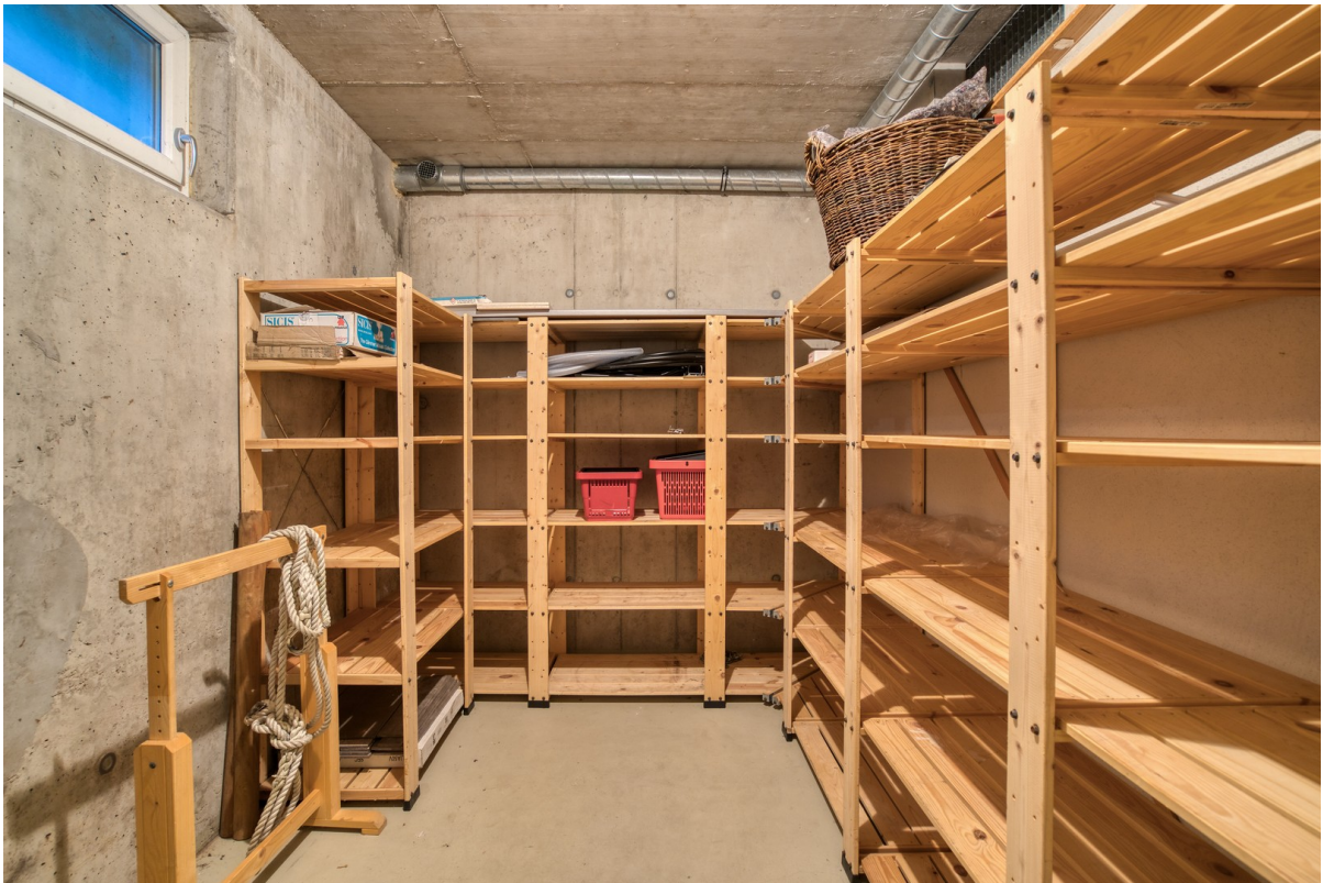
Kellerraum 10 m 2