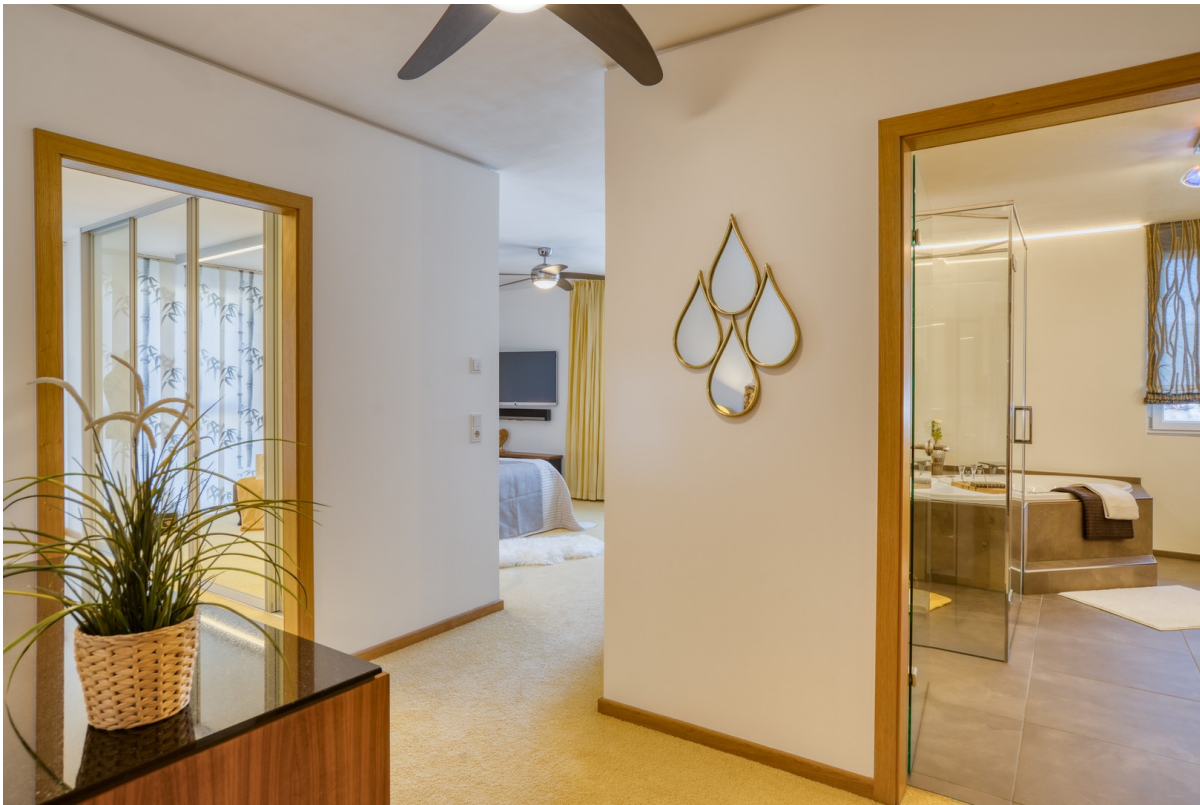
Vorraum zur Elternsuite