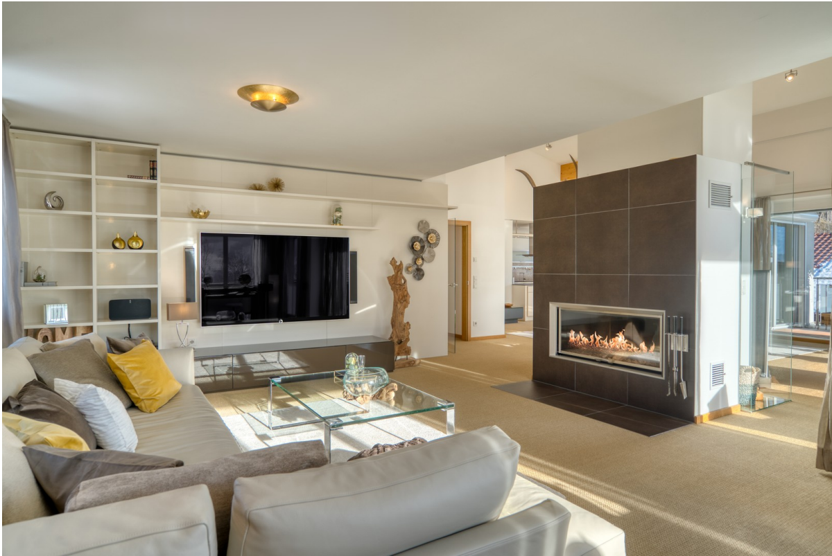
Der Wohnraum mit Kamin