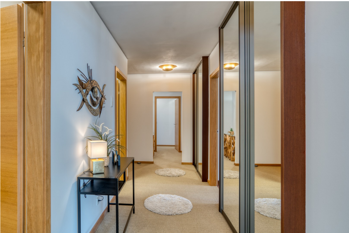
Diele inkl. Garderobenschränke