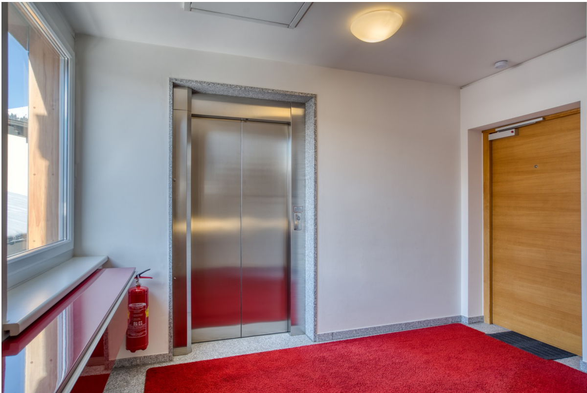
Treppenhaus mit Lift