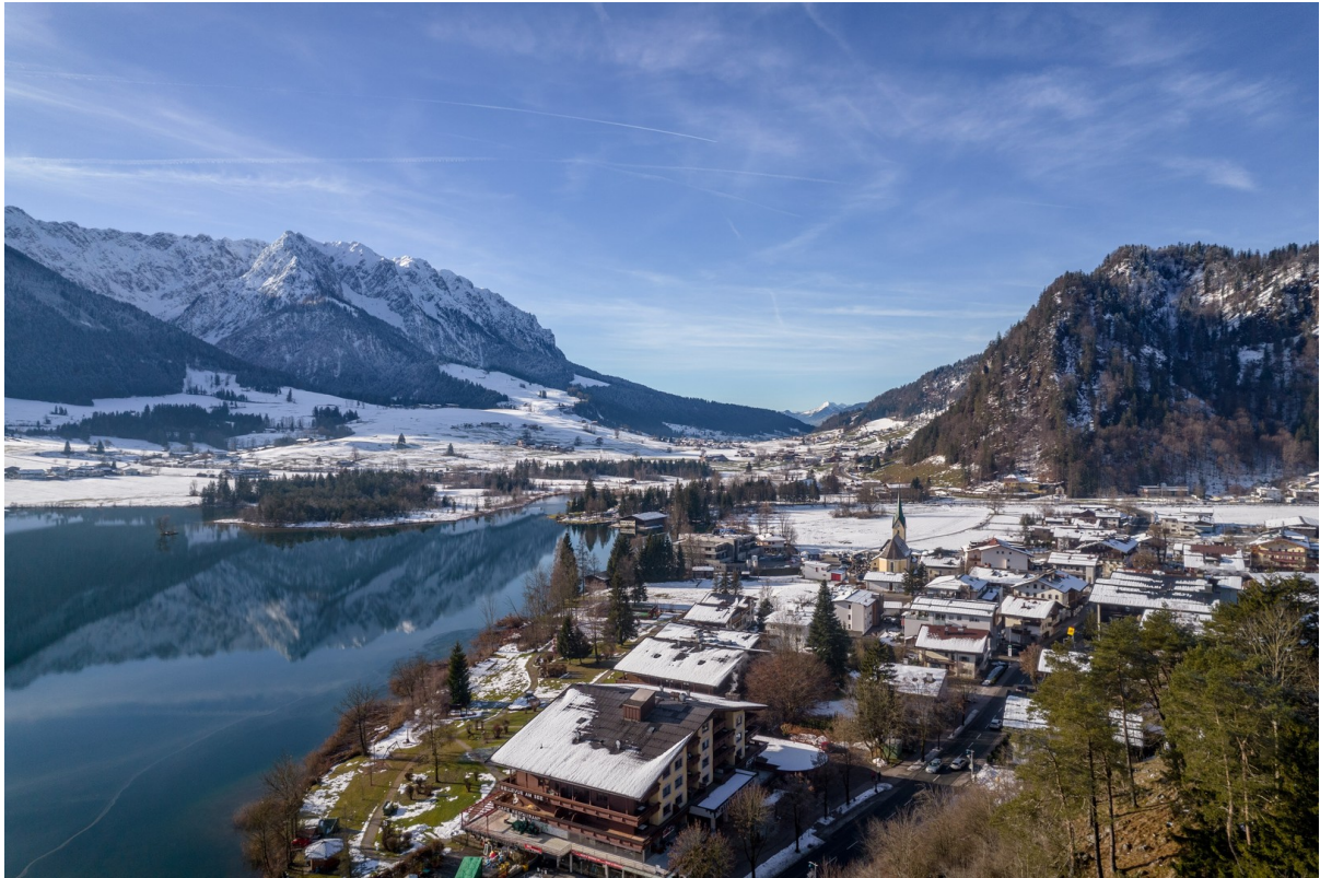
Sonnenplateau am Kaisergebirge