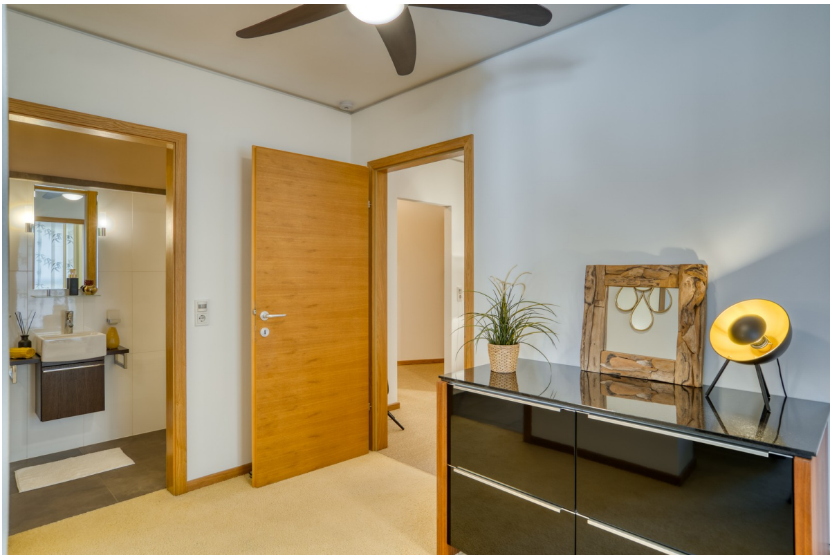
Vorraum Elternsuite mit WC