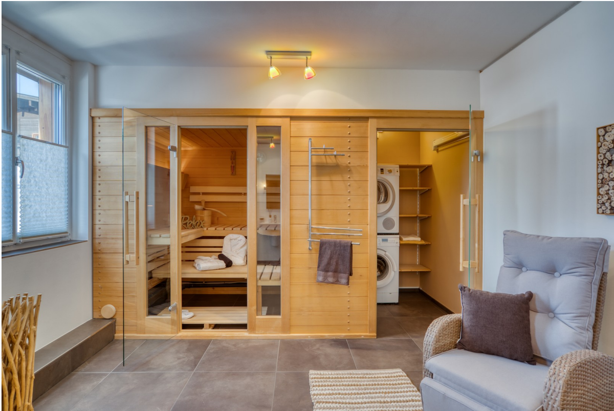
Finnische Bio-Sauna + HWR