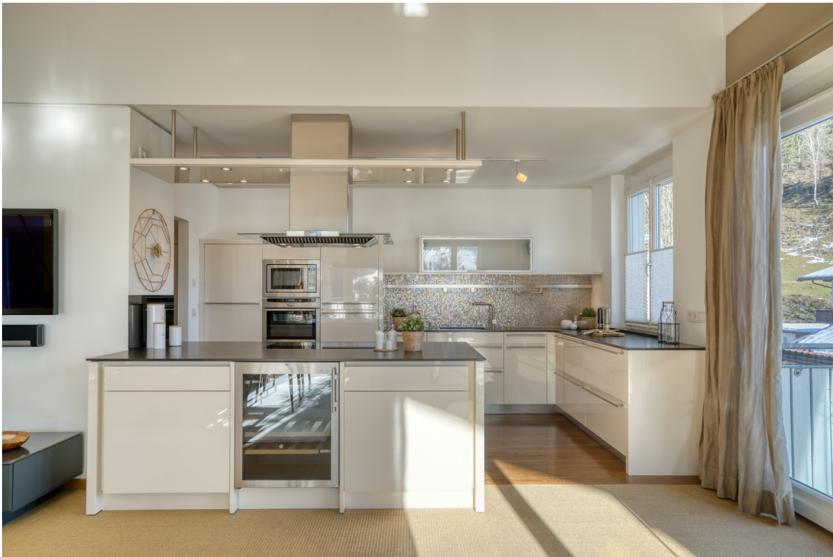
Die hochwertige Luxus-Küche