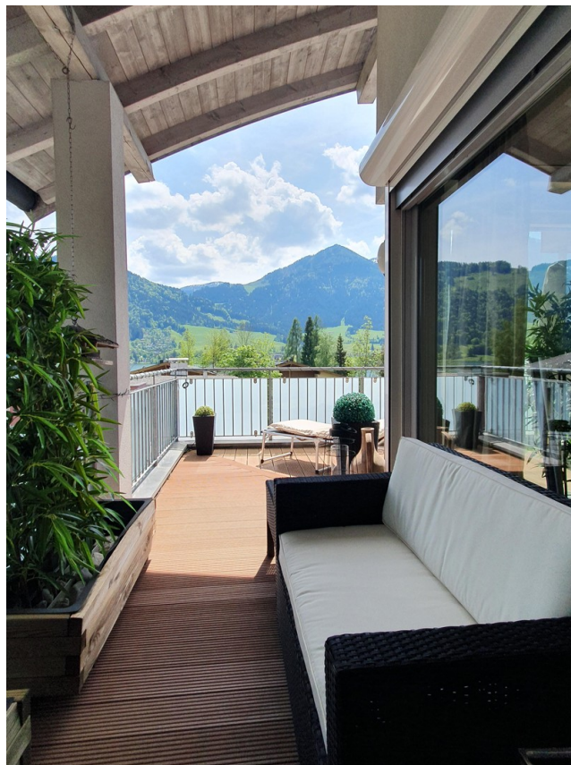
Morgenslounge - Ostseite