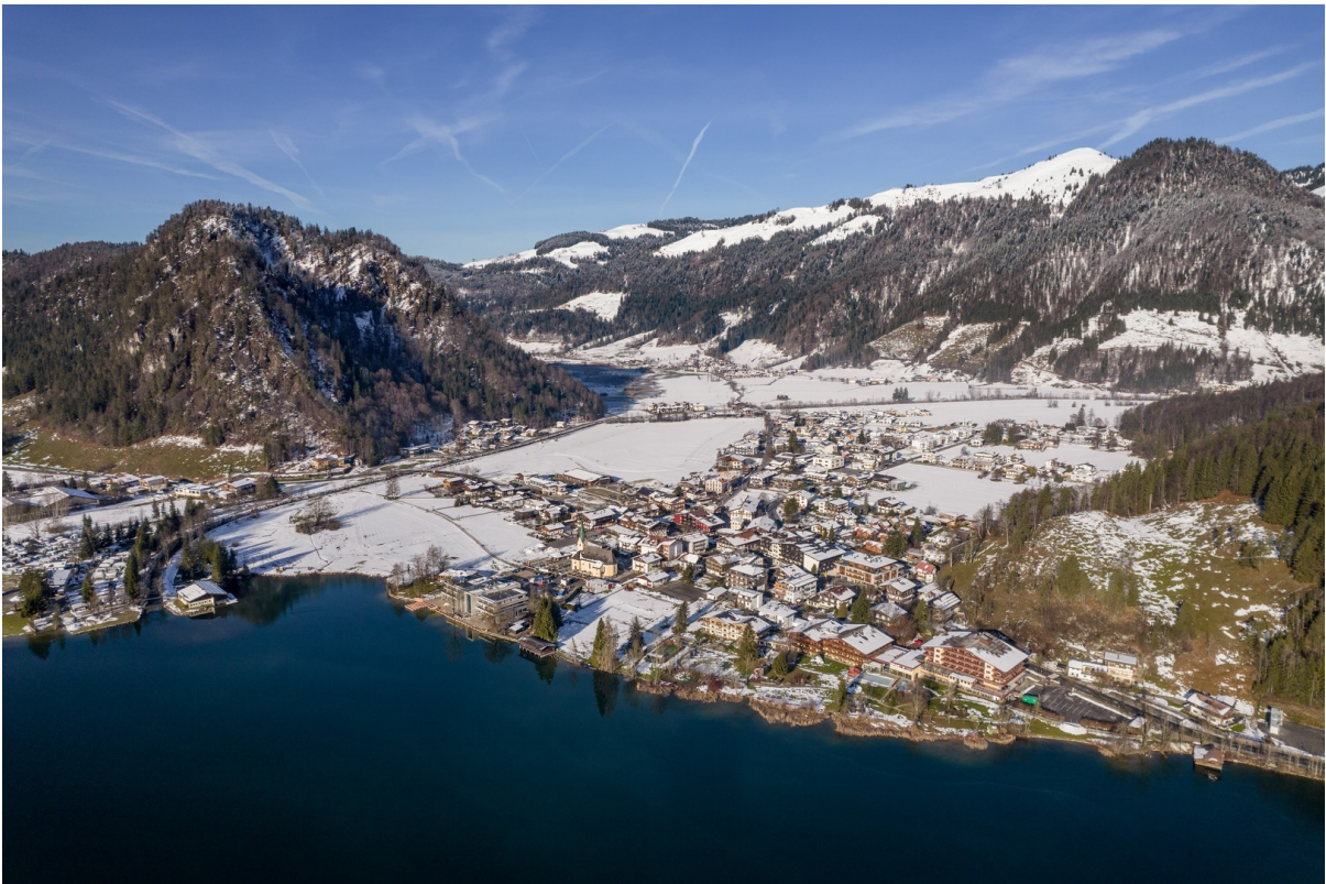
Walchsee - nahe Kitzbühel