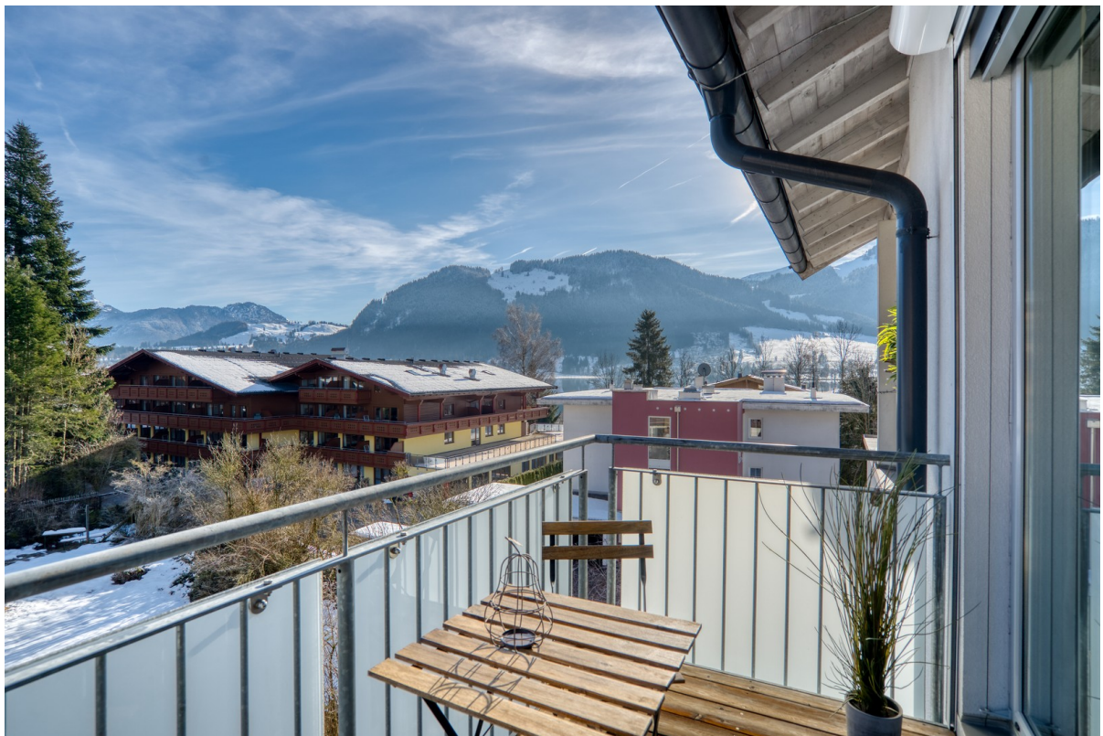
Der Ost-Balkon zum Frühstück