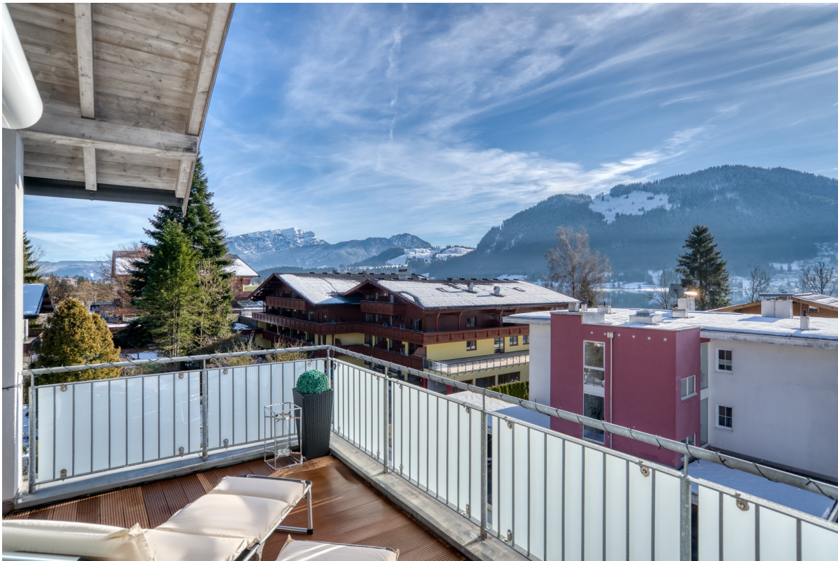
Die Süd-Ost Terrasse