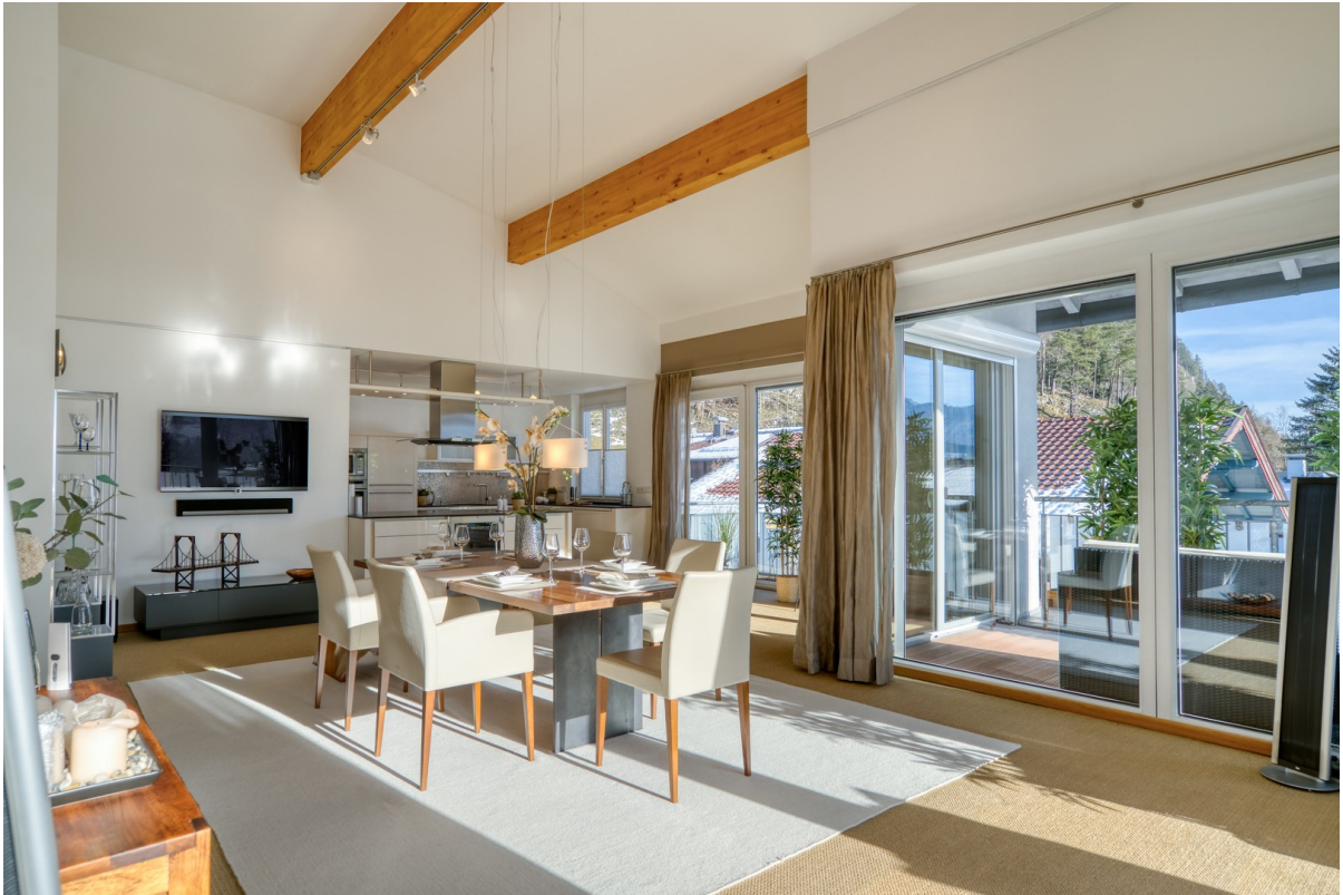
heller und edler Essraum