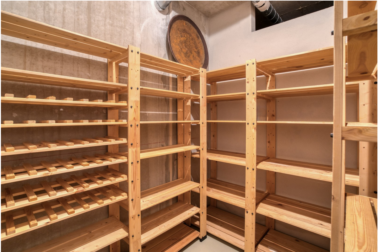
Weinkeller 6m 2