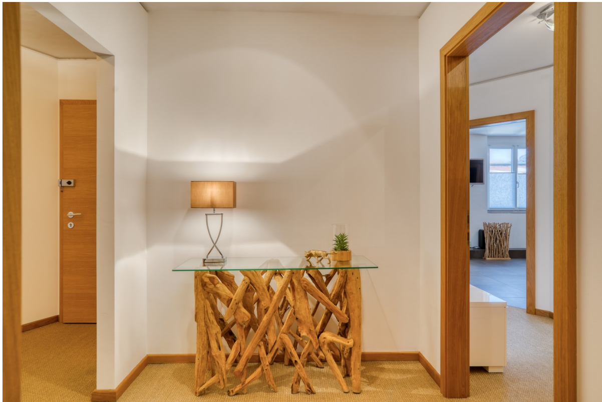
Vorraum zu den Suites