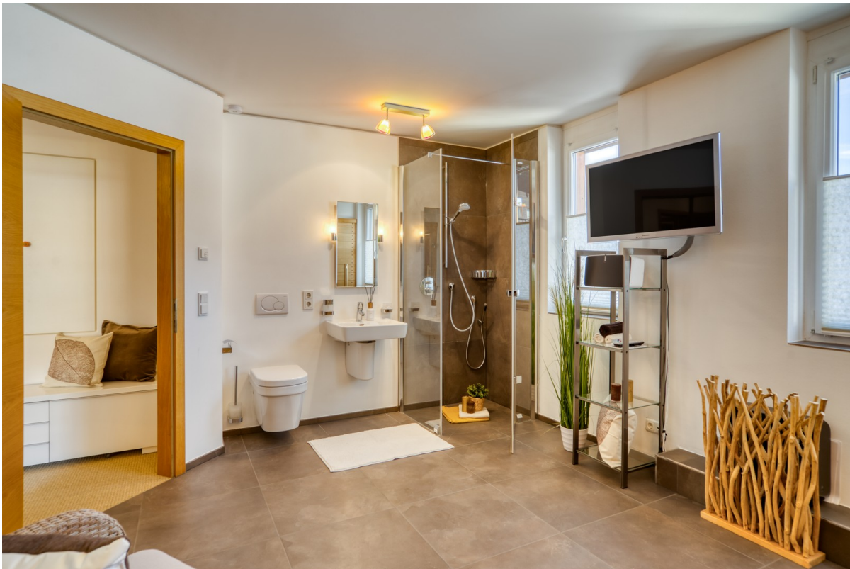
Gäste Bad mit Regendusche