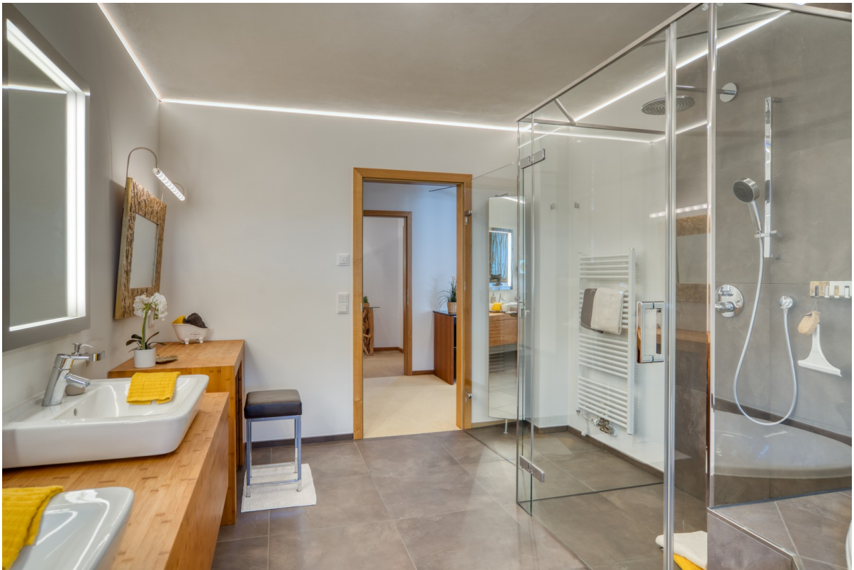
Das Masterbad mit Regendusche