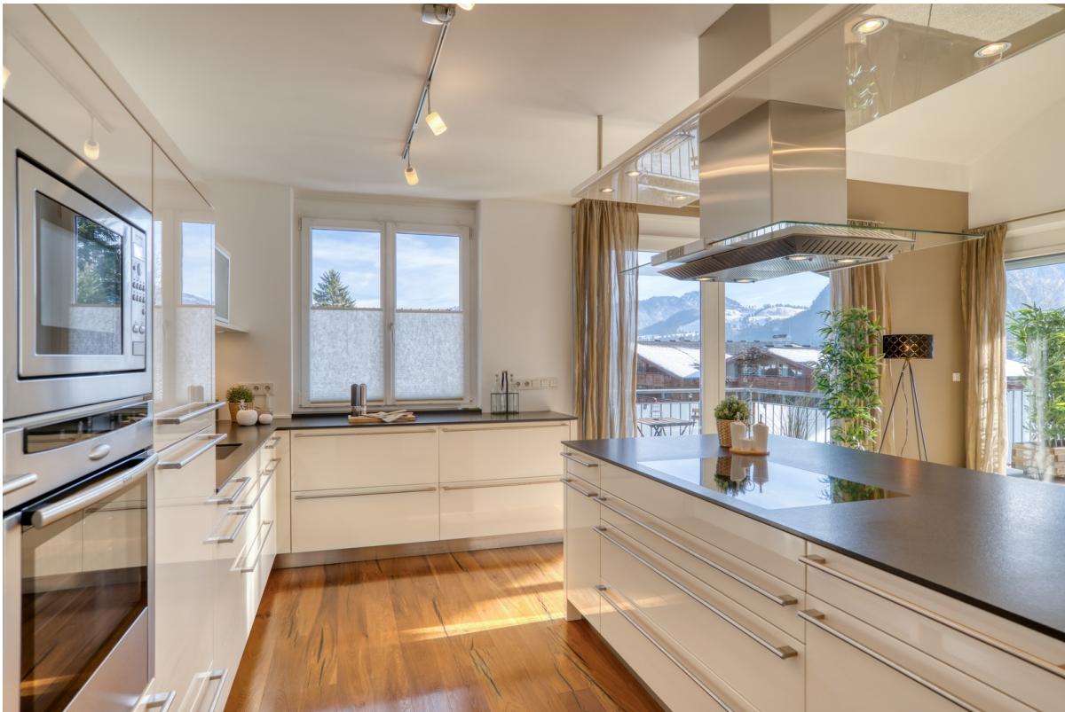
Ihre Traumküche wartet auf Sie