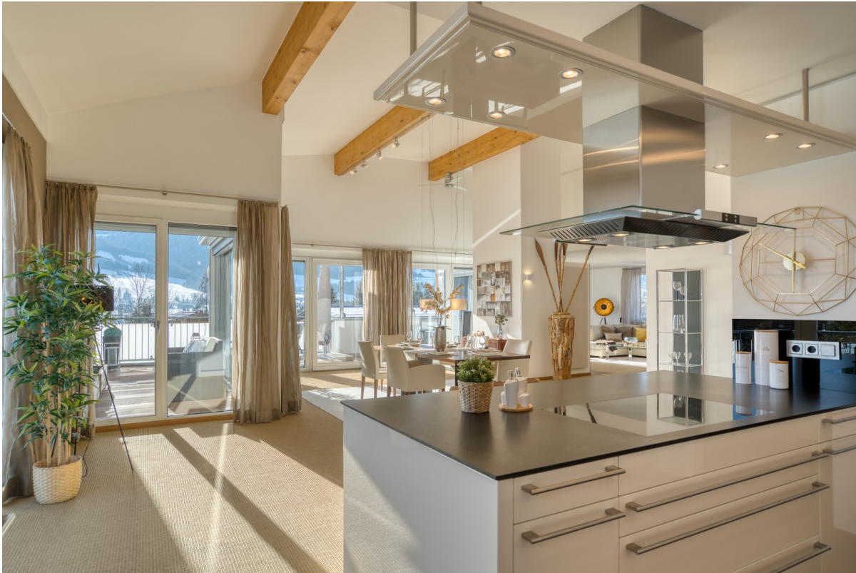
Essraum & Kochinsel