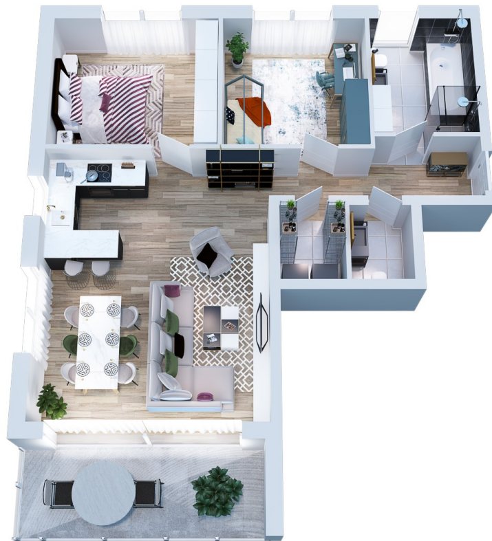
Erdgeschoss Wohnung 1