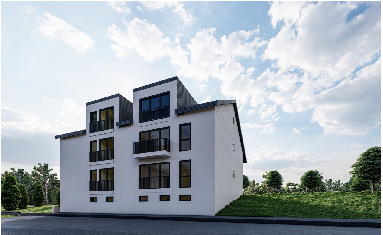
Ansicht Straße II