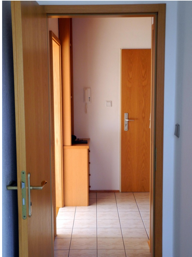
Vorraum / Garderobe