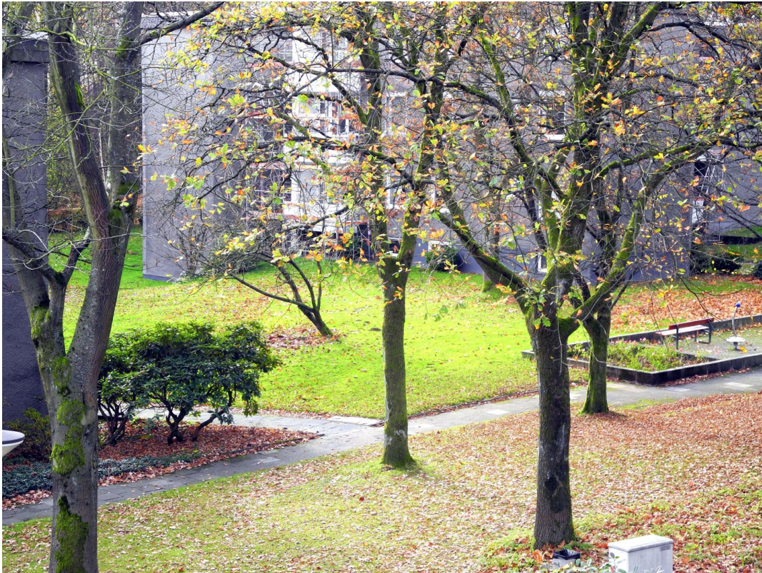
... und nach rechts