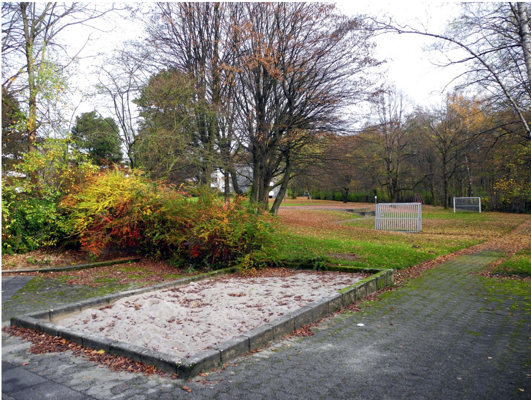
Sandkasten / Spielflächen