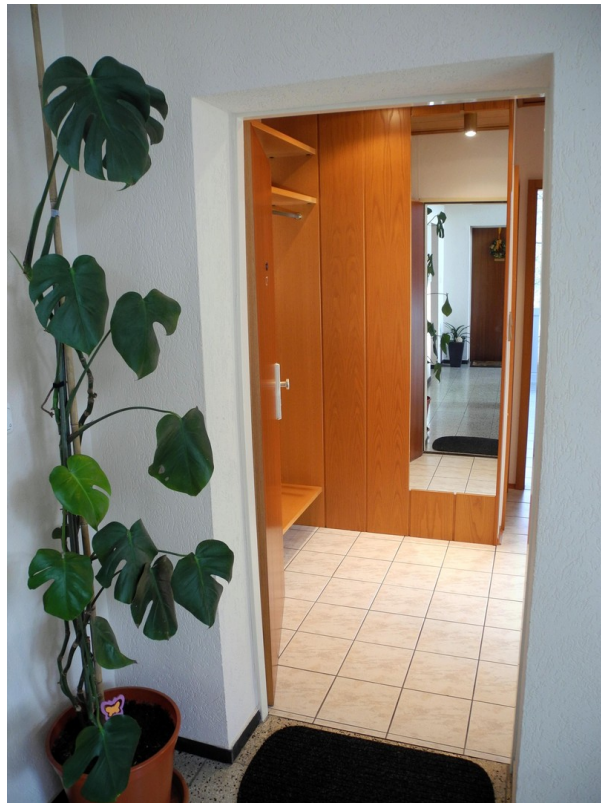
Wohnungseingang mit Vorraum