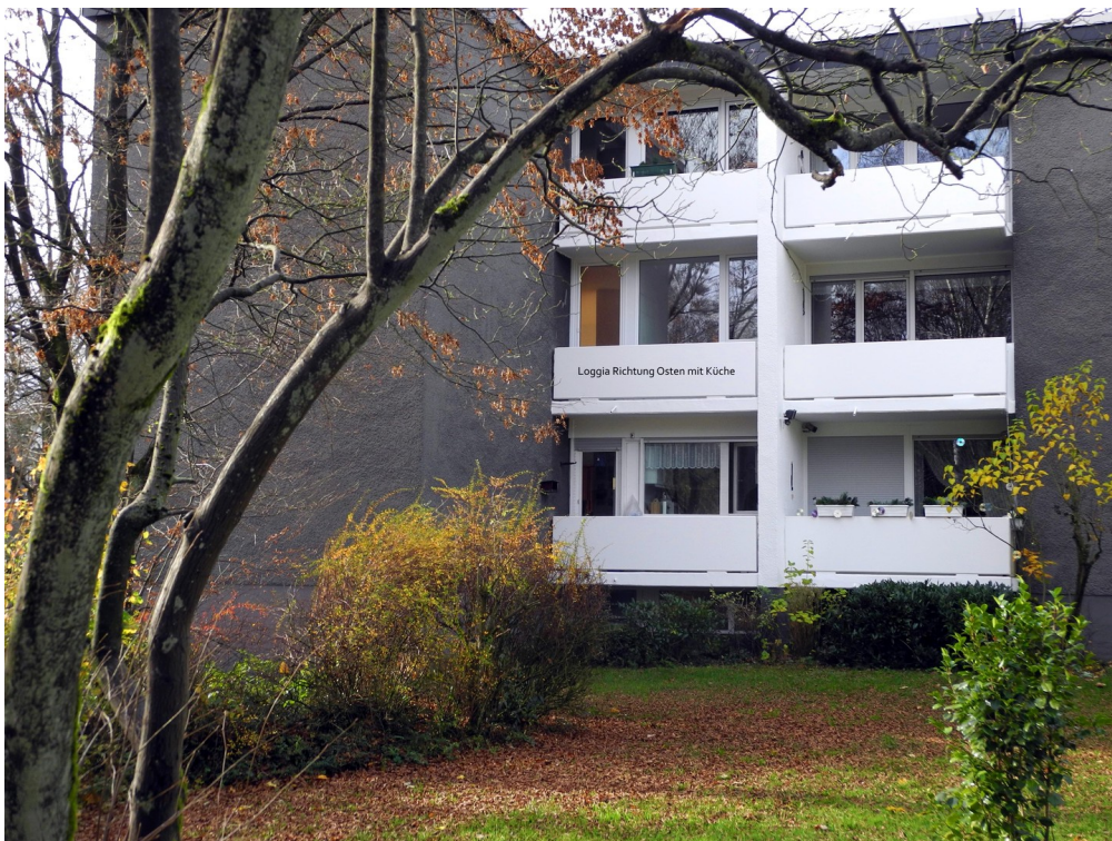
Blick auf Loggia Ost + Küche