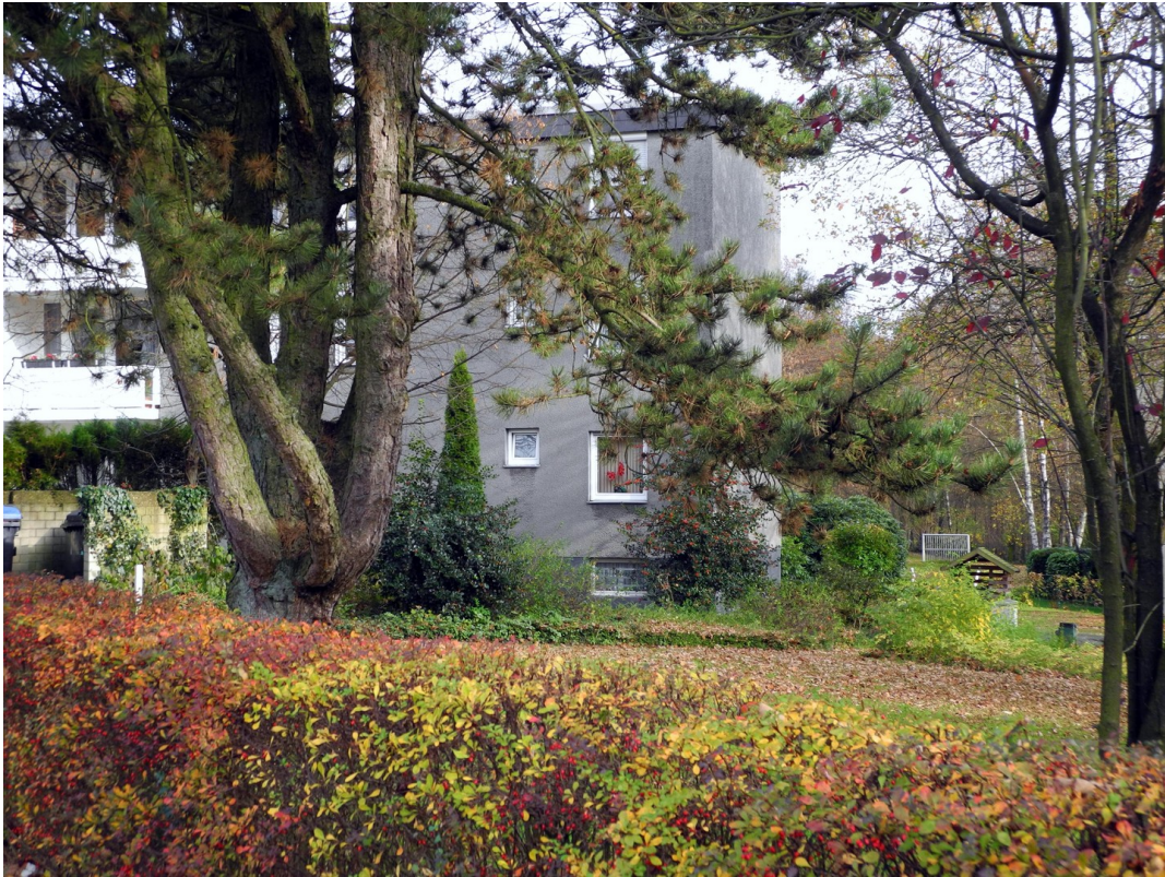
Das Haus aus der Nähe