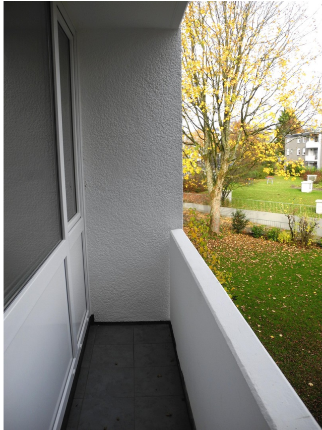
Ausblick von Loggia Ost