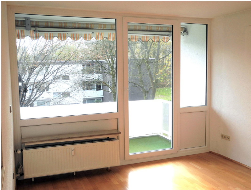
Wohnzimmer und Loggia Süd