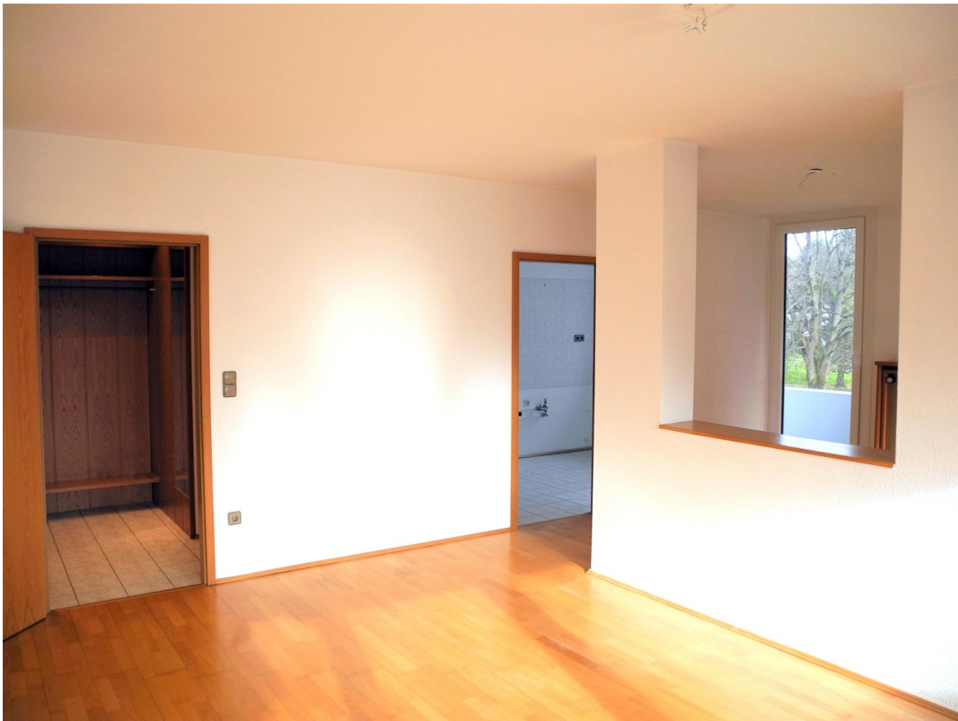
WZ, Vorraum, Küche und Essz.