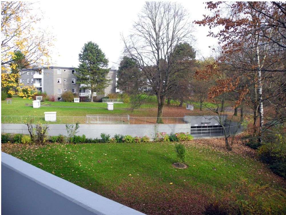
Park mit Tiefgarage