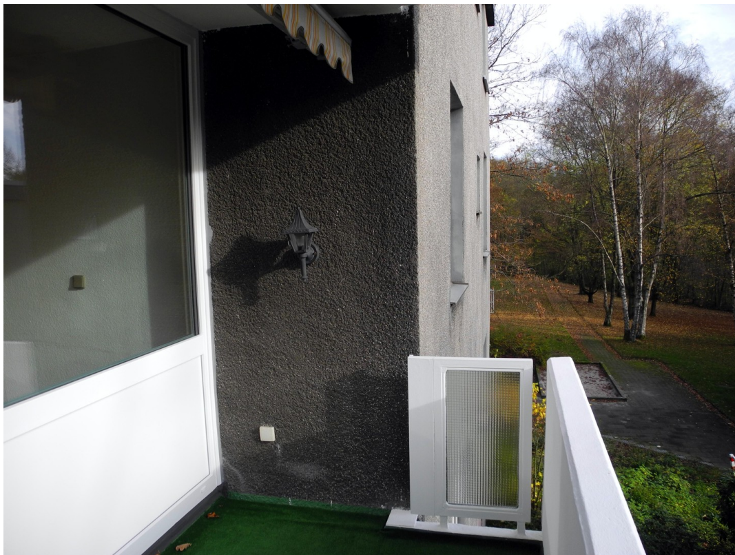
Blick von der Loggia n. links