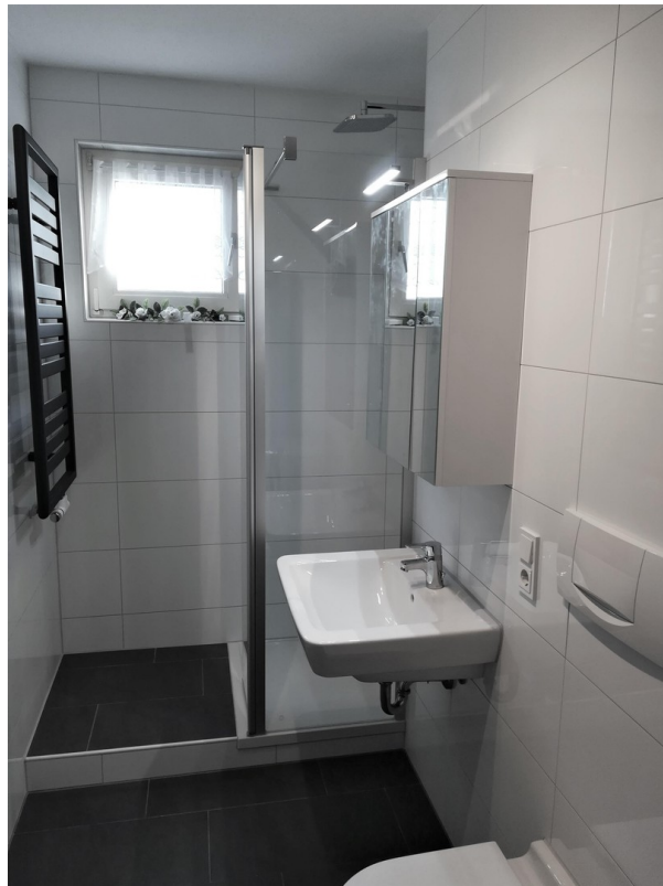
... behindertengerecht saniert