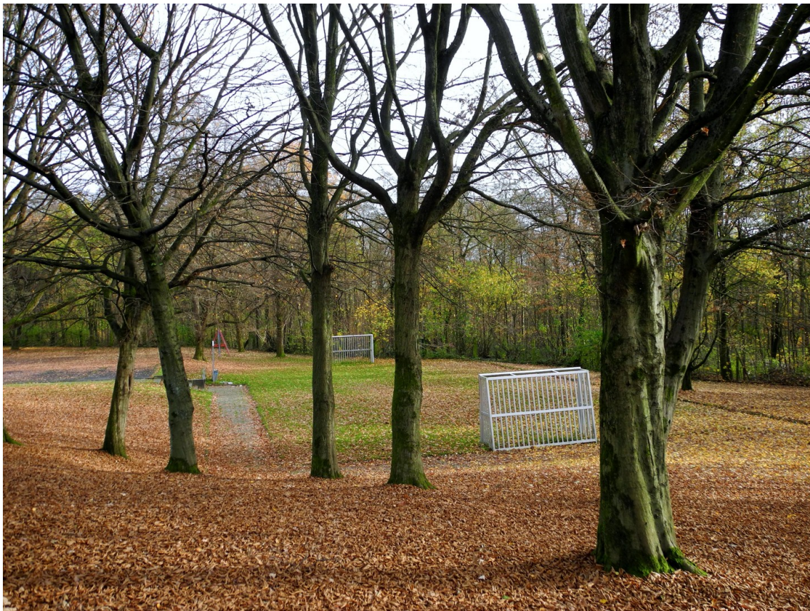
Park der Wohnanlage