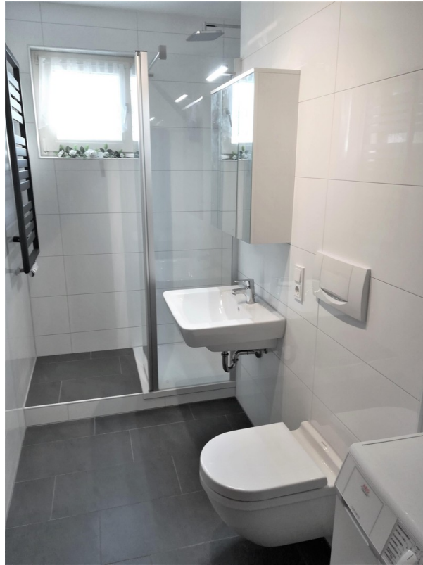
Bad - 2020 ...