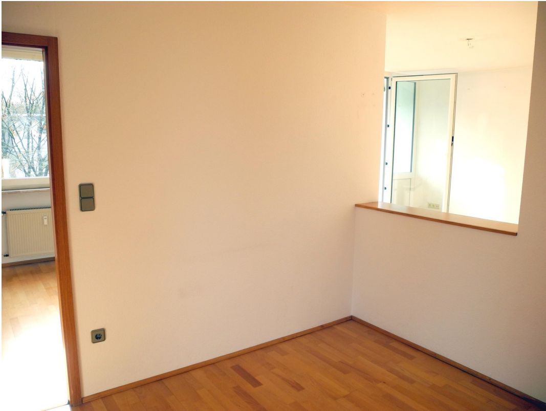
Essz. (vorne), WZ + Kinderz.