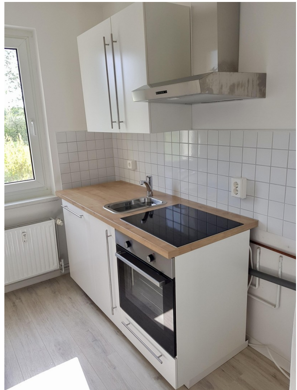
Küche mit Einbauküche