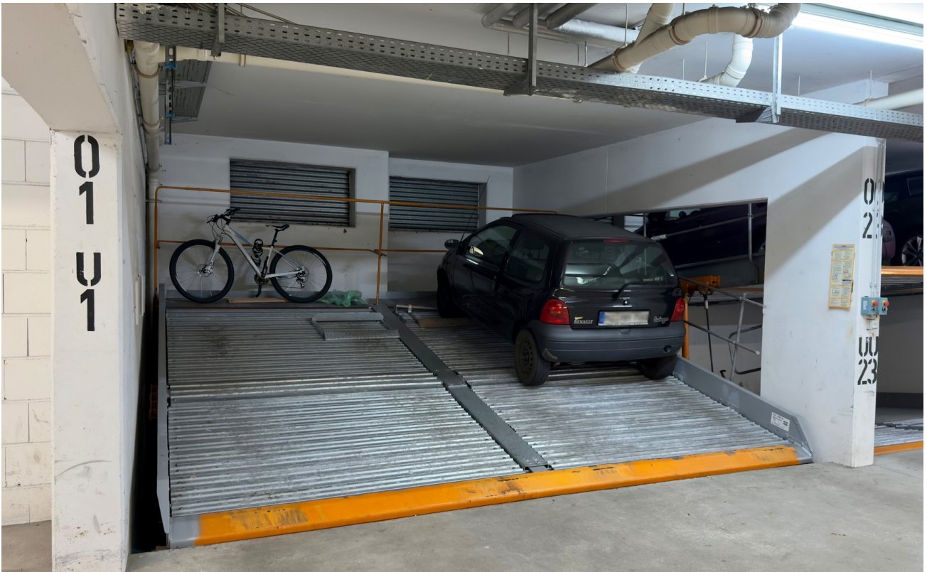
Duplex Stellplatz (links)