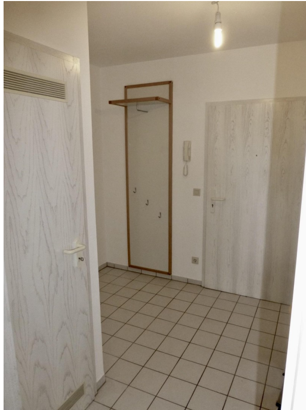
Eingangsbereich / Flur