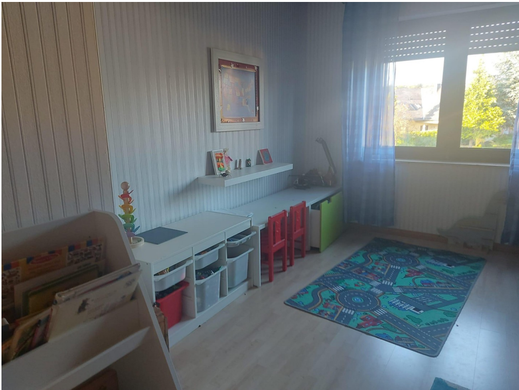
Kinderzimmer 1.OG Bild 2