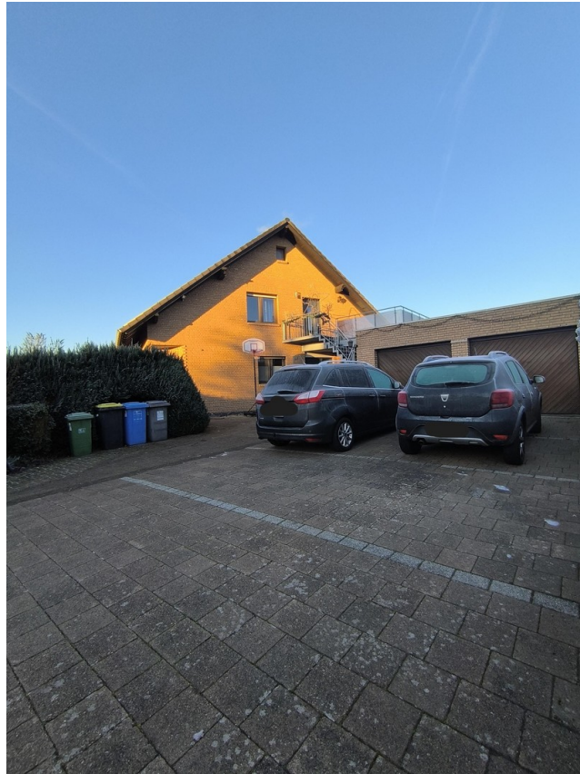
Stellplätze und Garagen 1