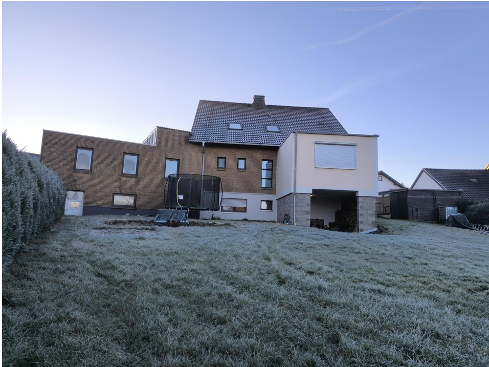
Haus aus Gartensicht