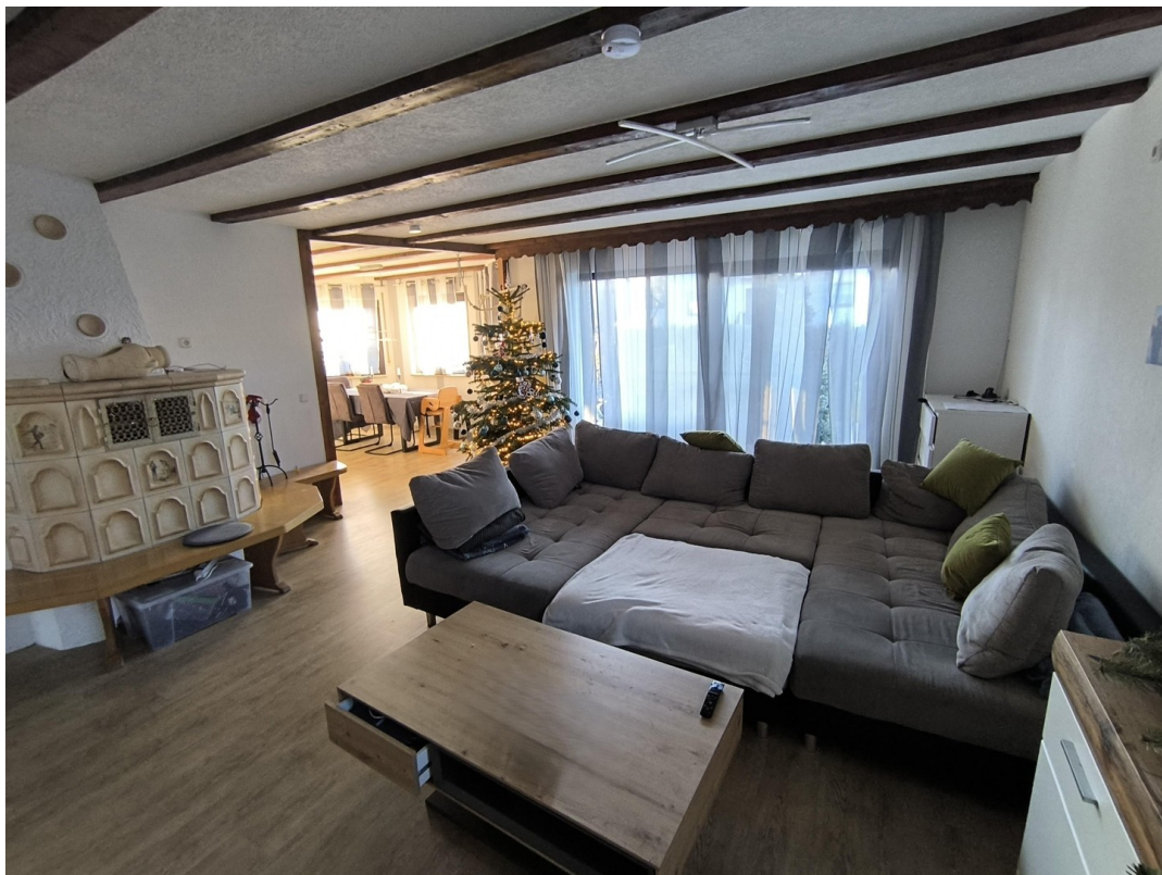
Wohnzimmer mit Kachelofen