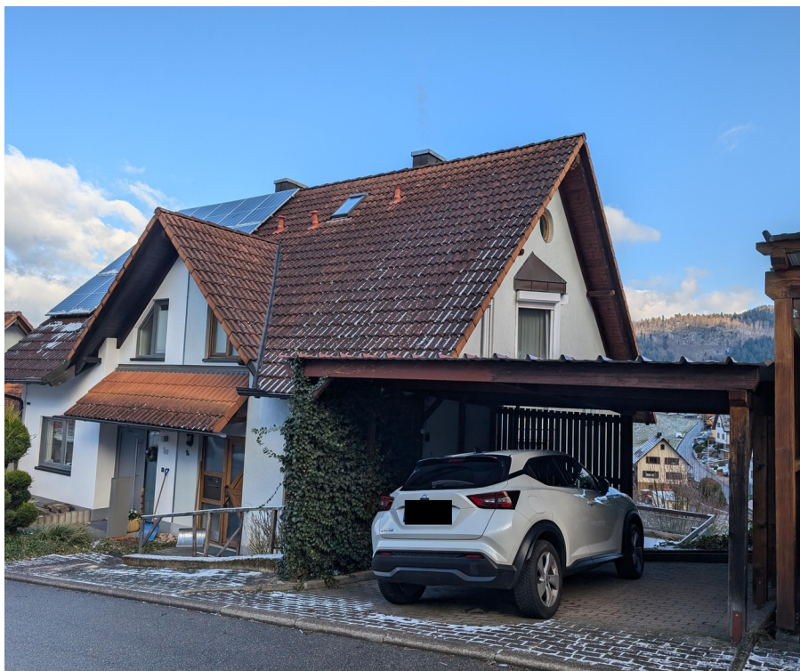
Ansicht von Vorne