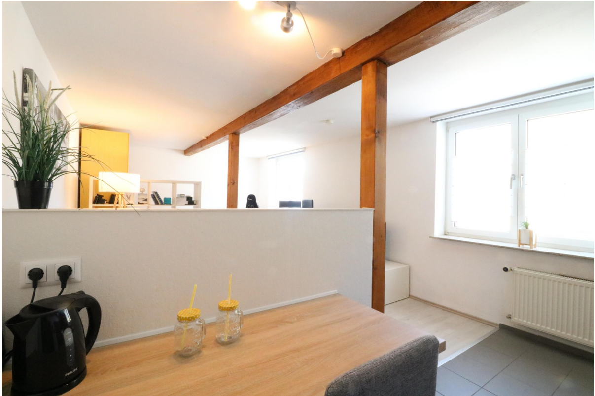
Ess- und Wohnbereich 1Z Apt