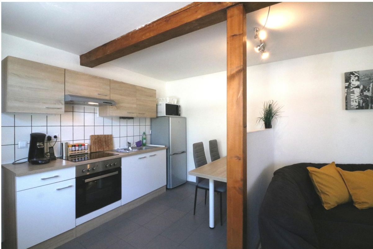
Küche und Essbereich 1Z Apt