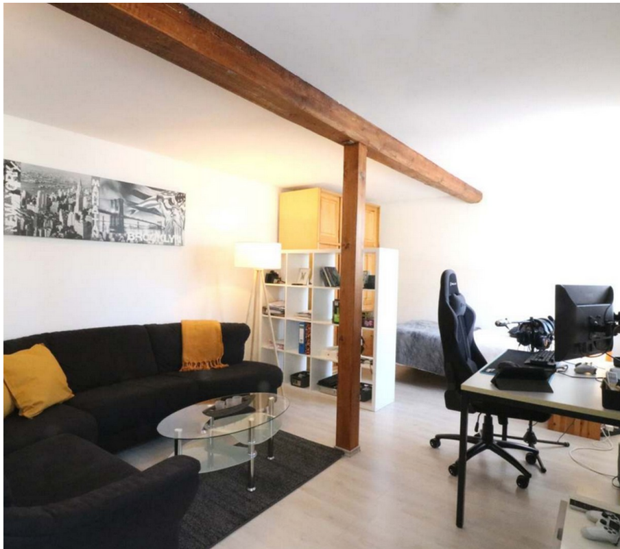
Wohn- und Schlafbereich 1Z Apt