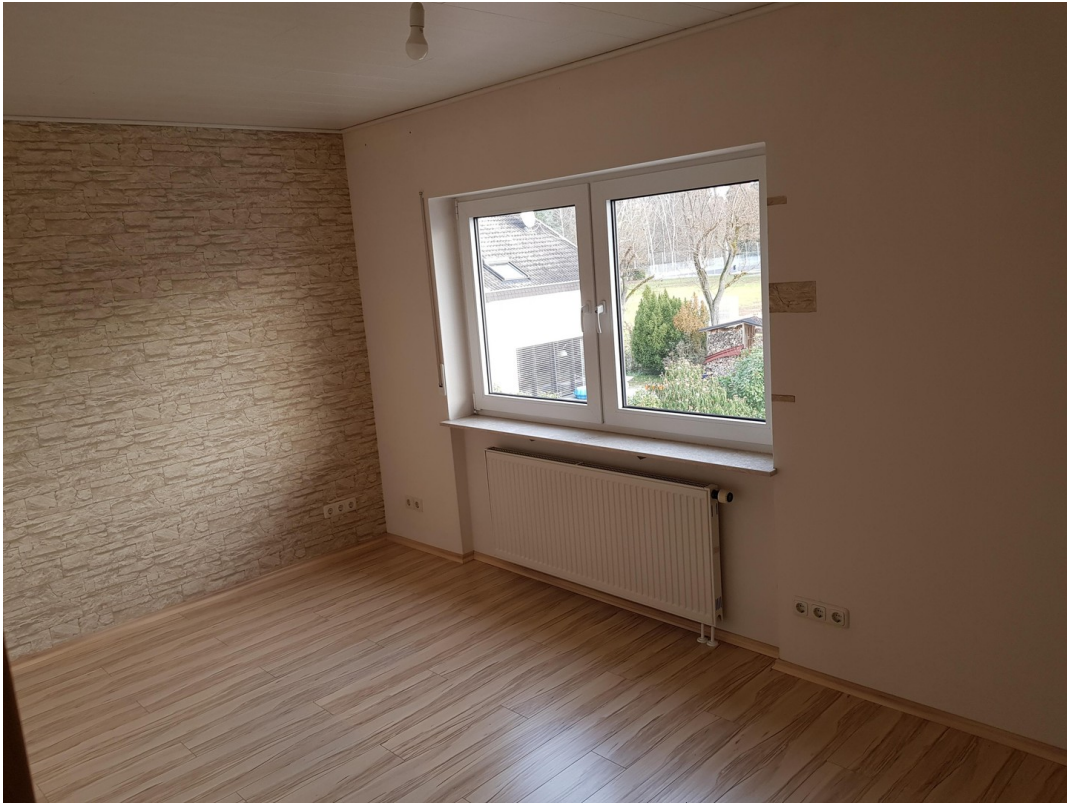
Kinder- Gäste- Arbeitszimmer