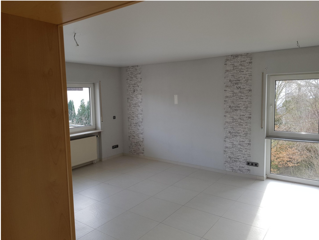
Wohn- und Esszimmer