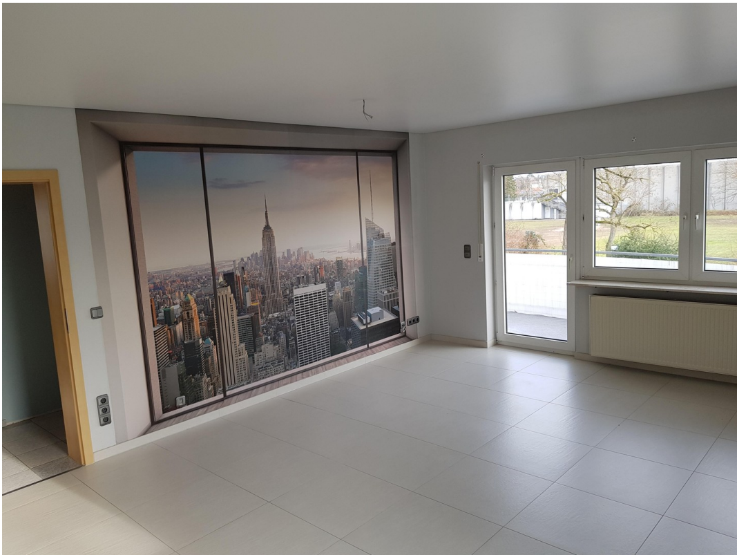
Wohn- und Esszimmer