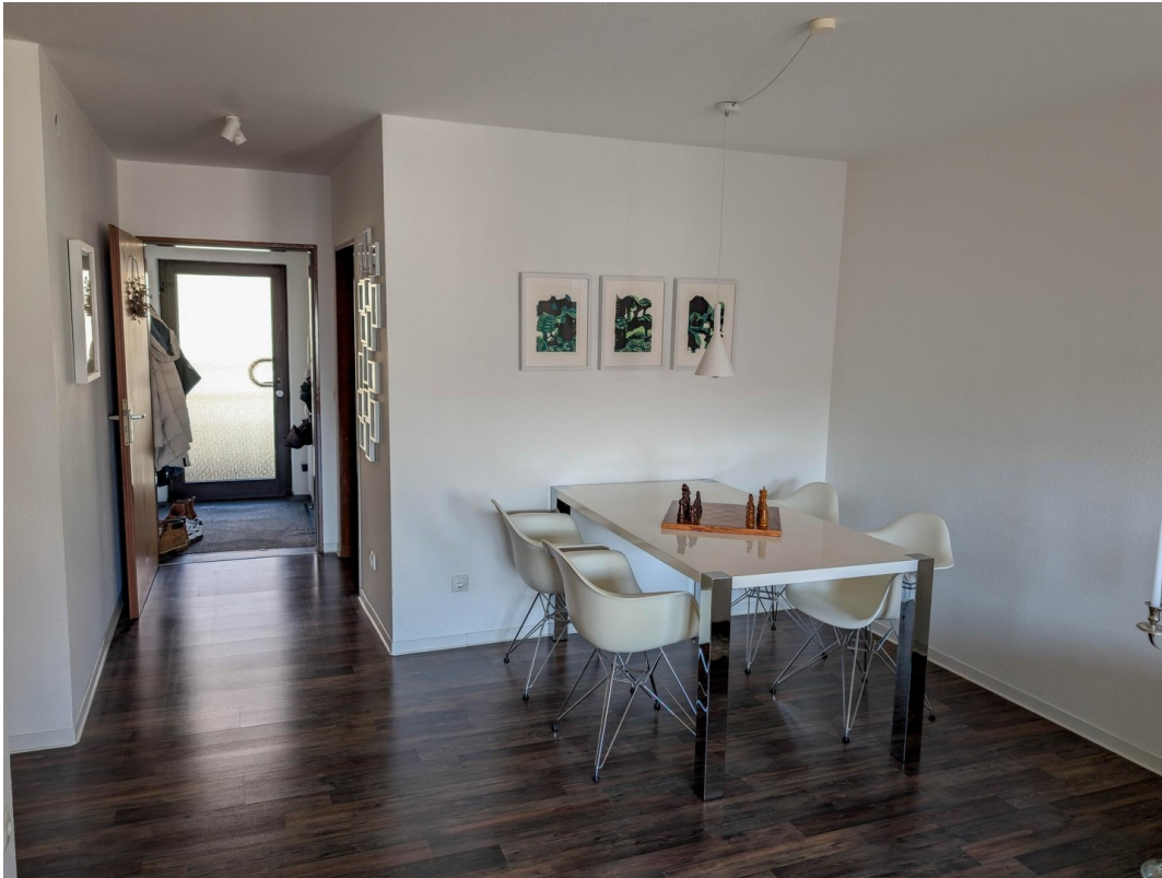
Wohnzimmer / Esszimmer