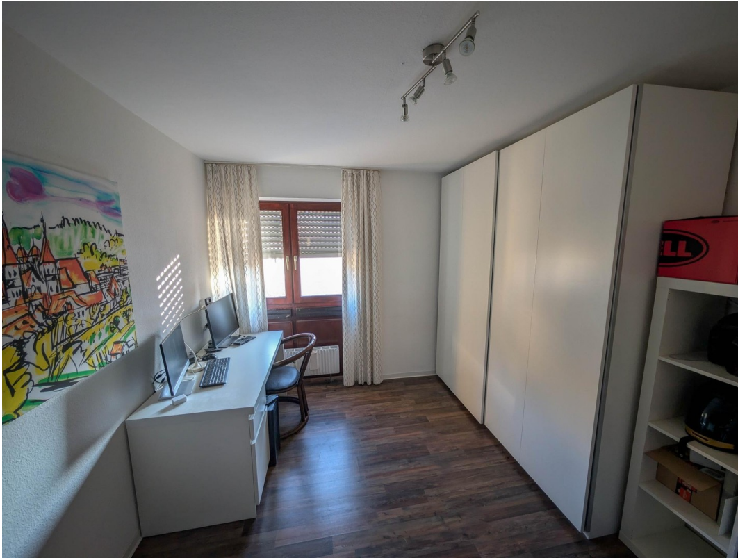
Arbeitszimmer / Kinderzimmer