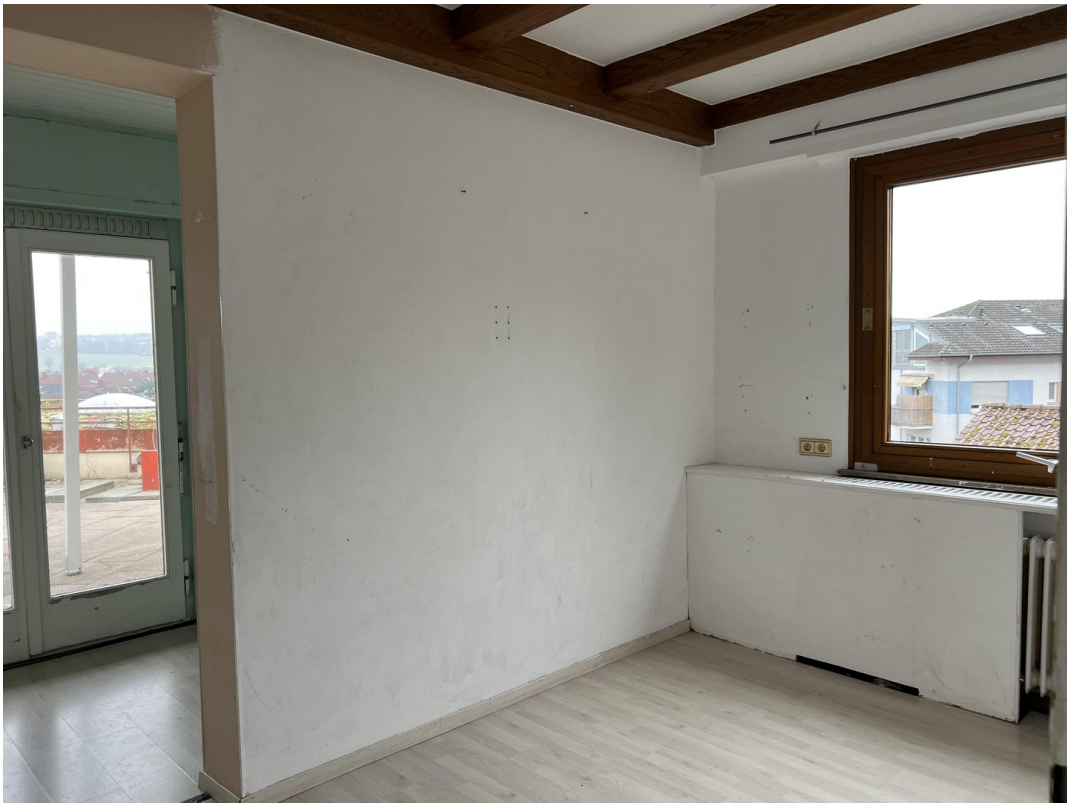
super Aufteilung - originell !