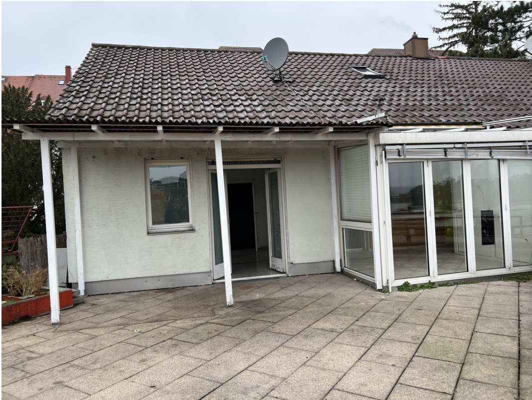
Terrasse mit Wintergarten