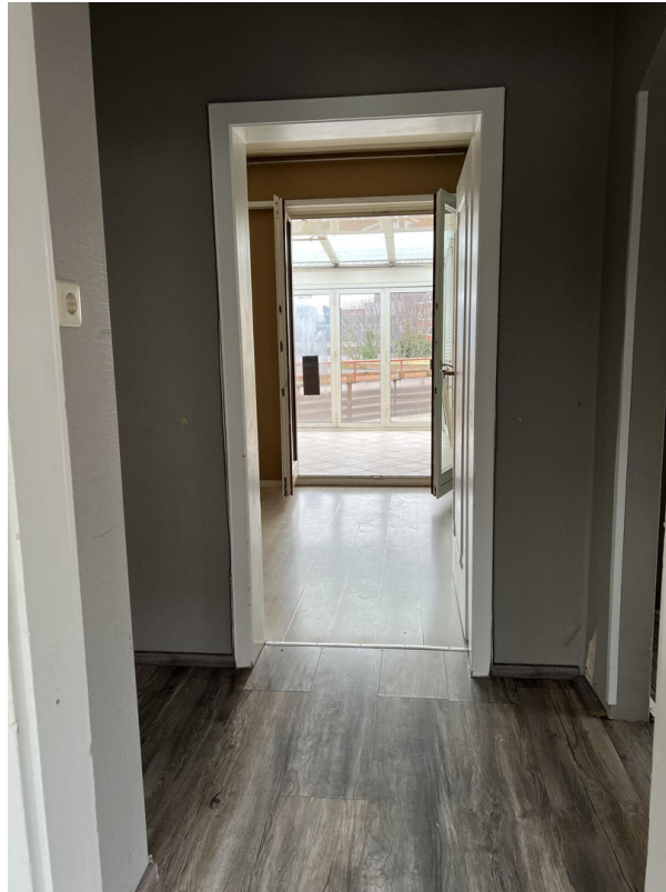
Zimmer2 & Ausgang Wintergarten