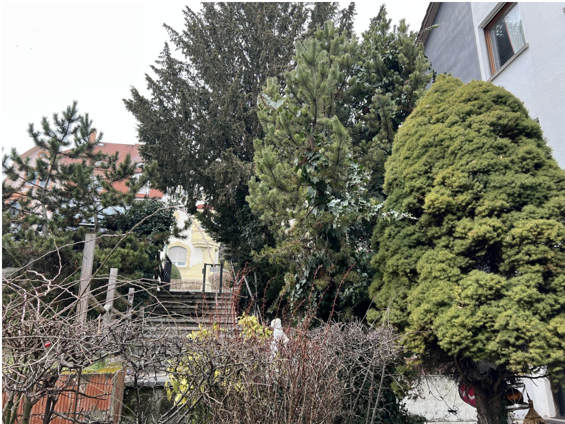
sehr gute Lage