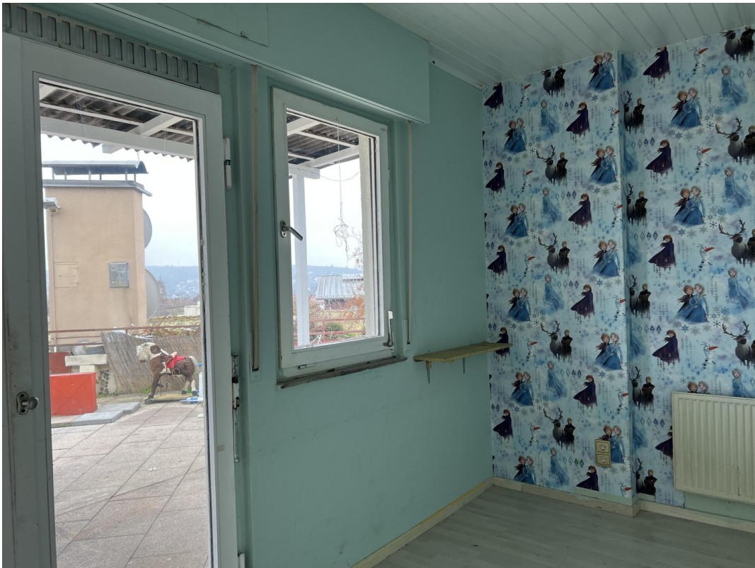
Eines der Kinderzimmer