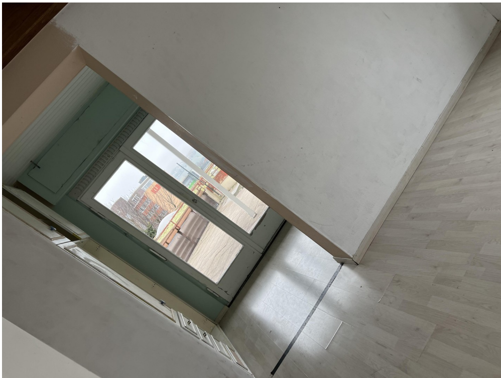
riesige und helle Zimmer