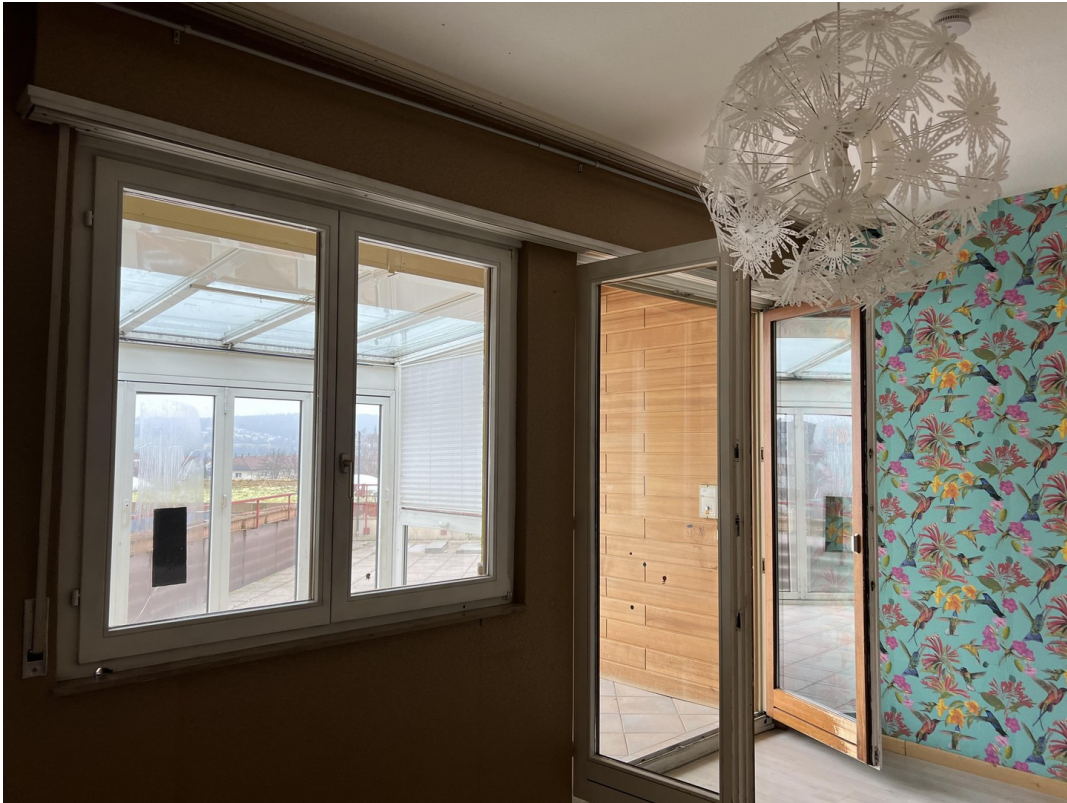
Zimmer + Ausgang Wintergarten