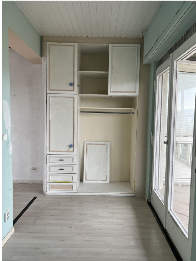
Eines der Kinderzimmer