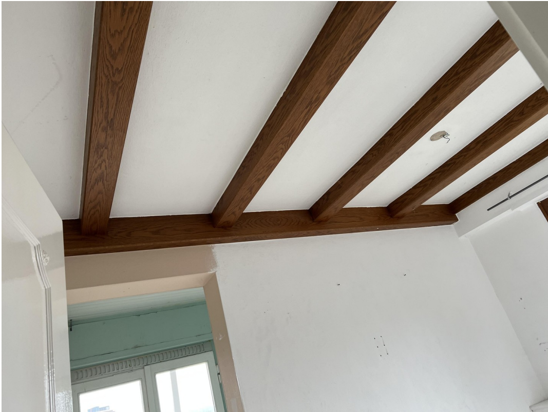
eine ausgefallene Wohnung