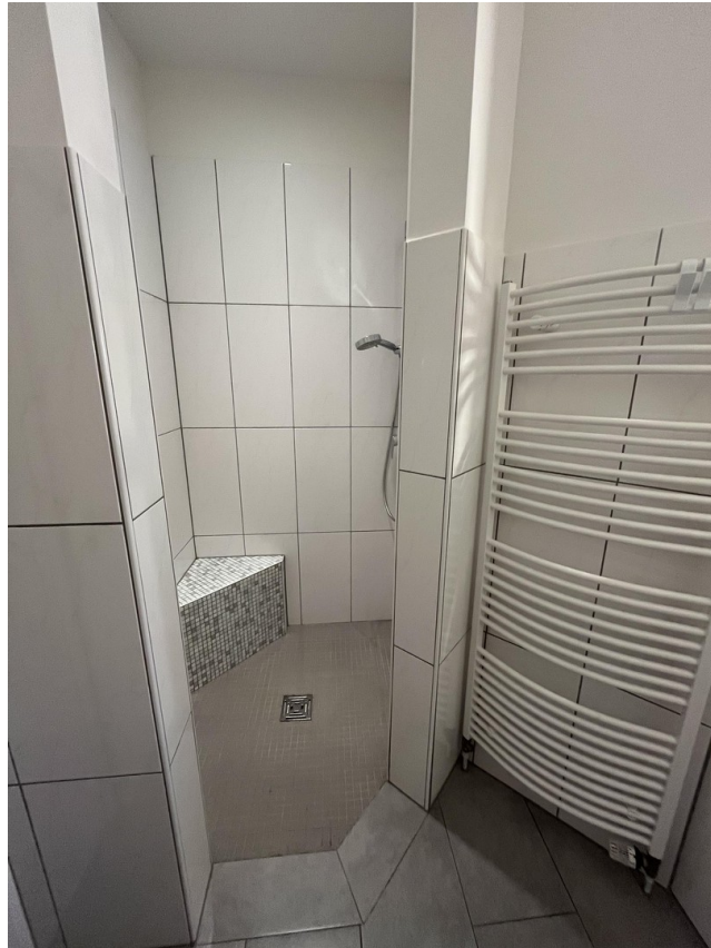
Begehbare Dusche EG