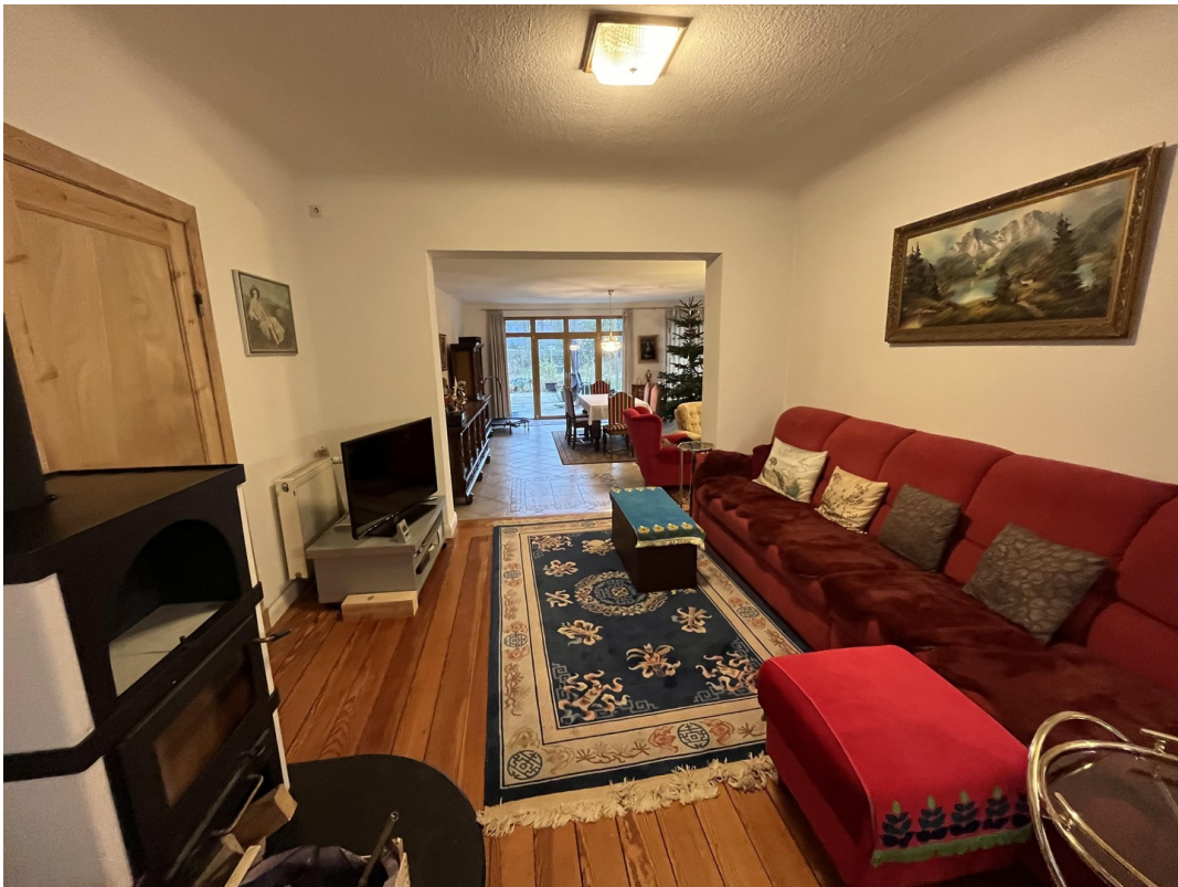
Dänischer Ofen EG