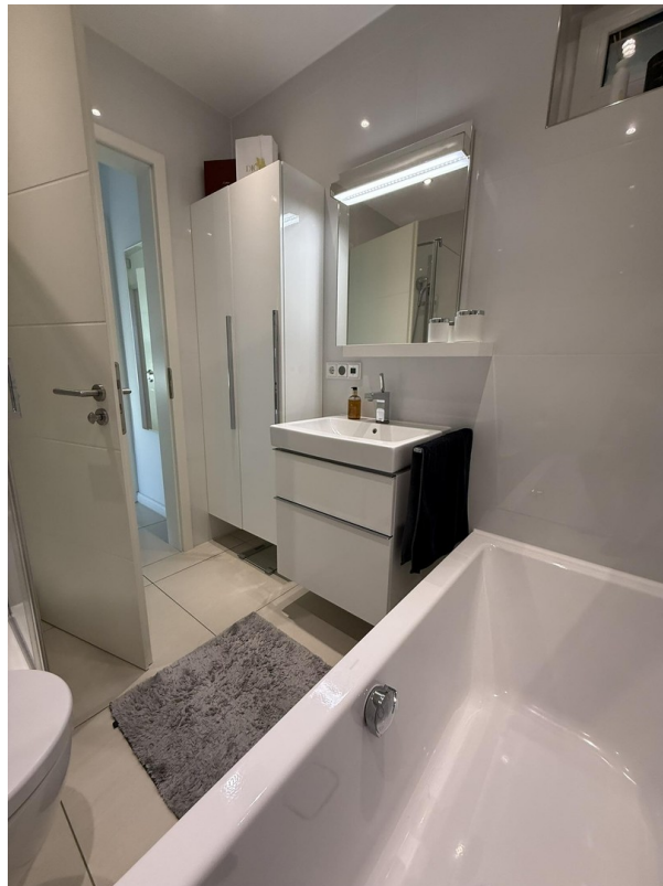
Wanennbad mit Dusche