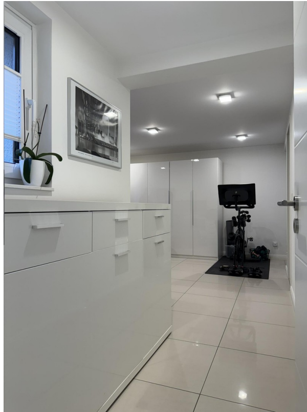
Arbeitszimmer / Schlafzimmer