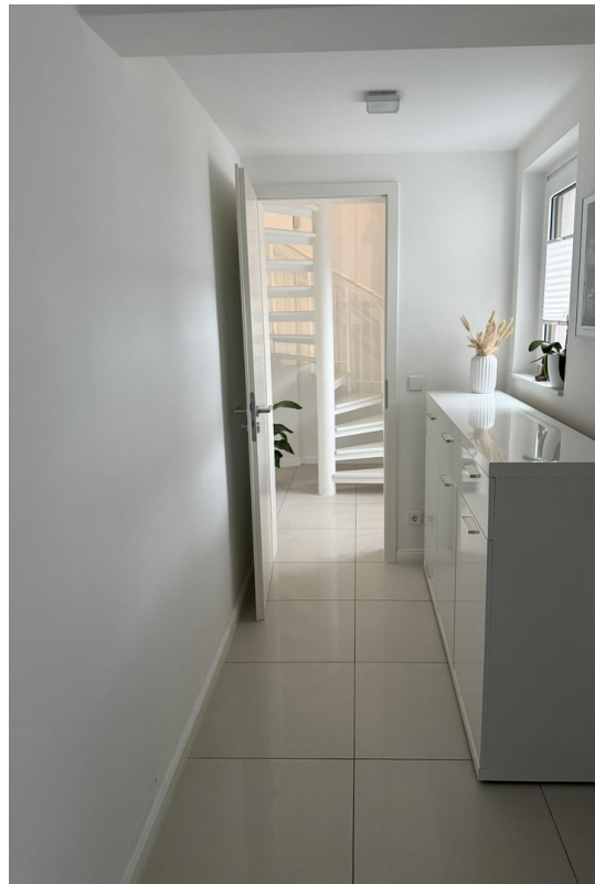
Arbeitszimmer / Schlafzimmer