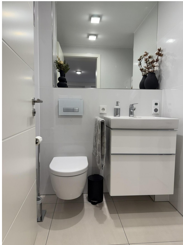
WC im Gartengeschoss