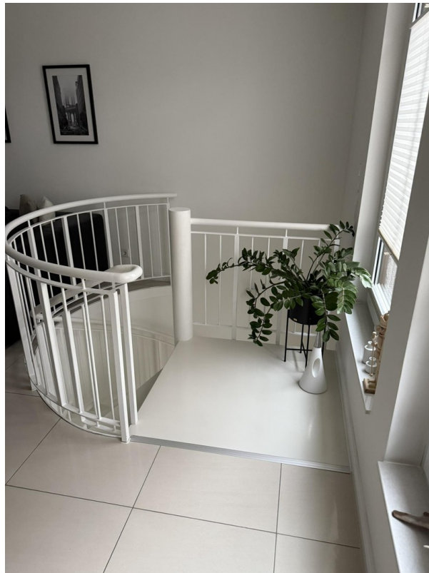
Treppe zum Gartengeschoss