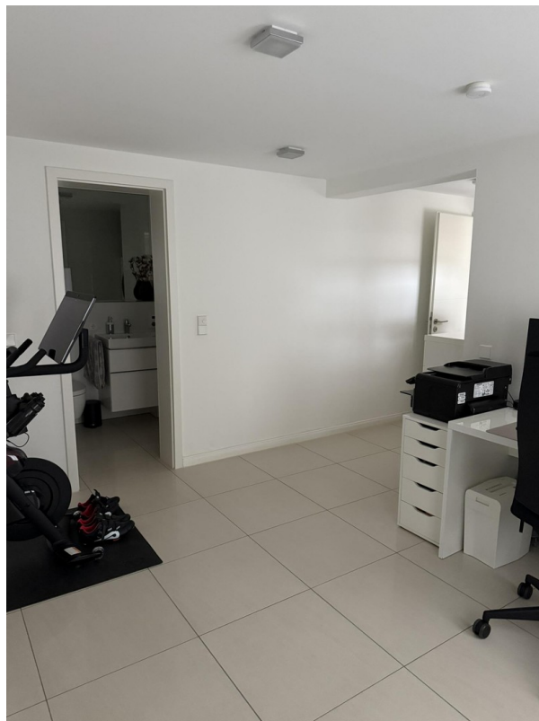
Arbeitszimmer / Schlafzimmer