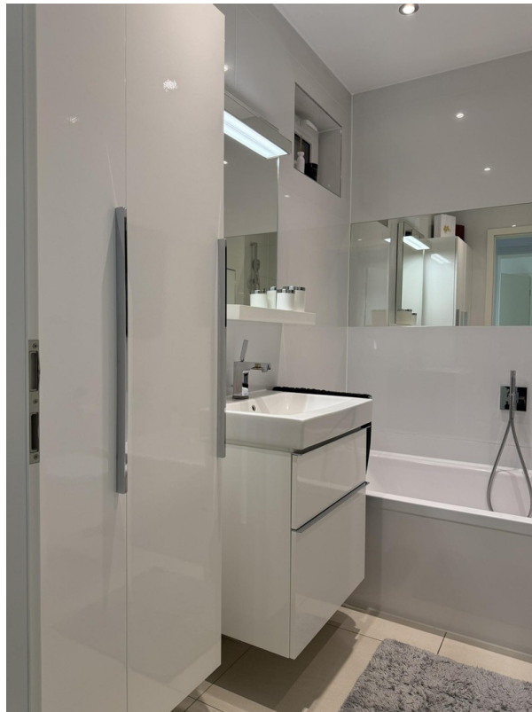
Wanennbad mit Dusche