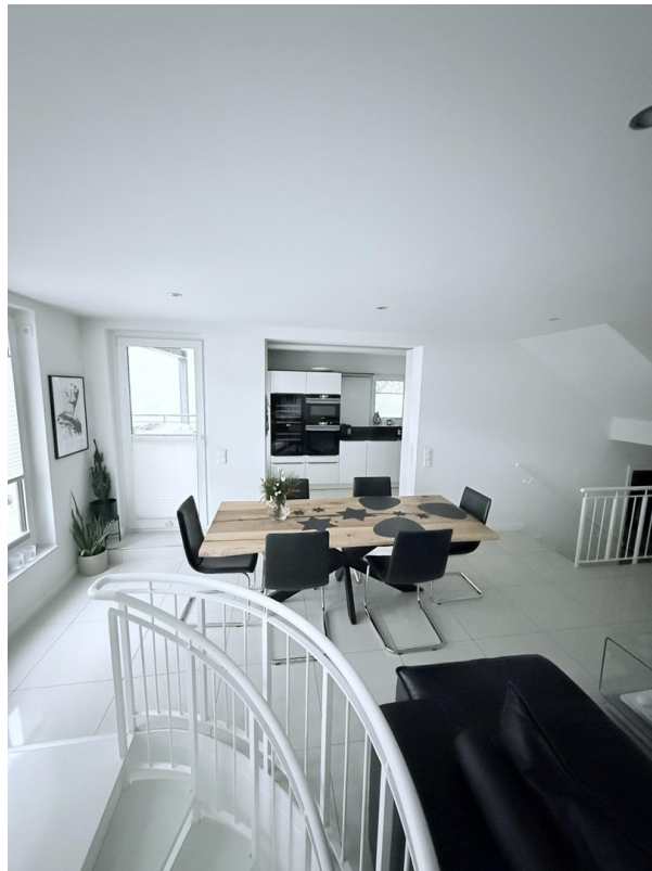
Wohnzimmer mit Blick zur Küche