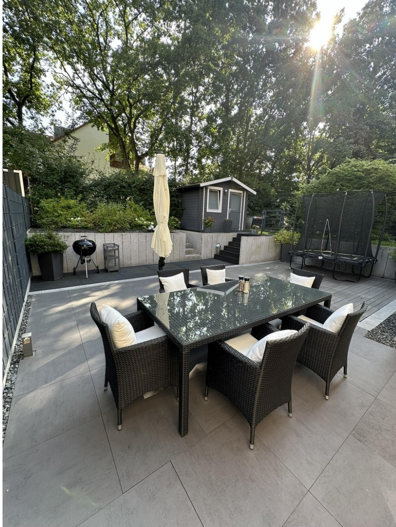
Terrasse im Garten