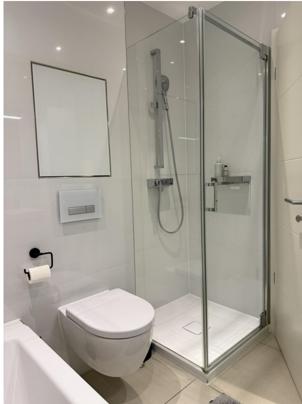
Wanennbad mit Dusche