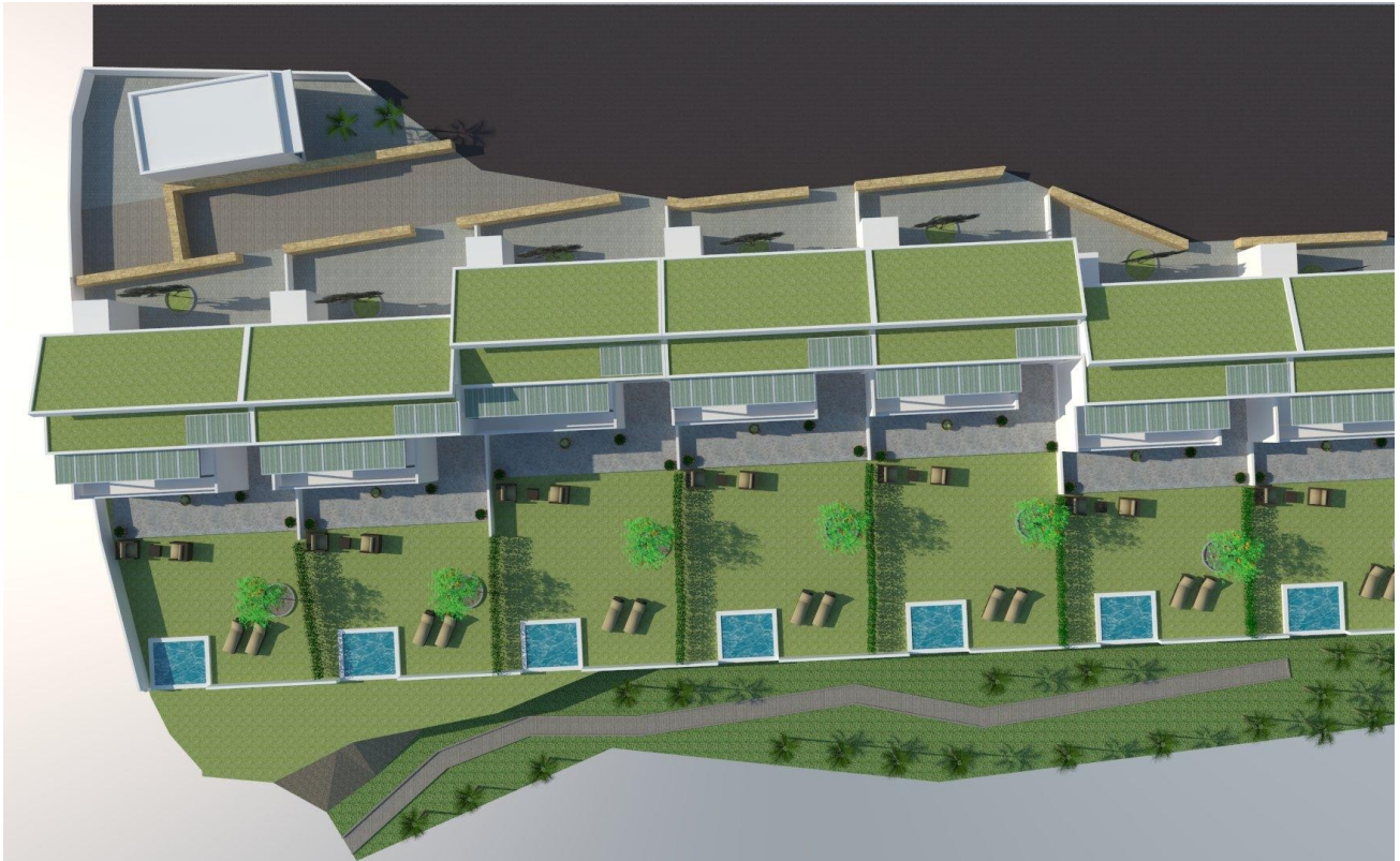
Ansicht von oben