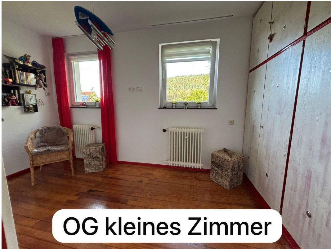
OG kleines Zimmer