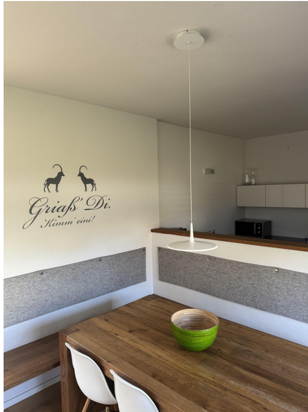
Essbereich mit Küche