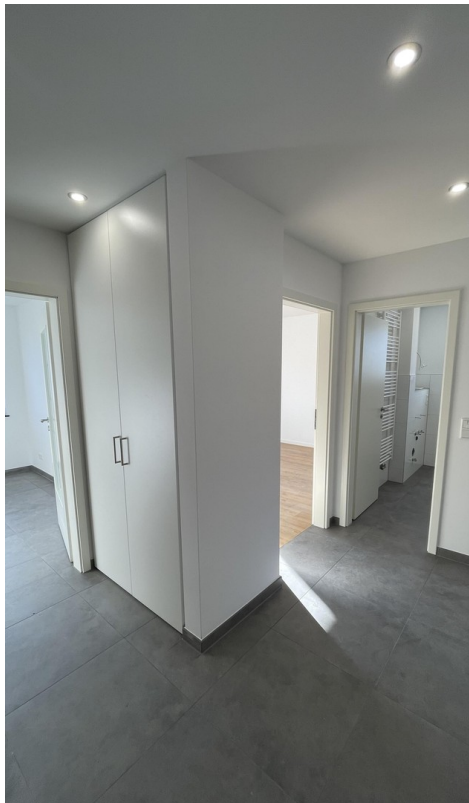
Flur mit Einbauschränk