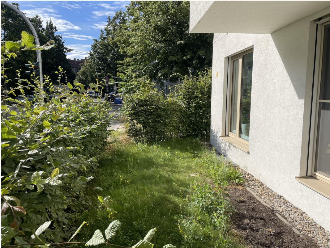
Garten zur Straße