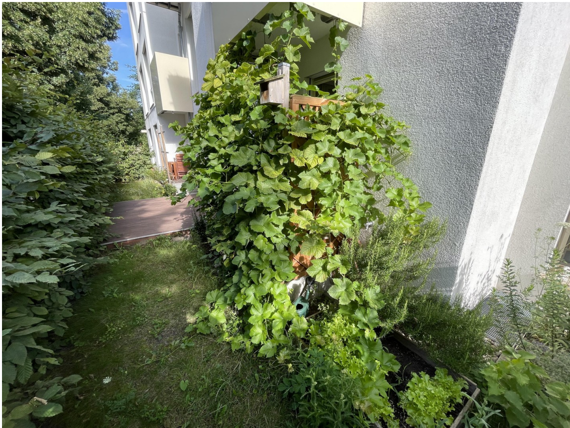
Garten und Terrasse