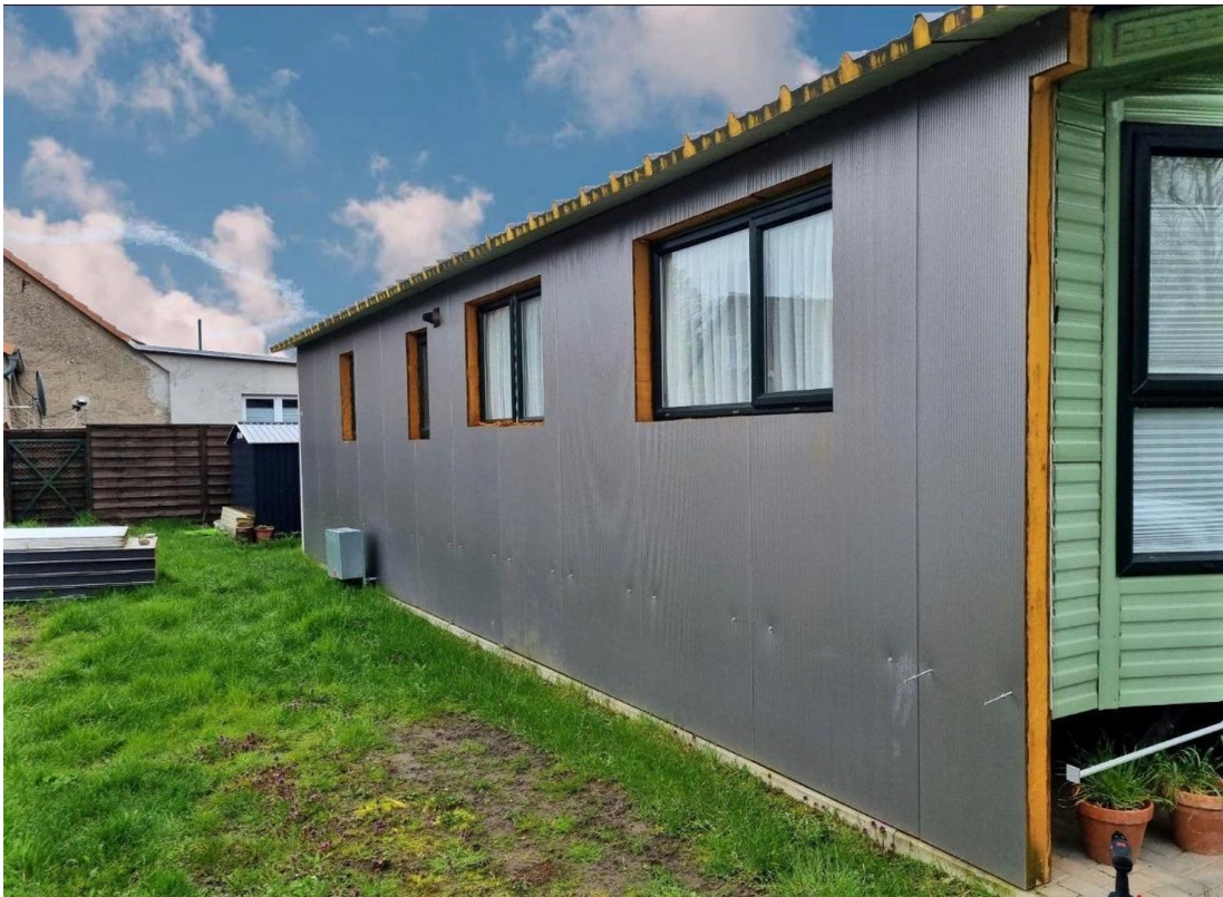
Hier sieht man die Dämmung