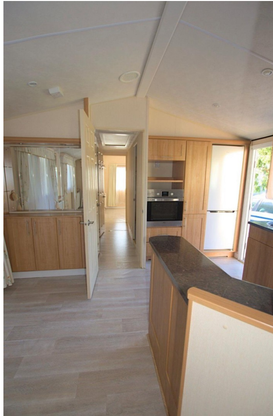
Einbauküche mit Geräten