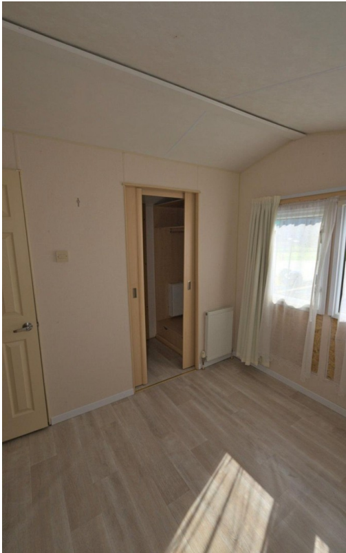
Schlafzimmer mit Kleiderschran