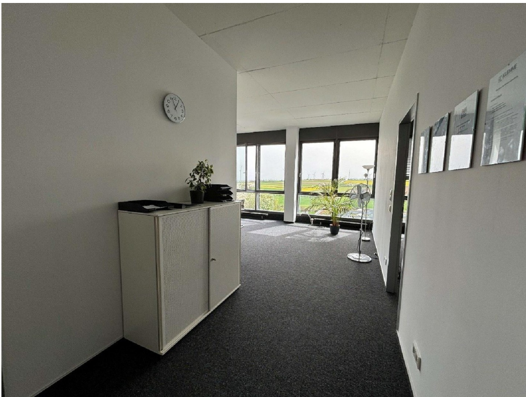
Flur mit Büro