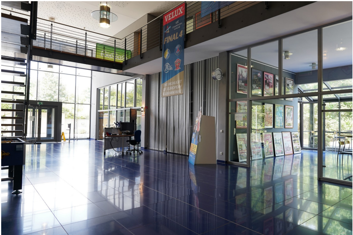
Foyer mit Cafeteria