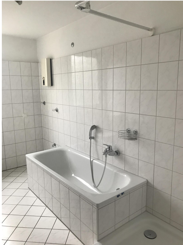
Badezimmer mit Dusche & Wanne