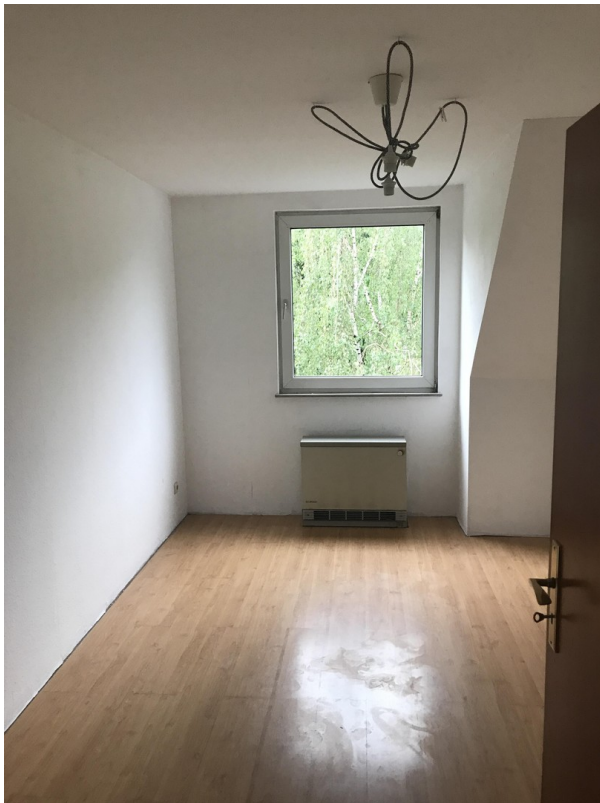
Kinder- / Arbeitszimmer