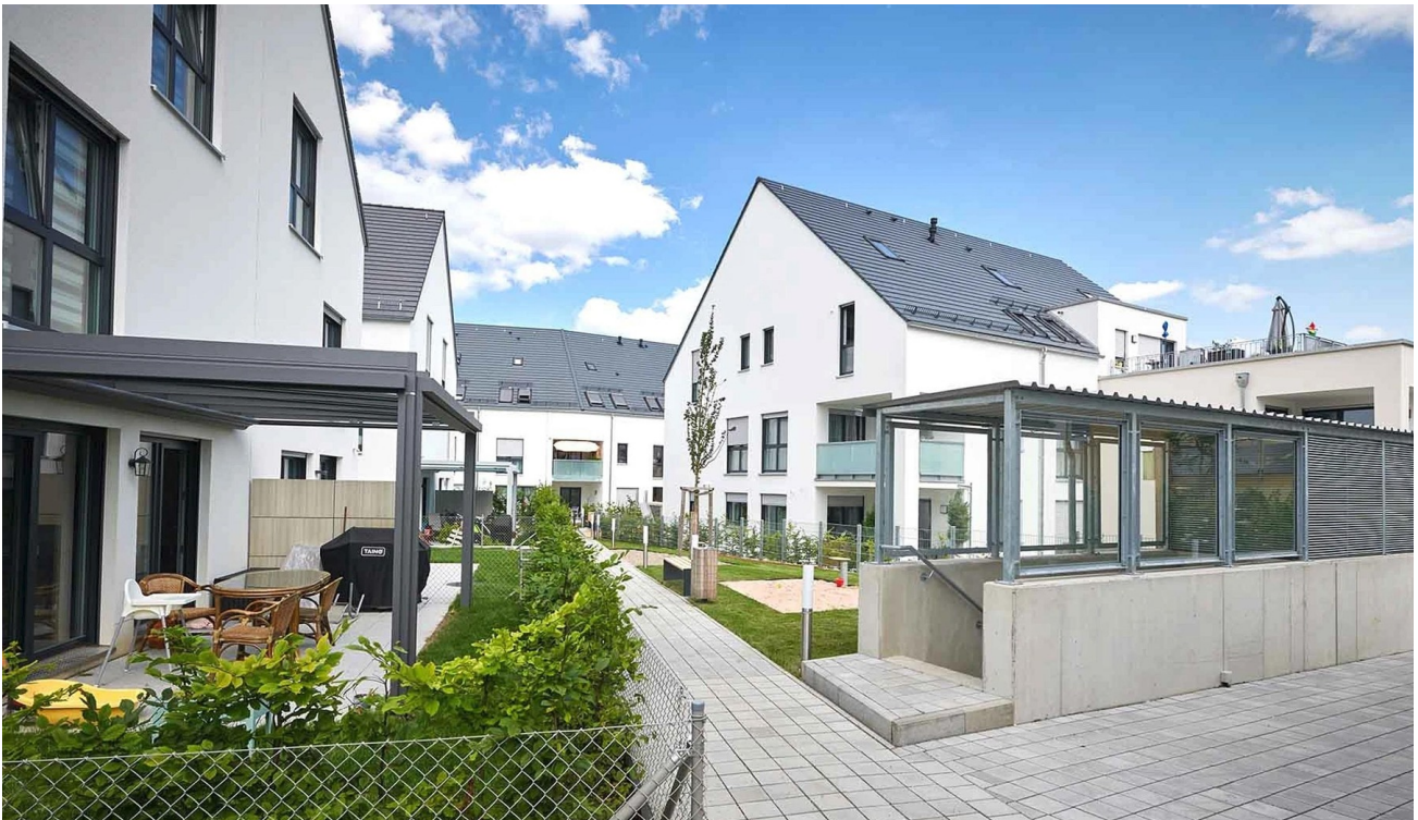
Wohnanlage Frauenaauracher Höfe