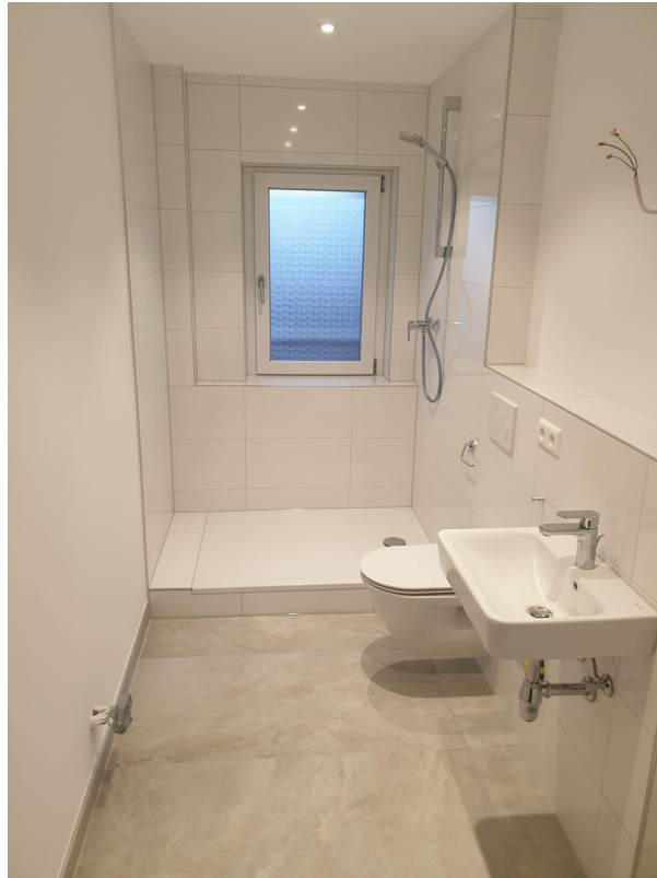
Bad (baugleich nach Sanierung)