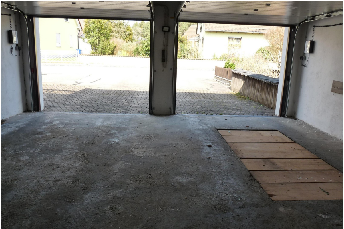
Garage mit Grube