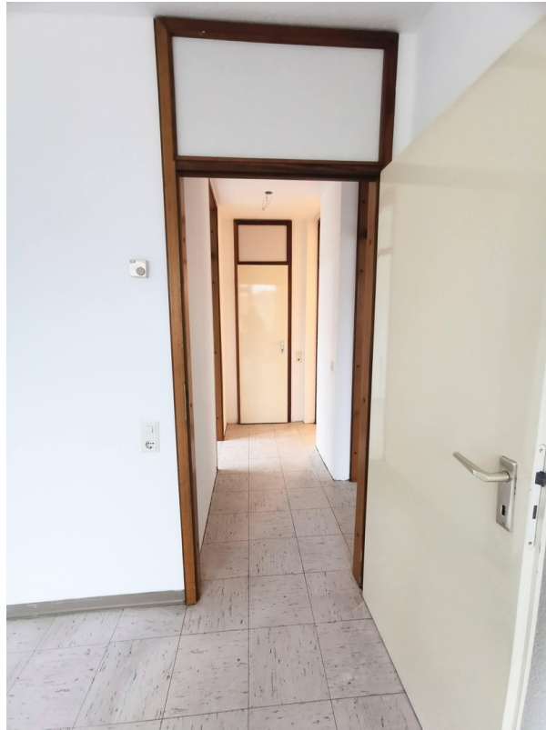
Flur im Schlafbereich