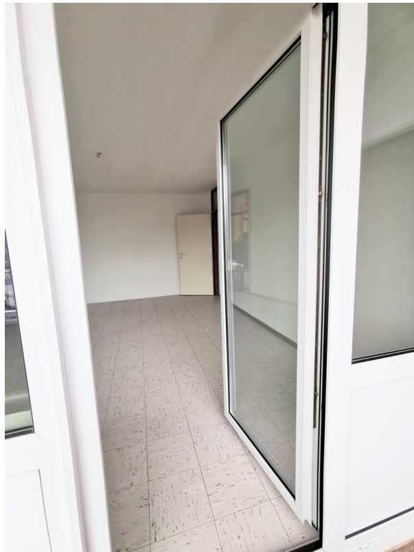
Blick vom Balkon