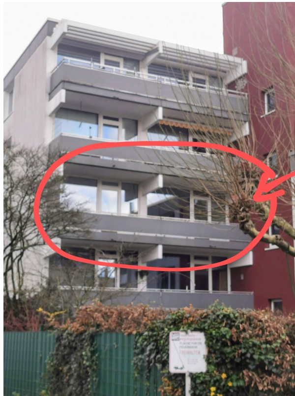
Wohnung Blick in den Garten