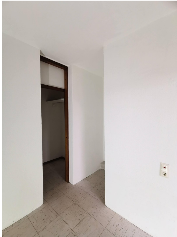
Garderobe und Abstellraum