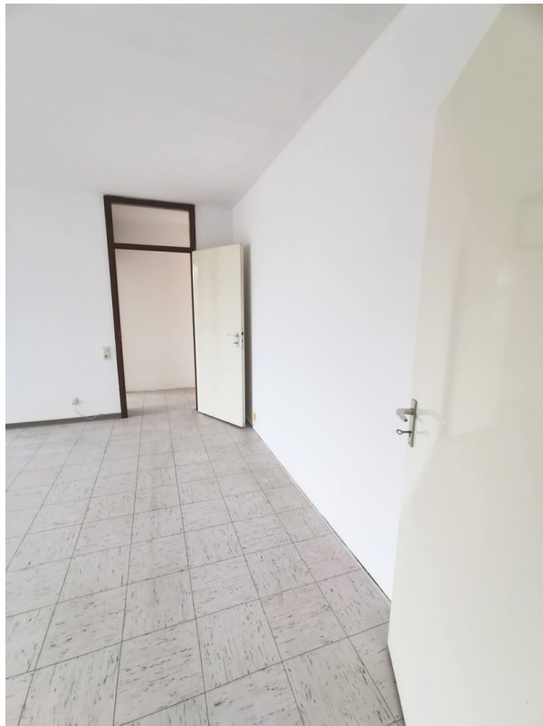
Zugang zum Wohnzimmer