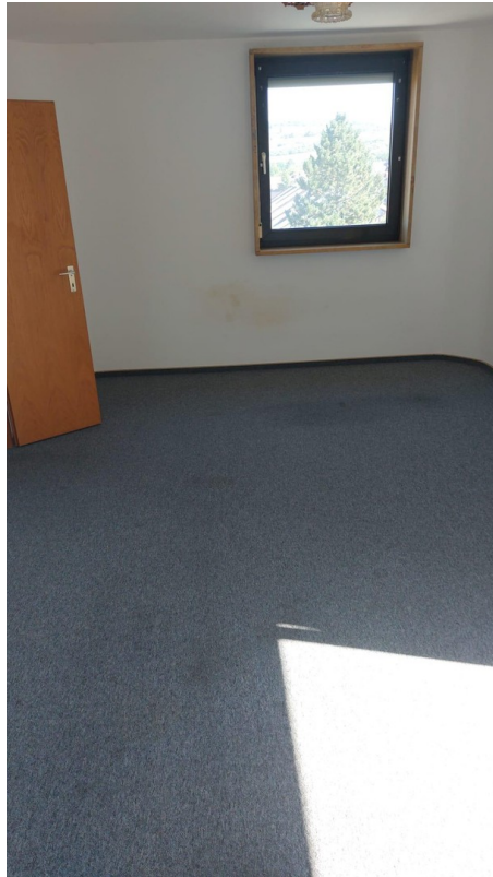
Wohnzimmer Bild 3