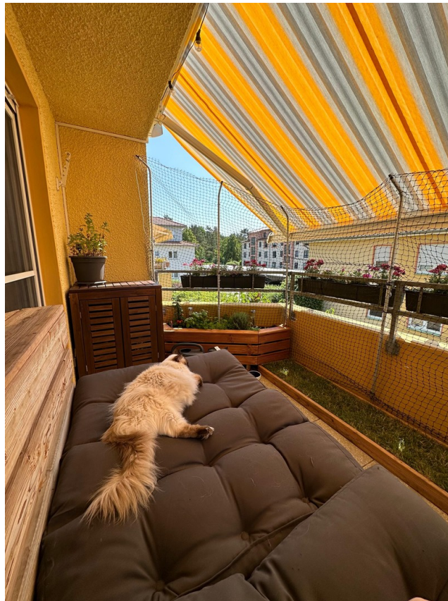
Balkon - Ausrichtung Süd