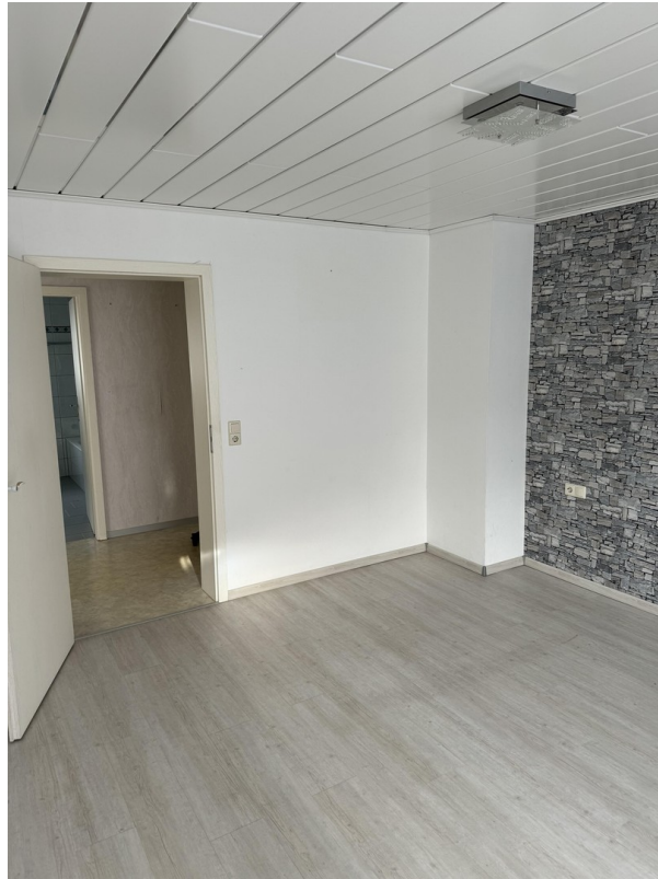
Schlafzimmer Eingang links