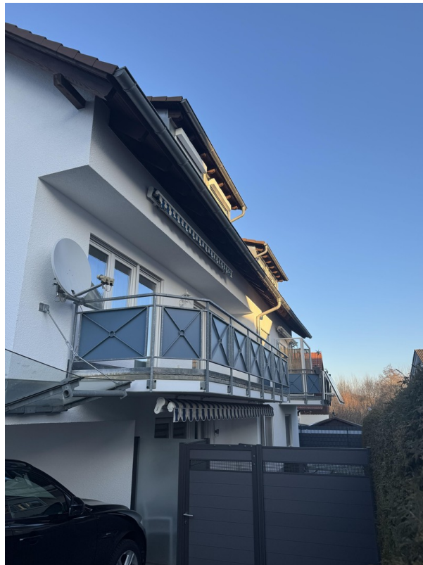
Balkon mit Markise