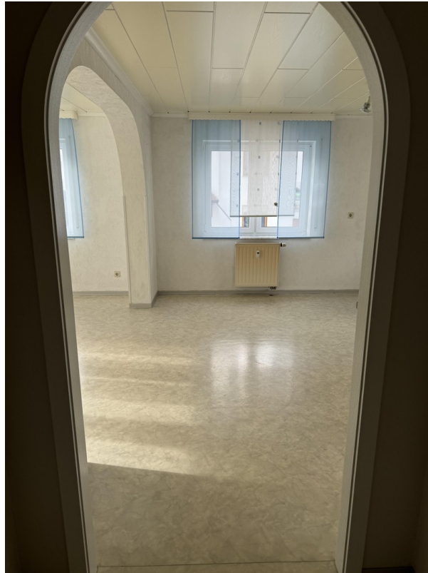
Eingang ins Wohnzimmer