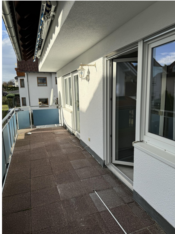
2 Ausgänge auf Balkon