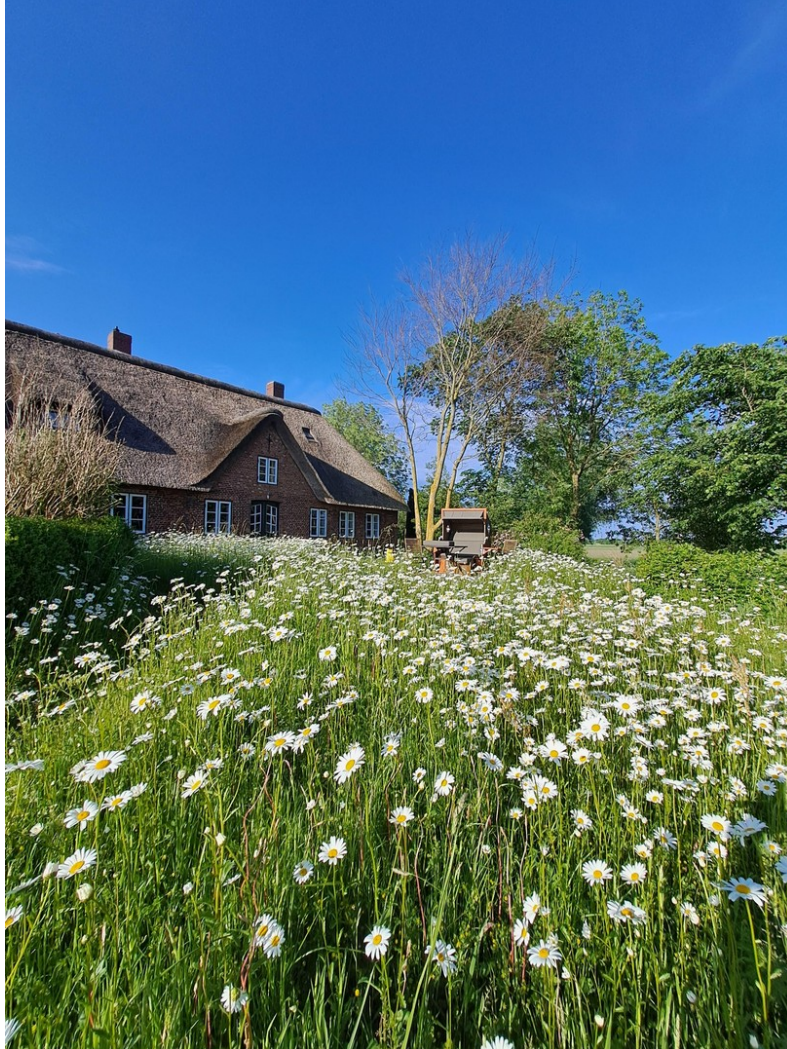
Südansicht, Mai 2024