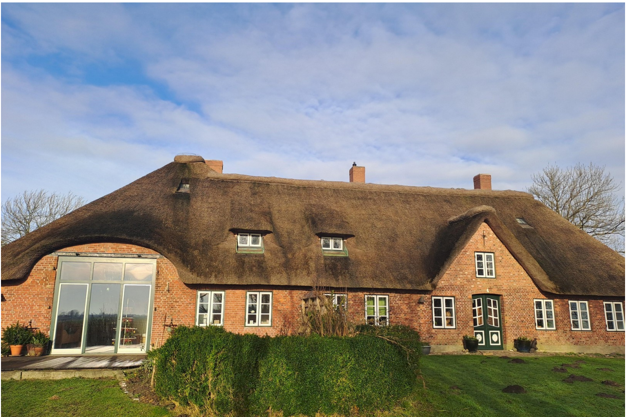
Südansicht, Januar 2025