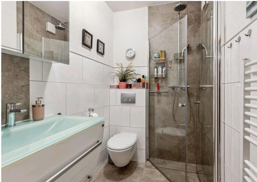
Duschbad mit begehbare Dusche