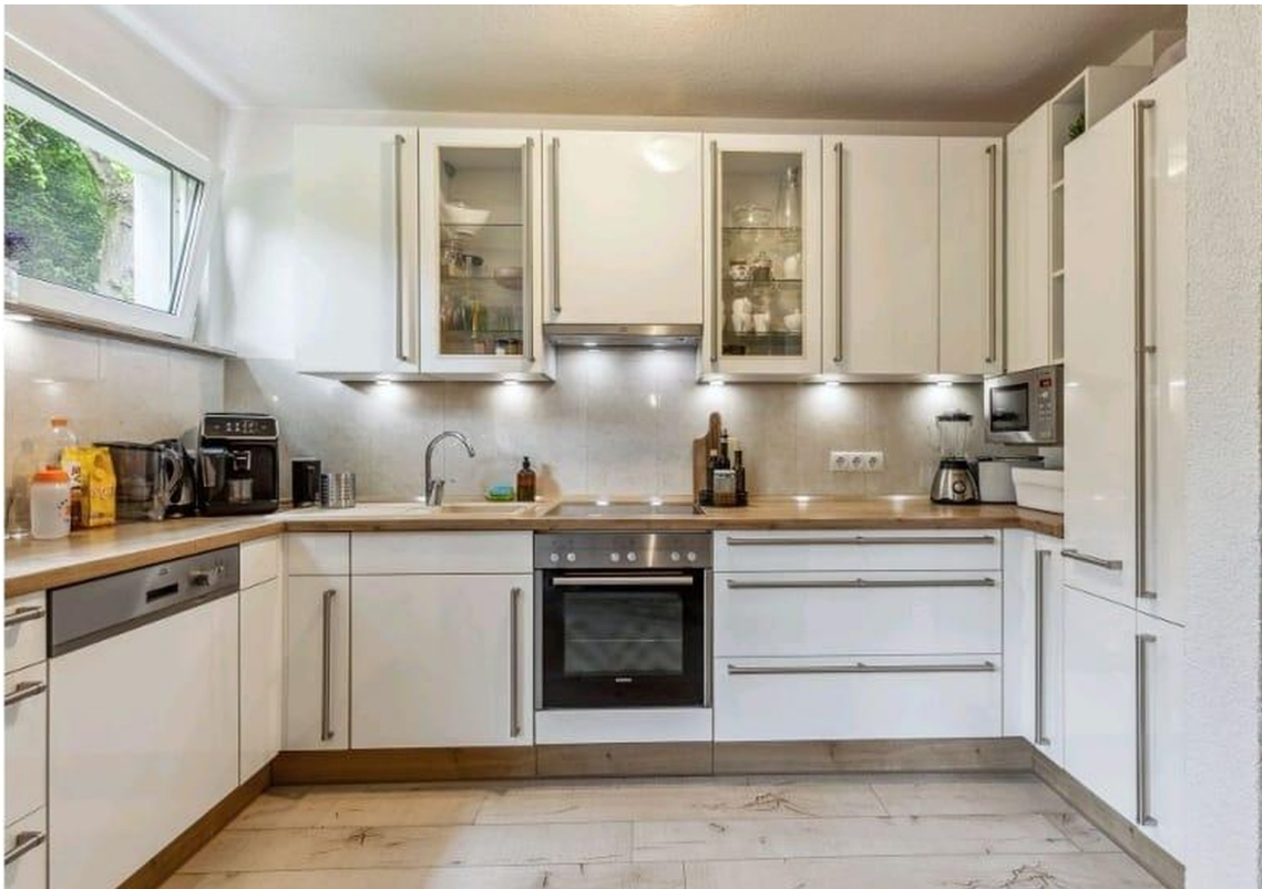
Gemeinsame eingerichtete Küche