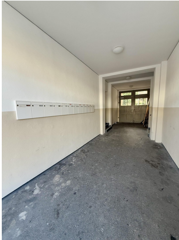
Ansicht zum Innenhof