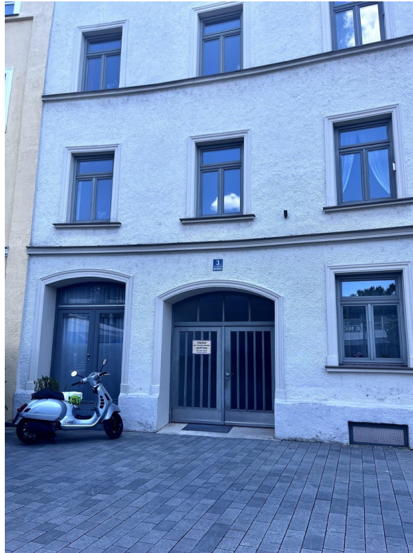
Gebäude aussen zum Platz