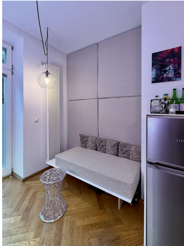
Küche Lounge 02