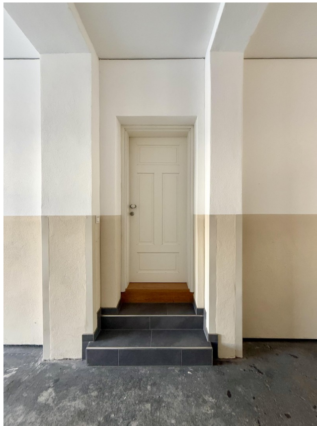
separater Eingang zum Objekt