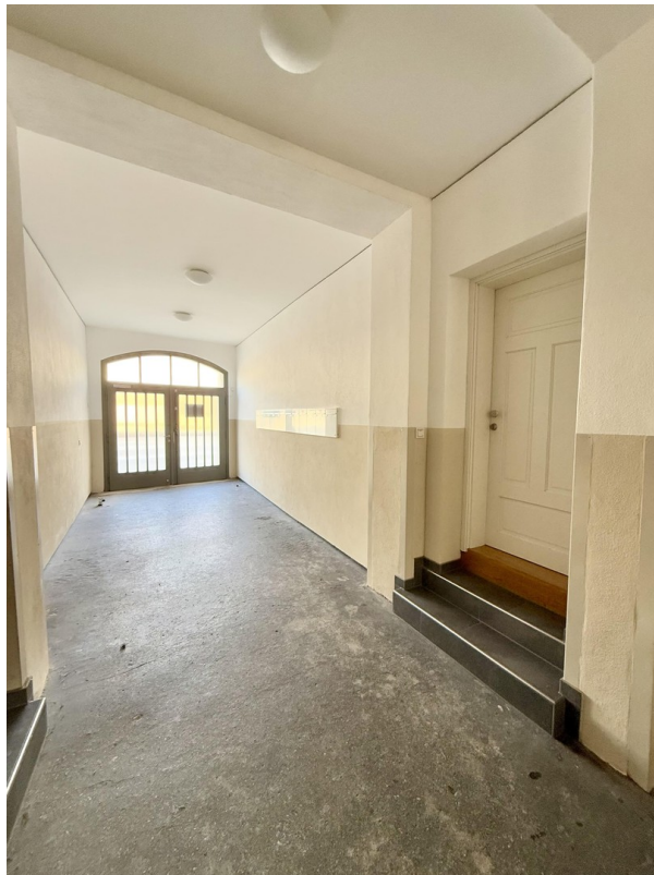
Ansicht zum Eingang