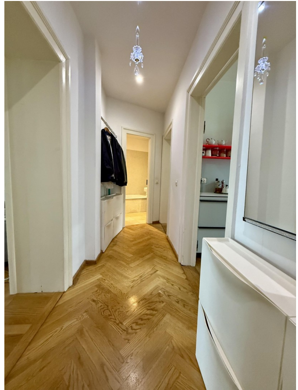
Gang zum Bad