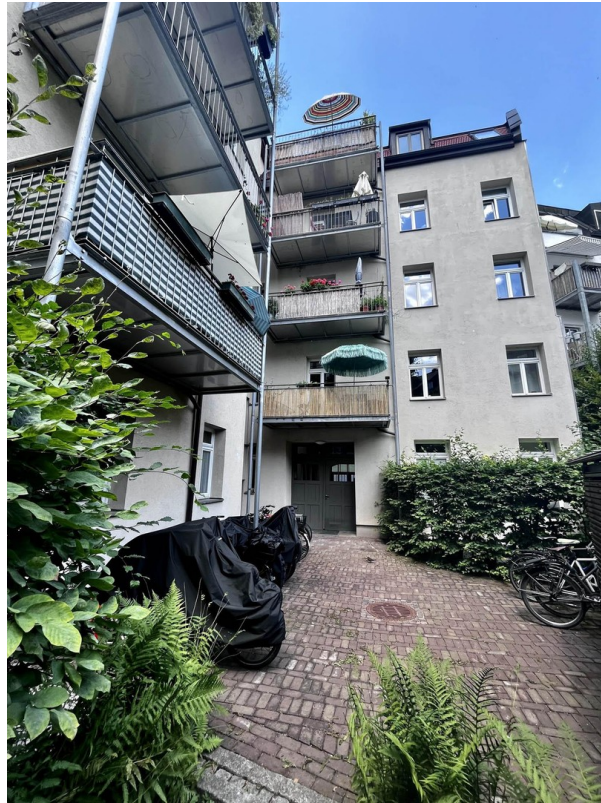
Innehof Blick zum Haus Süden