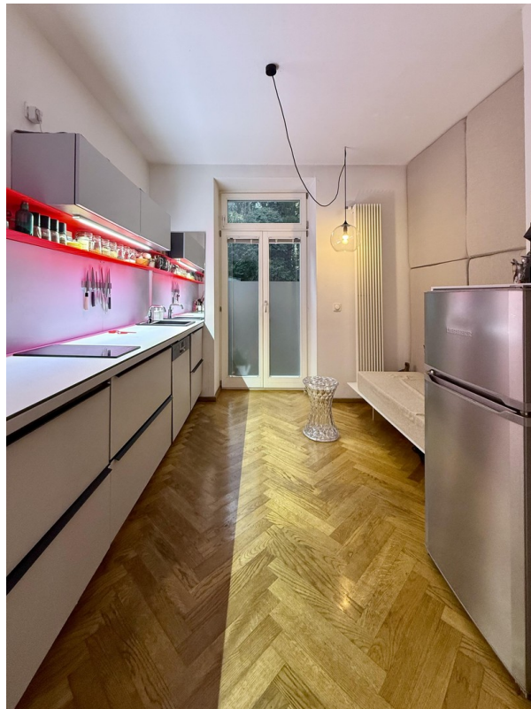
Küche zur Teerrasse