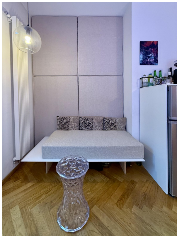
Küche Lounge 01