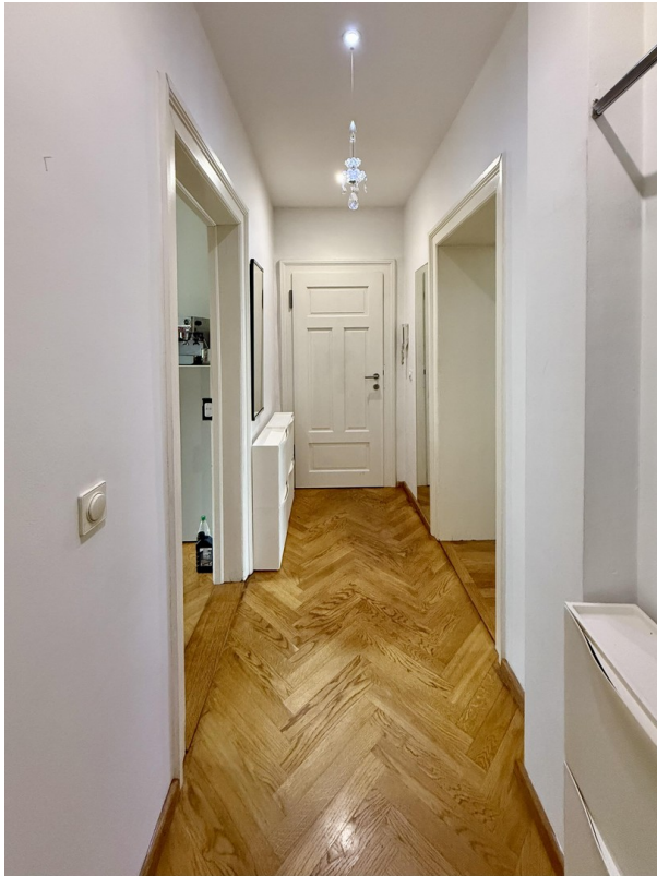
Gang zur Wohnungstür