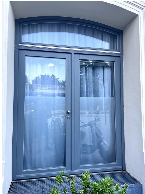
Zugang vom Platz