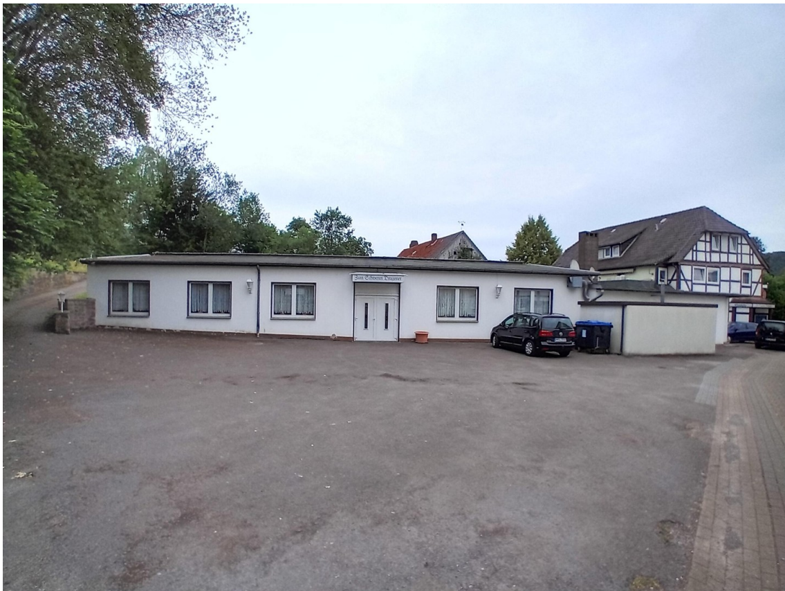
Anbau / Saal