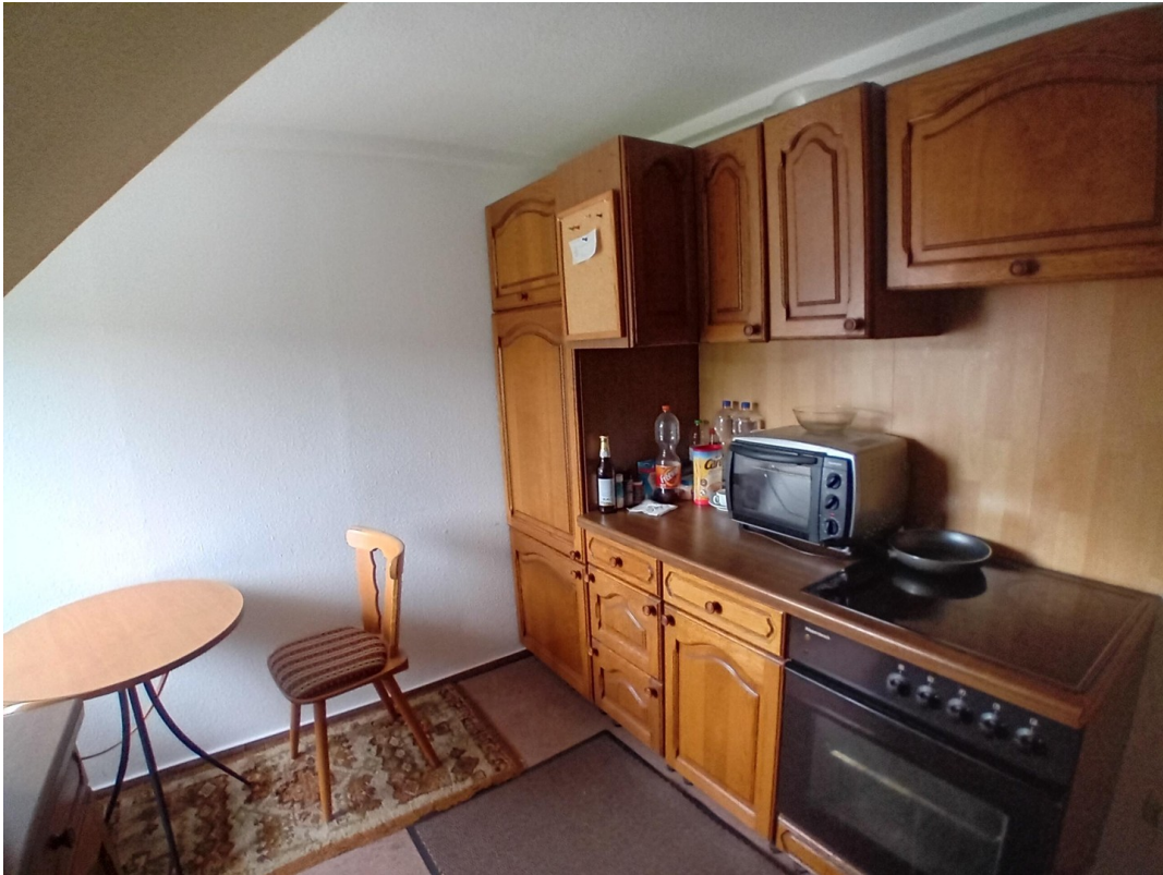
Küche für die Fremdenzimmer