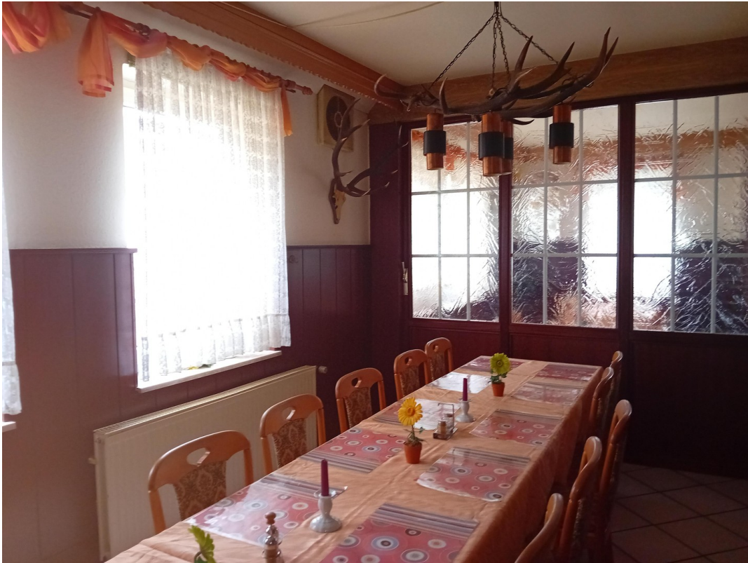
Restaurant / Clubraum