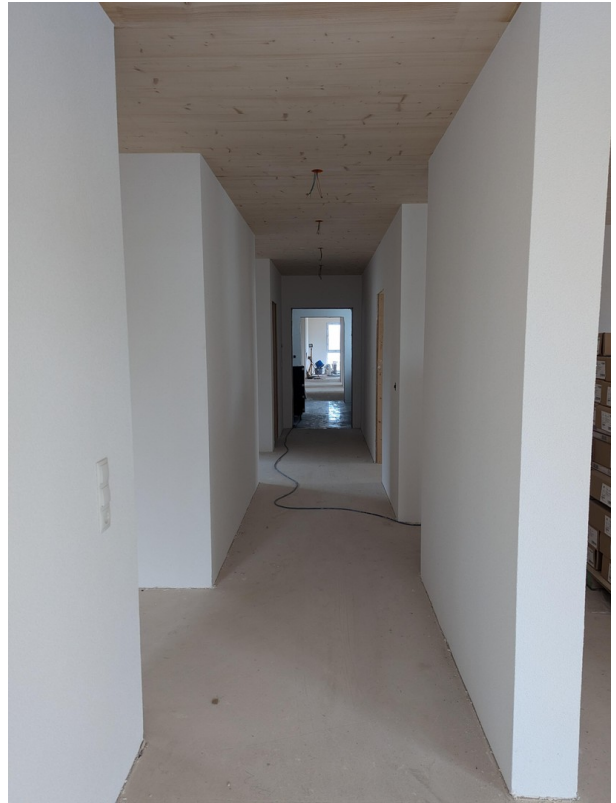
Flur der Wohnung