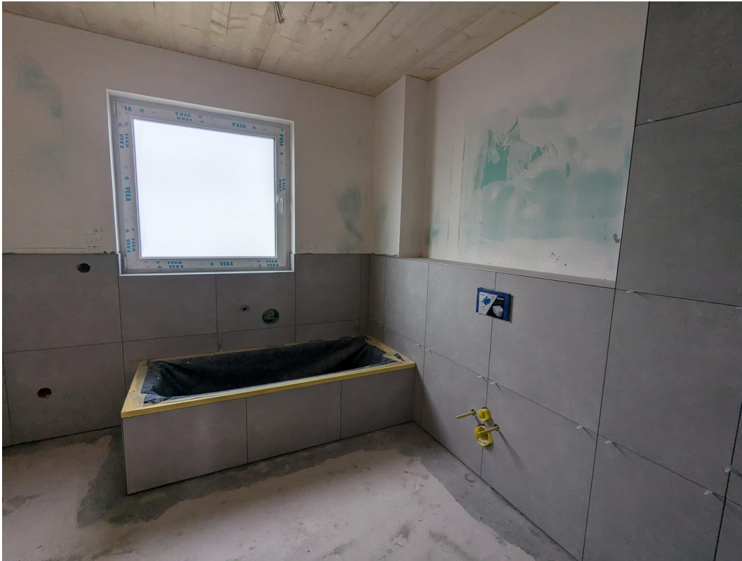
Badewanne im Bad