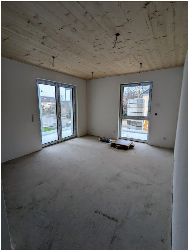
Wohnzimmer mit Terrassenblick