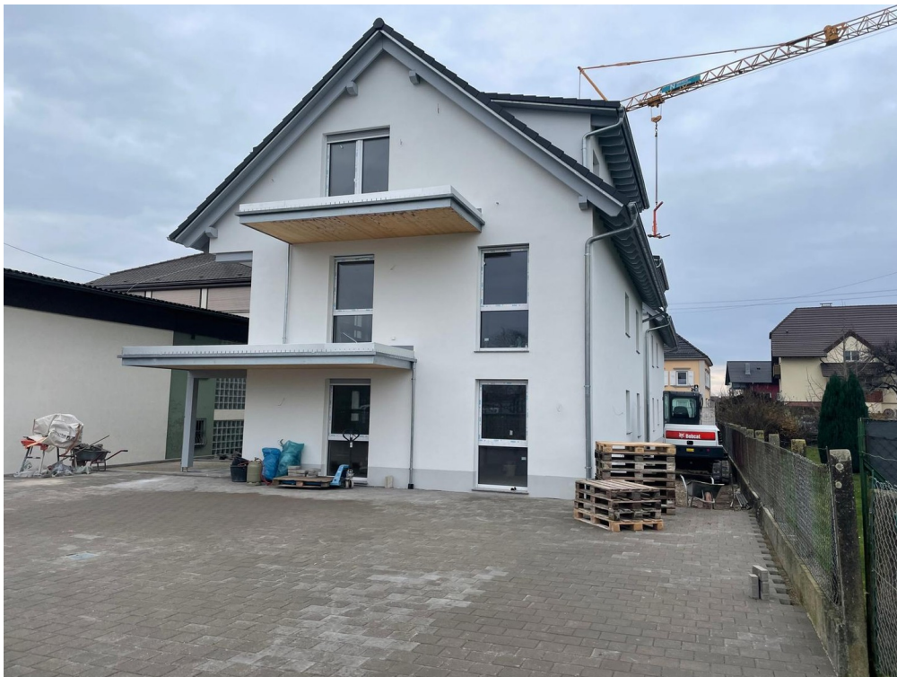
Haus von hinten/ Stellplätze