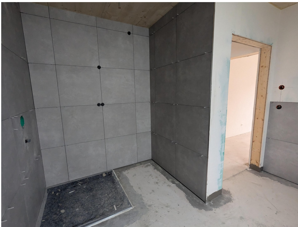
Dusche im Bad