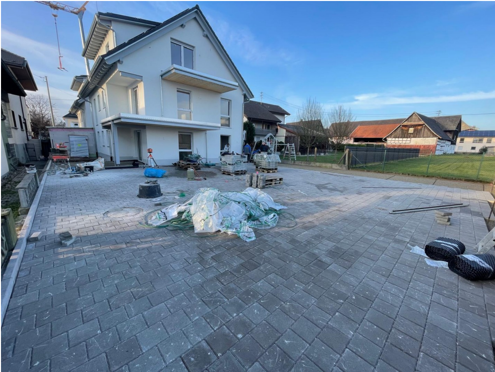
Haus von hinten/ Stellplätze