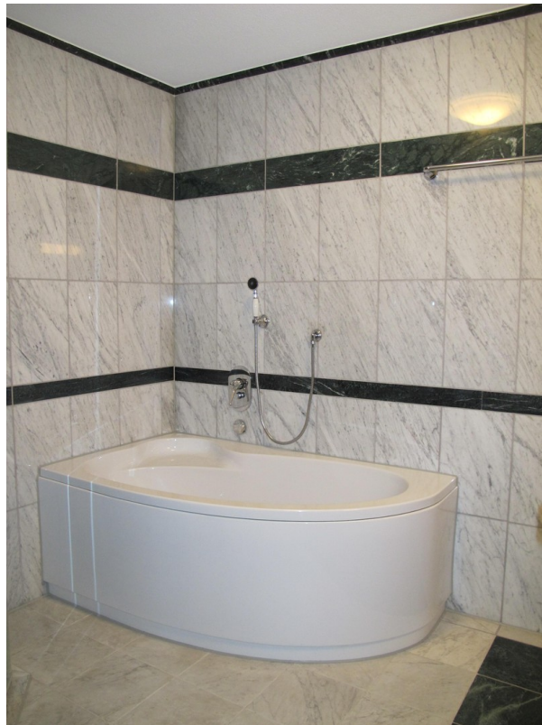
Bad mit Eckbadewanne