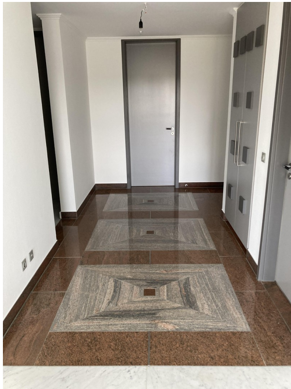
Eingangsdiele mit Granitboden