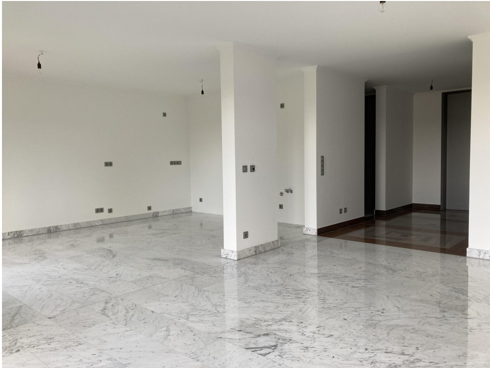
Blick auf Küche und Diele