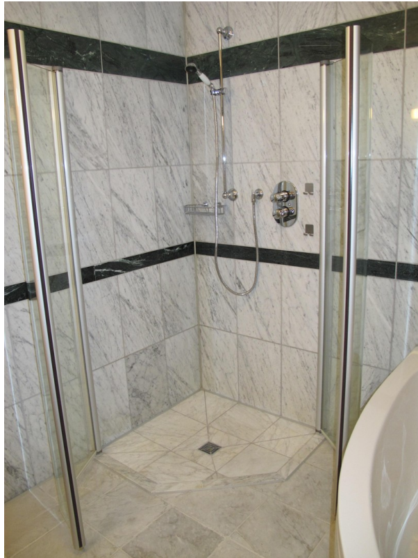
Dusche im Hauptbad