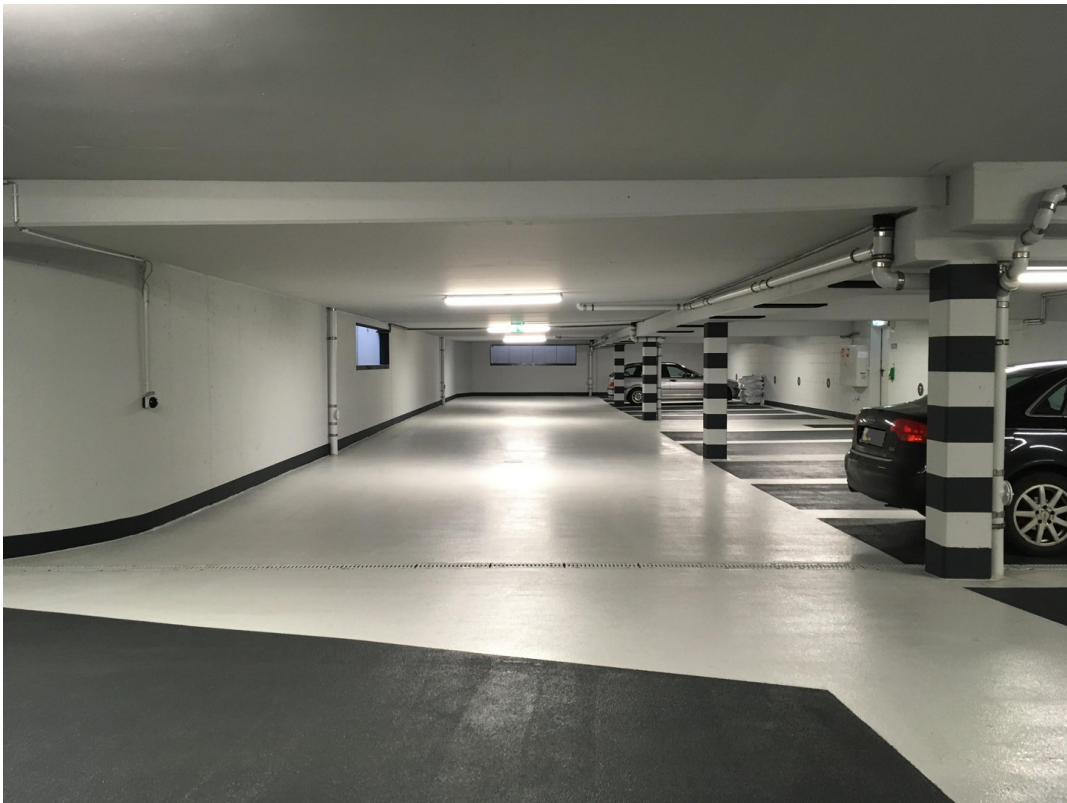
Tiefgarage mit 37 Stellplätzen