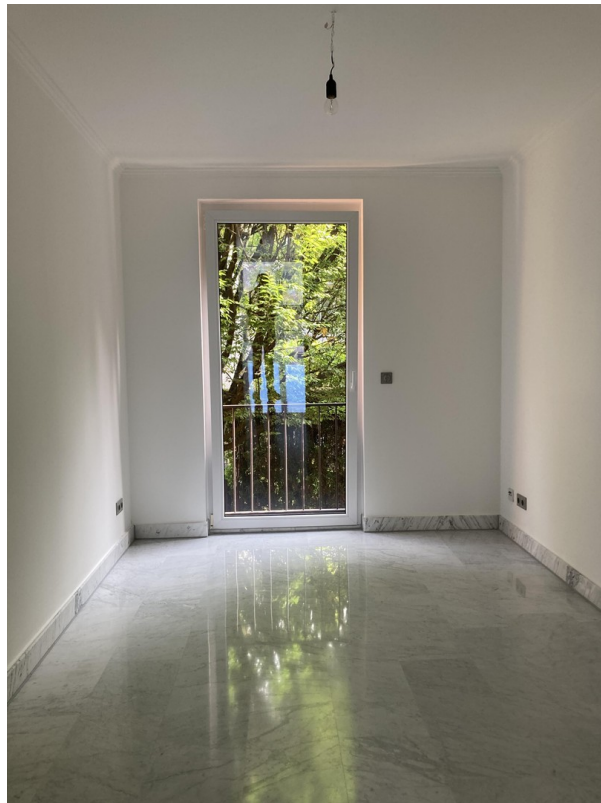
Gästezimmer / Büro