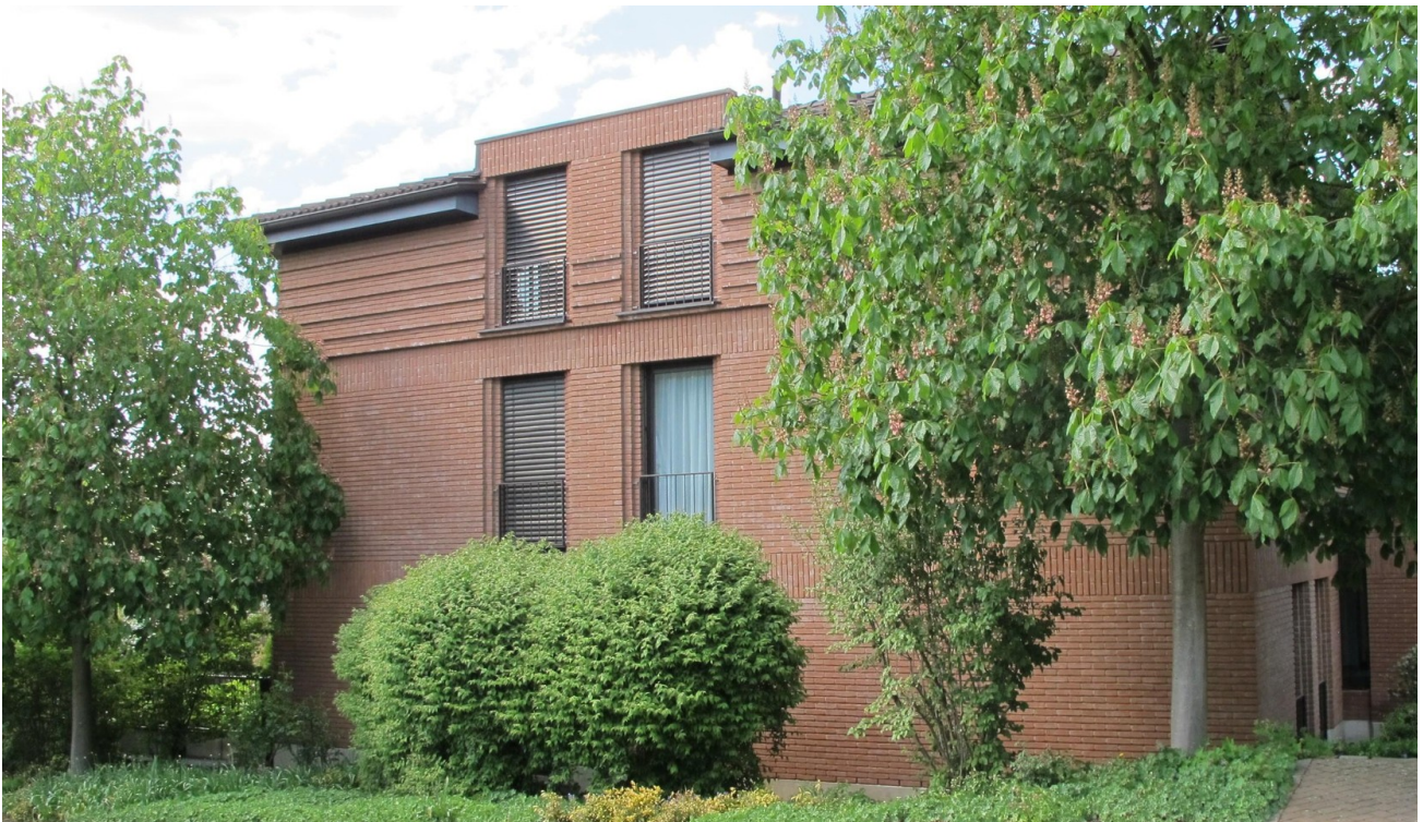
Außenansicht Haus 35/35a