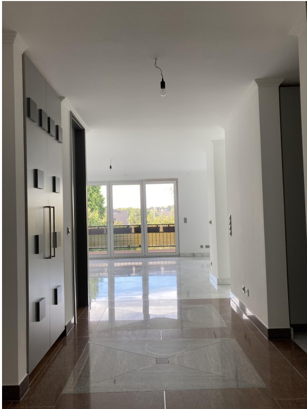
Blick aus Gästezimmer