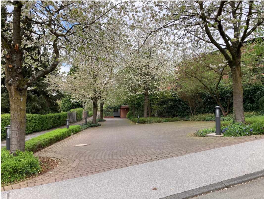
Zufahrt zur Tiefgarage