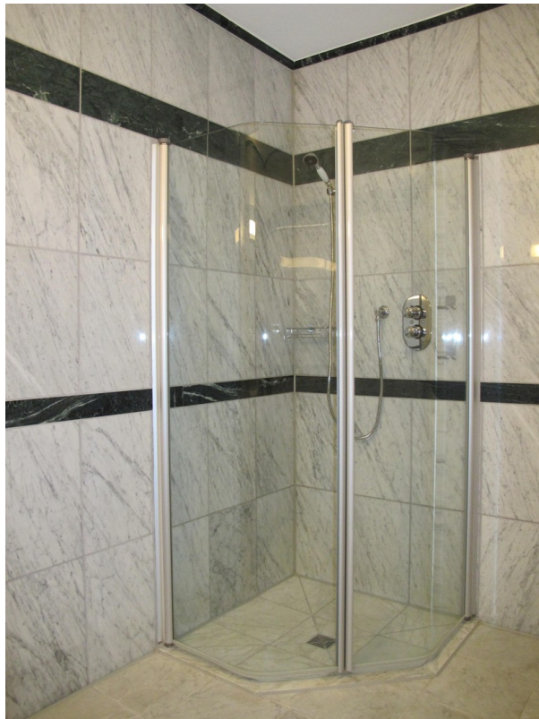
Dusche im Hauptbad