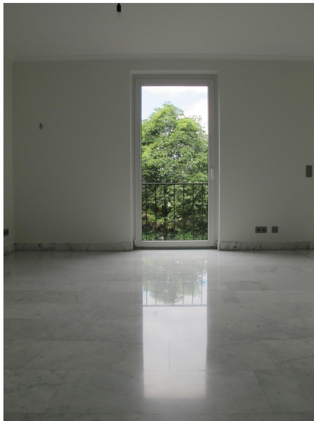
Blick aus der Küche