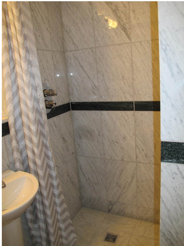
Dusche im Gästebad