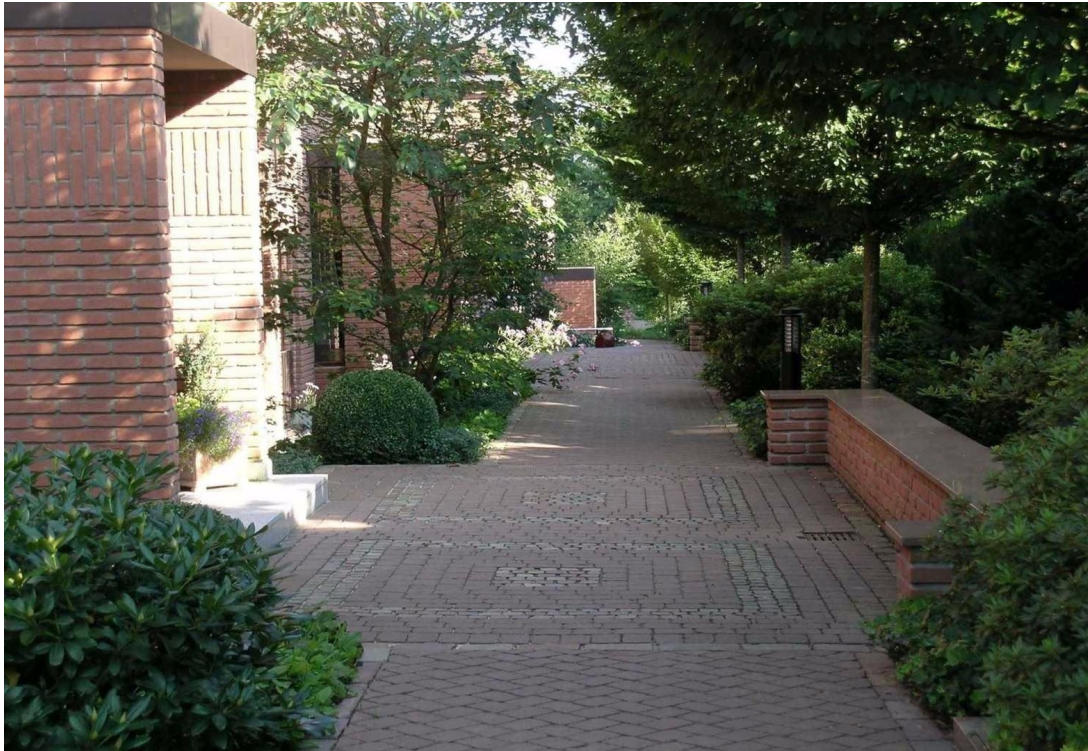
Zugang zu den Häusern