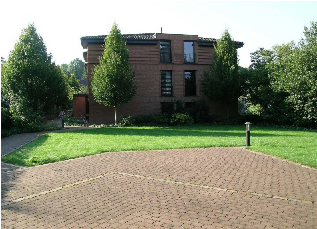
Aussenansicht Haus 37/39