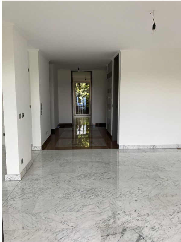
Blick auf Diele & Gästezimmer