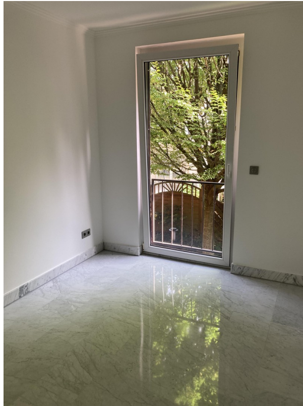
Gästezimmer / Büro