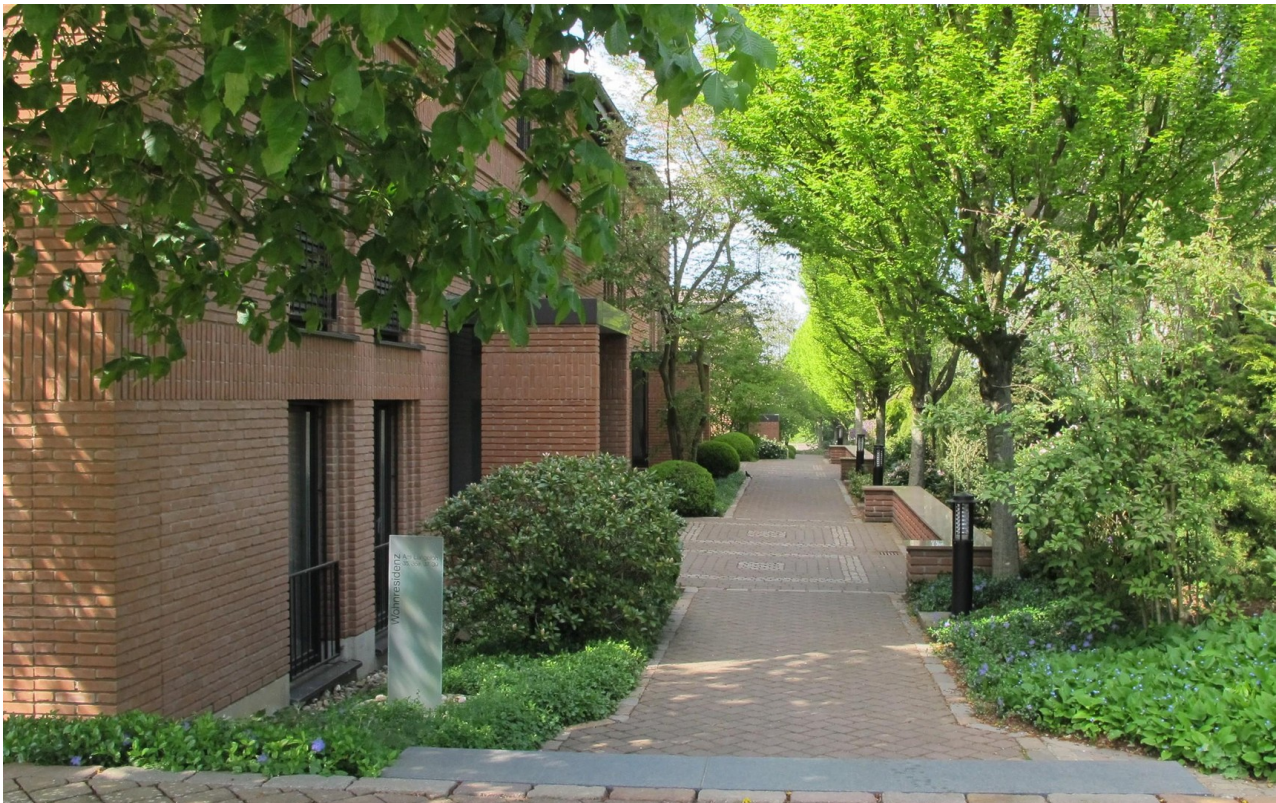
Zugang zu den Häusern