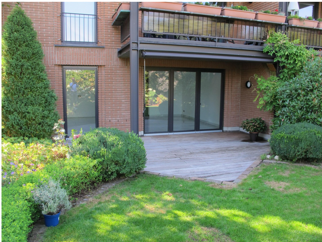
Terrasse und Garten