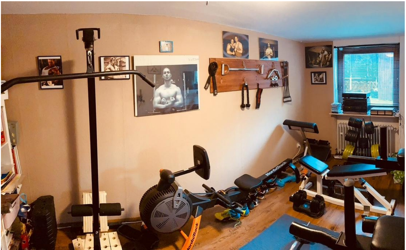
Hobbyraum im UG