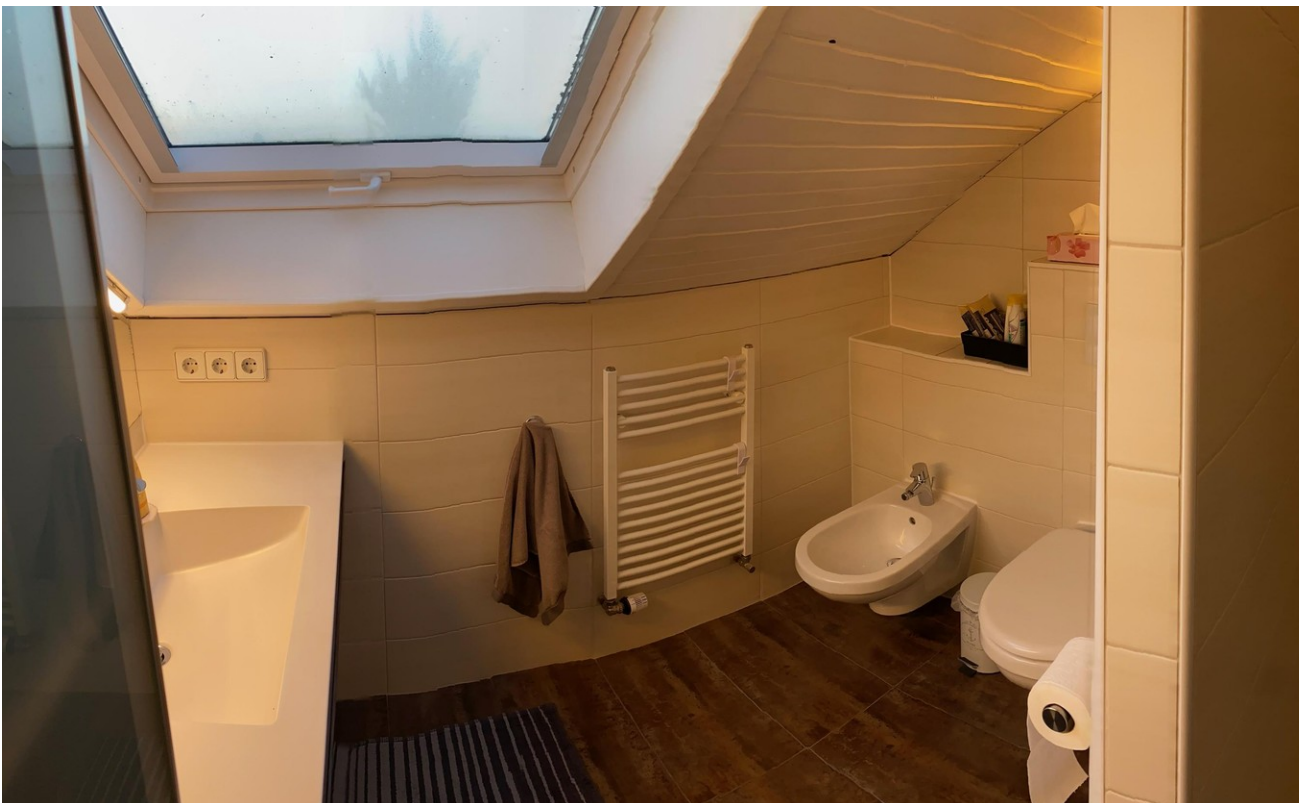
Elternbad im DG