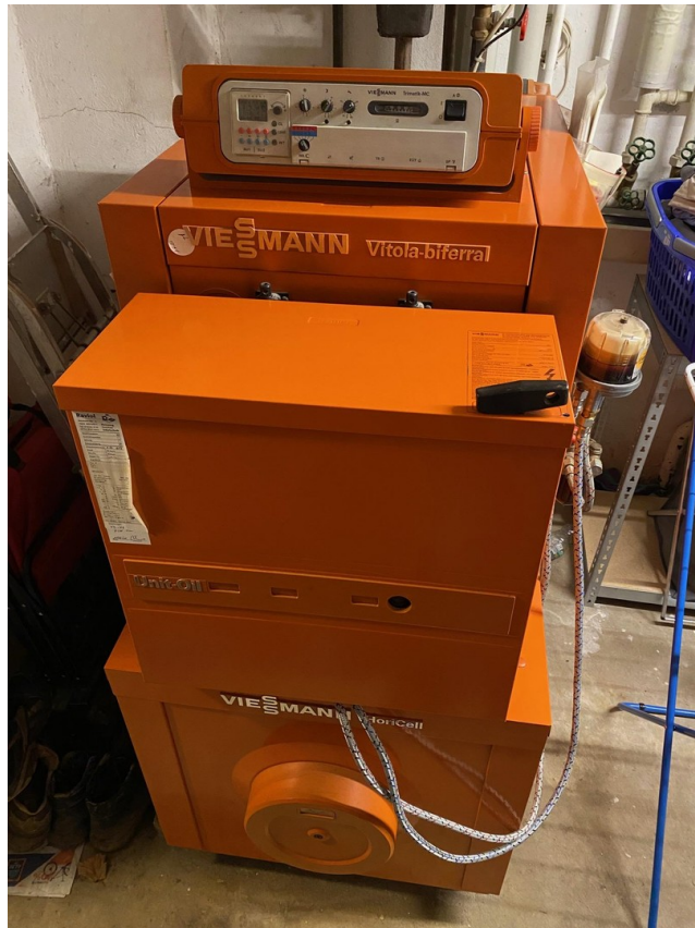
Ölheizung im UG