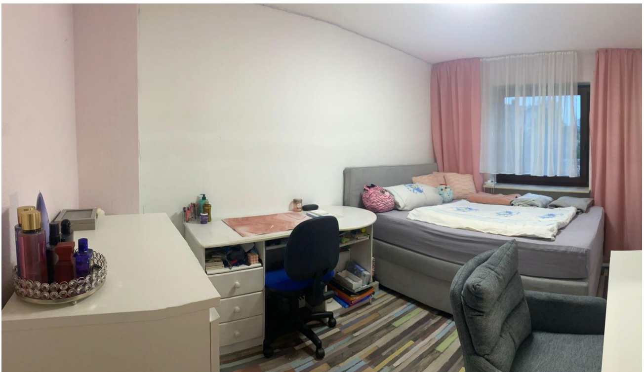
Kinderzimmer im OG