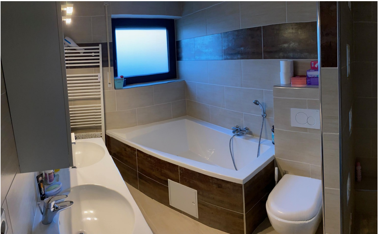
Bad mit Badewanne im OG