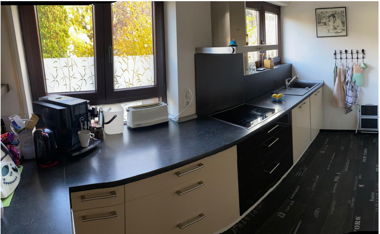
Einbauküche im EG