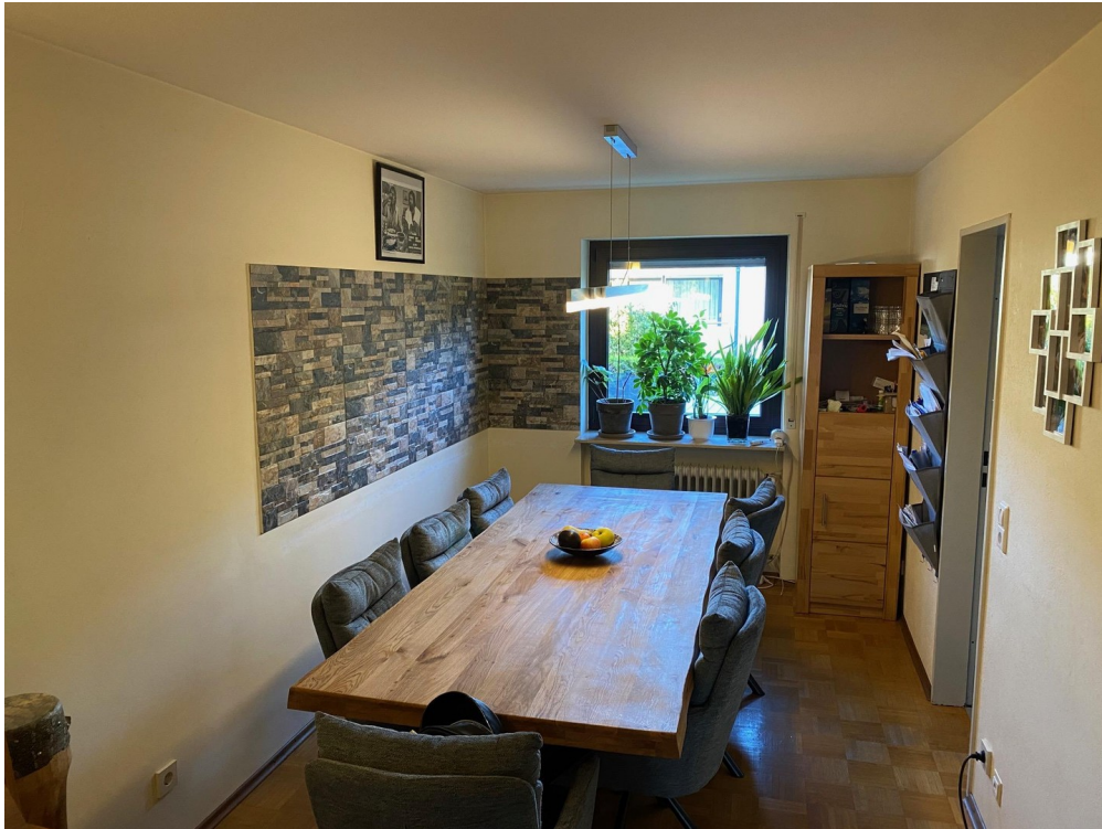
Esszimmer im EG