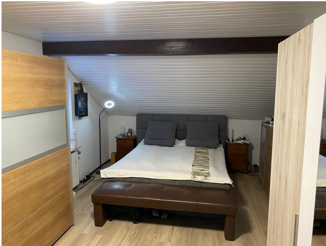
Elternschlafzimmer im DG