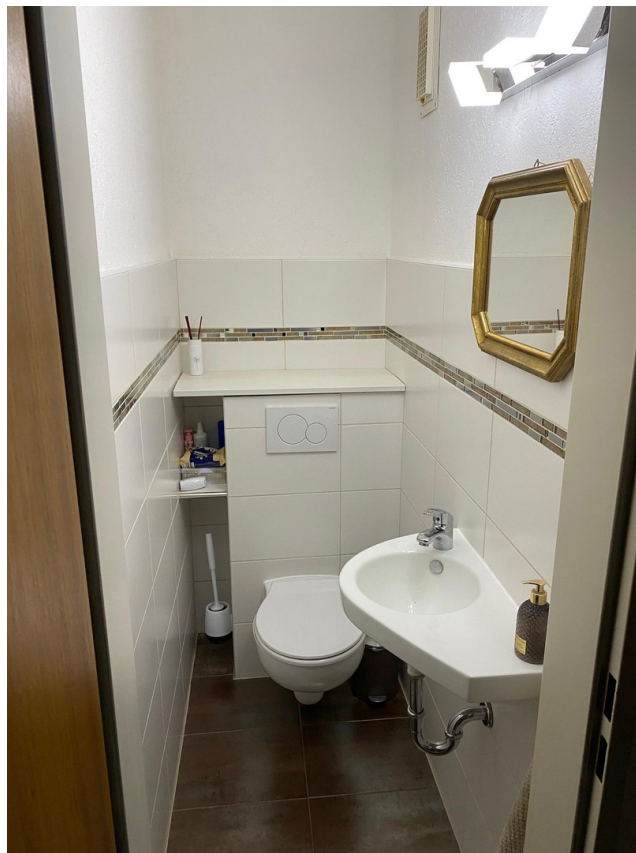
Gäste WC im EG