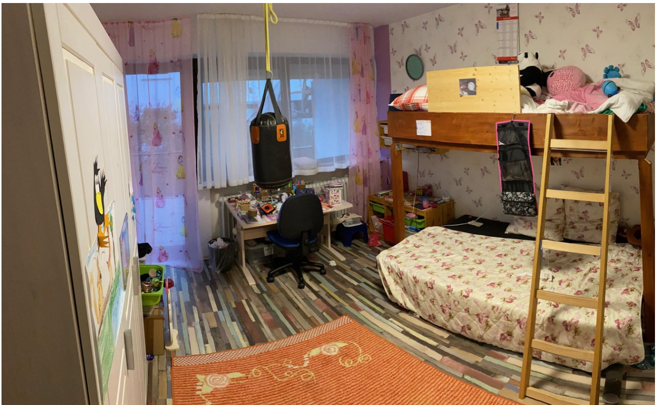
Kinderzimmer mit Balkon im OG