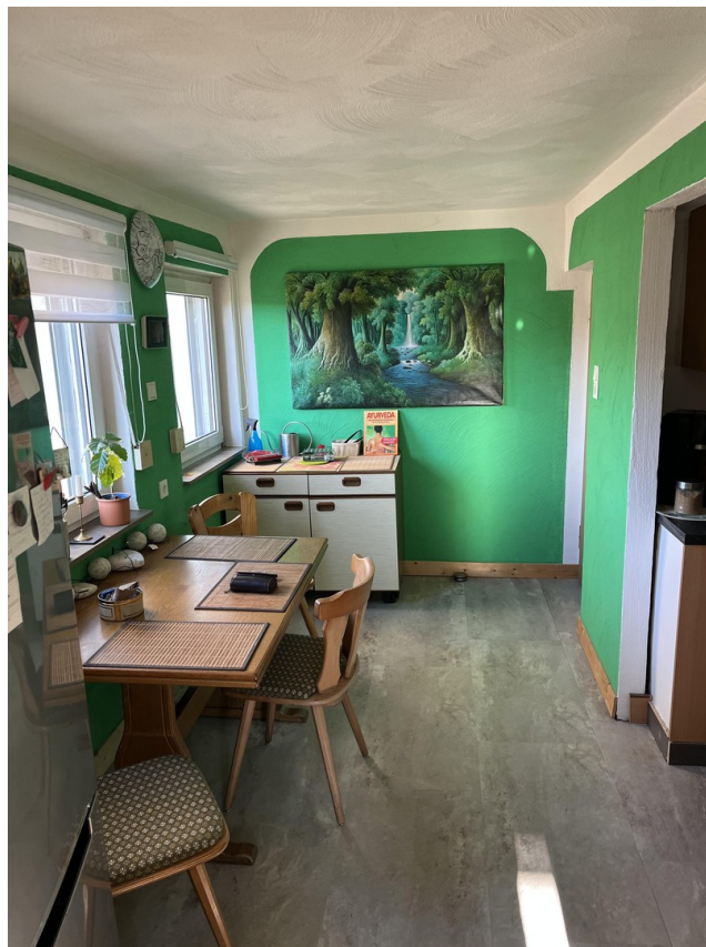
Esszimmer in Küche integriert