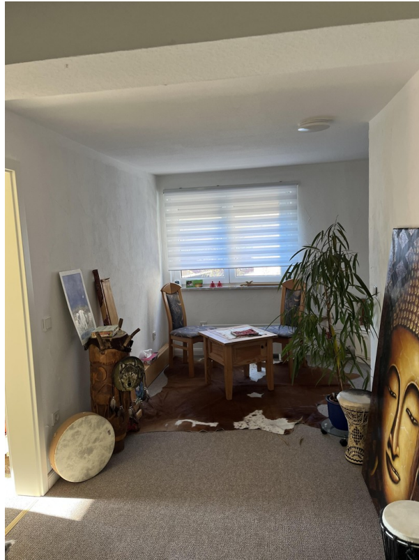
Vorraum für Kinderzimmer