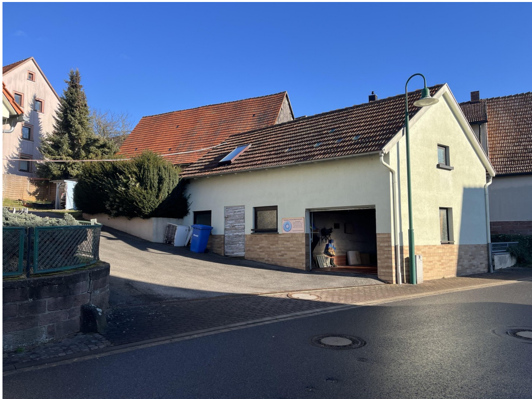
Nebengebäude & Garage