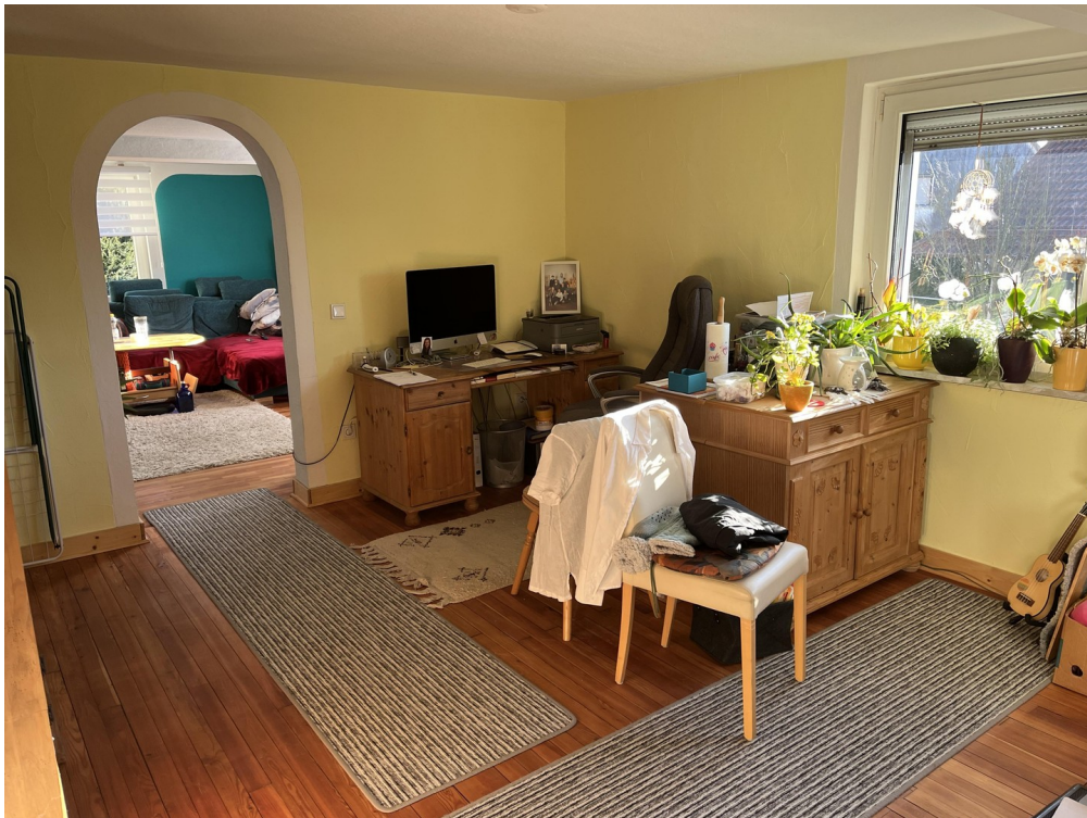
Büro oder Esszimmer