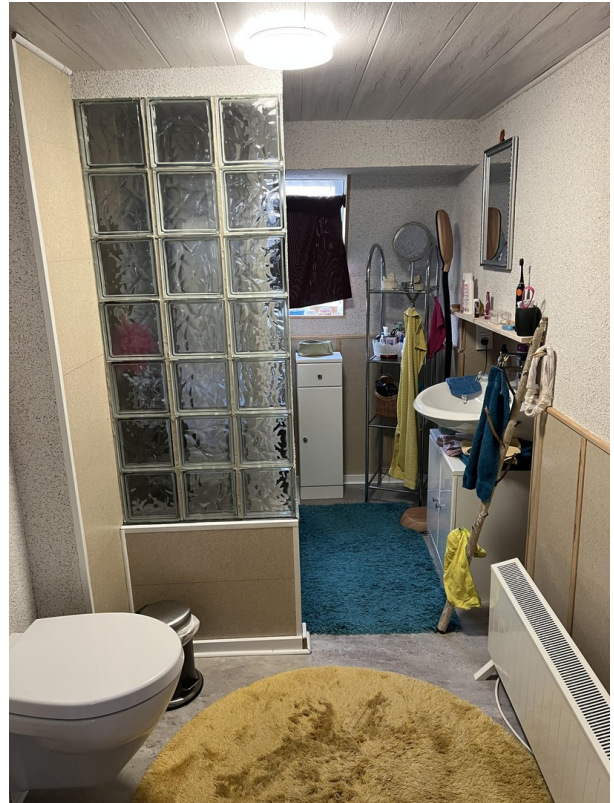
Eltern WC mit Dusche