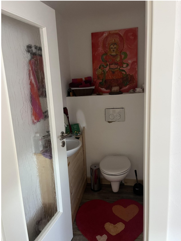
Kinder WC im Vorraum