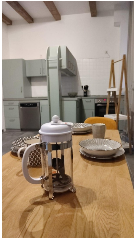
Koch- und Essbereich