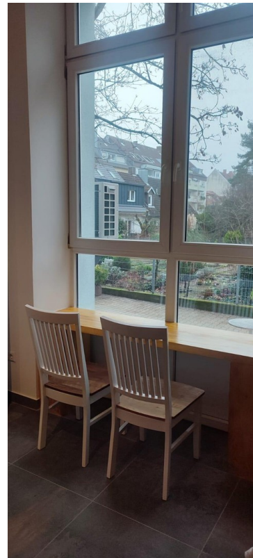
arbeiten und Gärten genießen