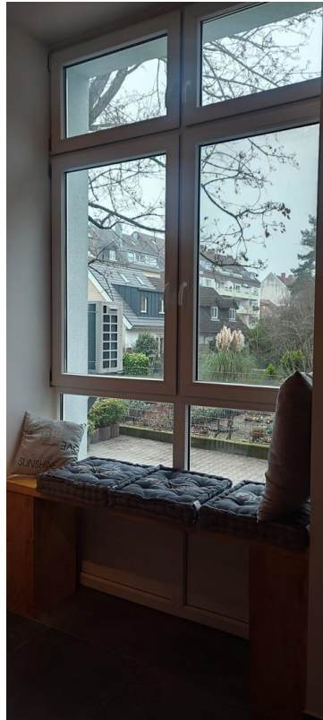
auf der Bank chillen