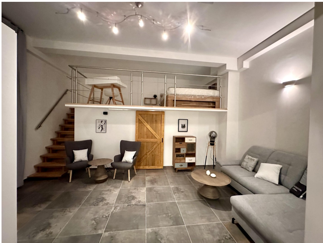
Blick auf den HW-Kubus