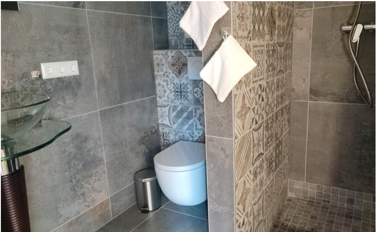
Toilette und Dusche