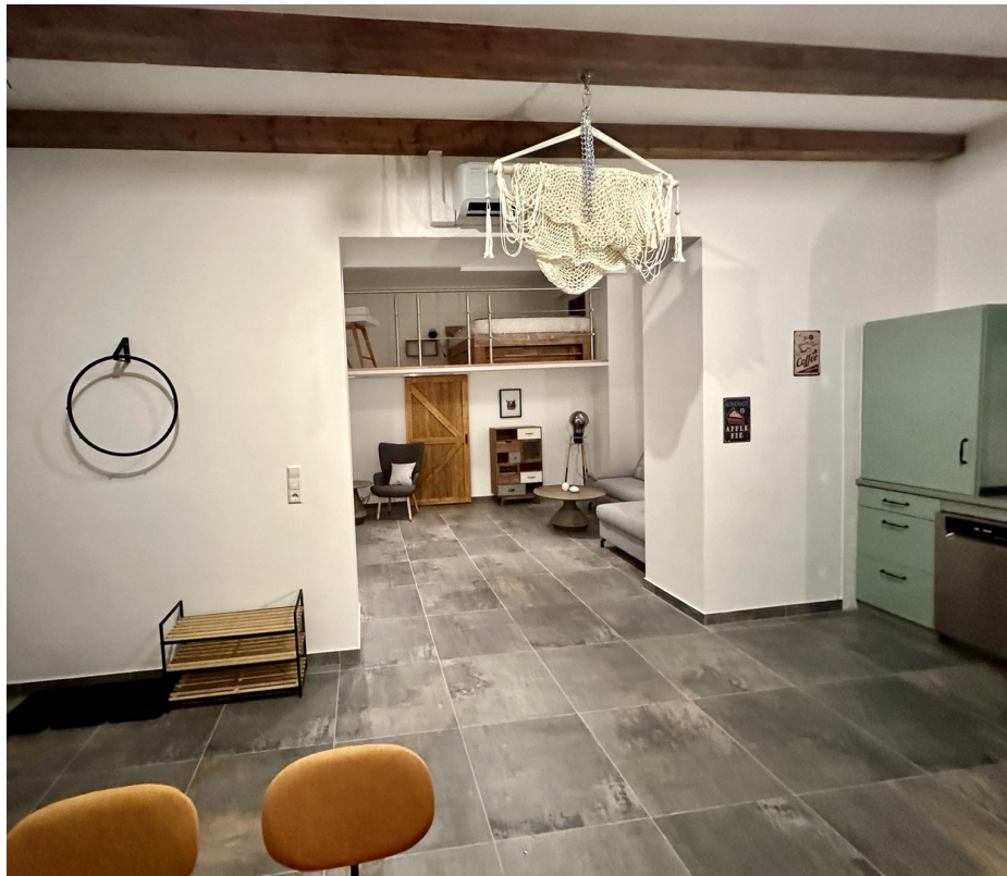
Blick v. Eingang zum W-Bereich