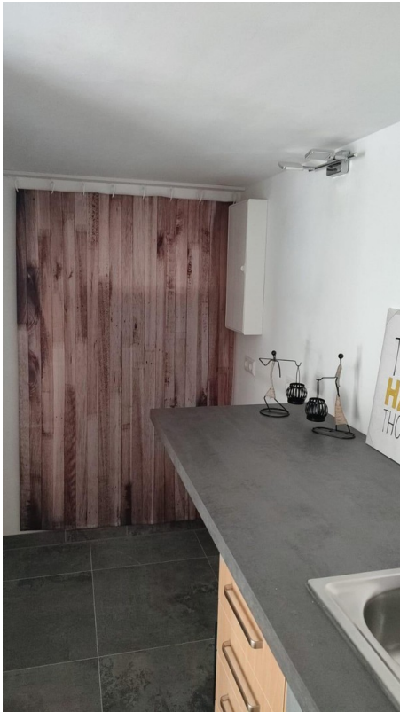
Hauswirtschaft und Abstellen