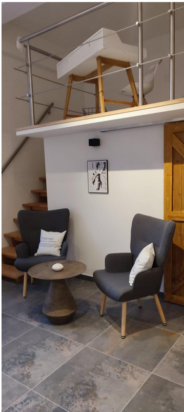
Time for tea