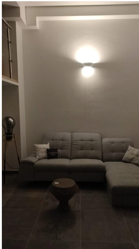
Platz für Bilder