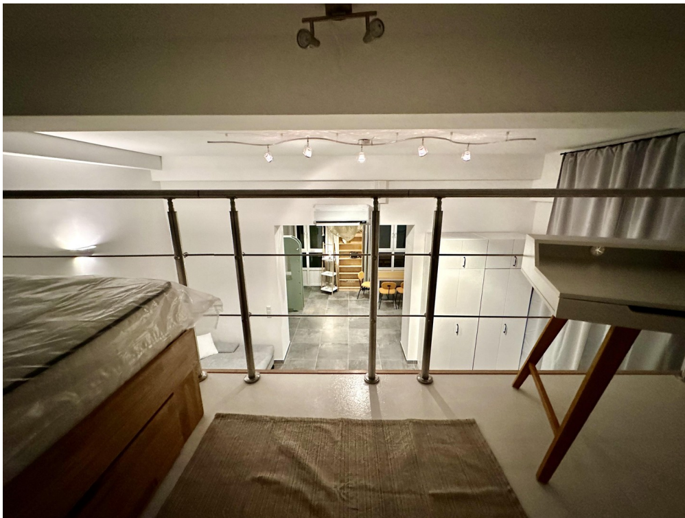
Blick von der Hochebene