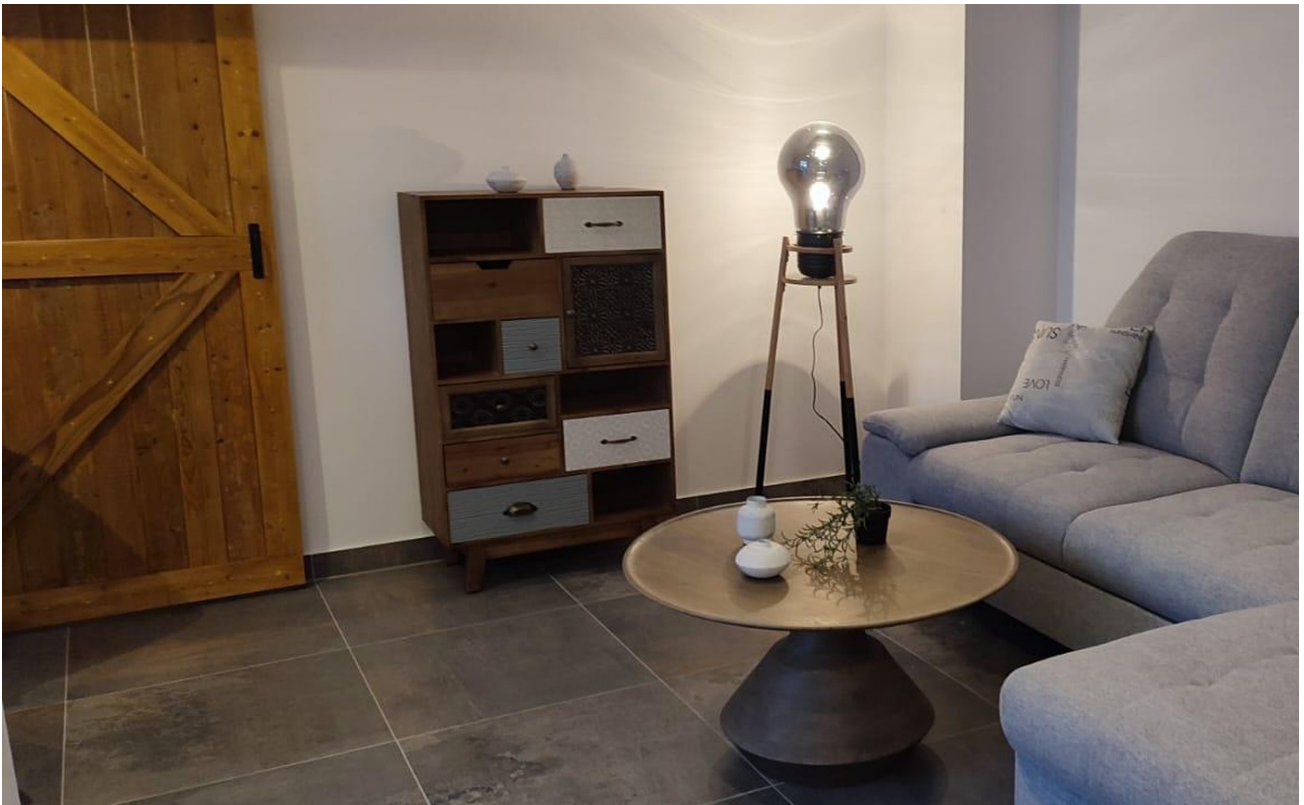
Wohnbereich mit Schlafsofa