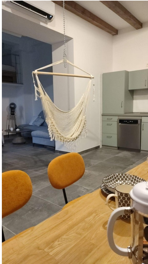
Zwischenräume mit Sitzschaukel