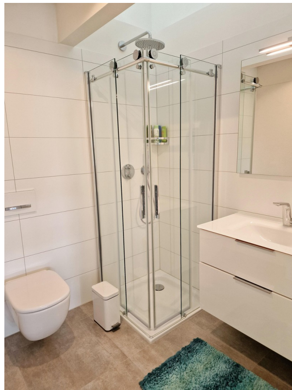
Gäste Bad mit Dusche