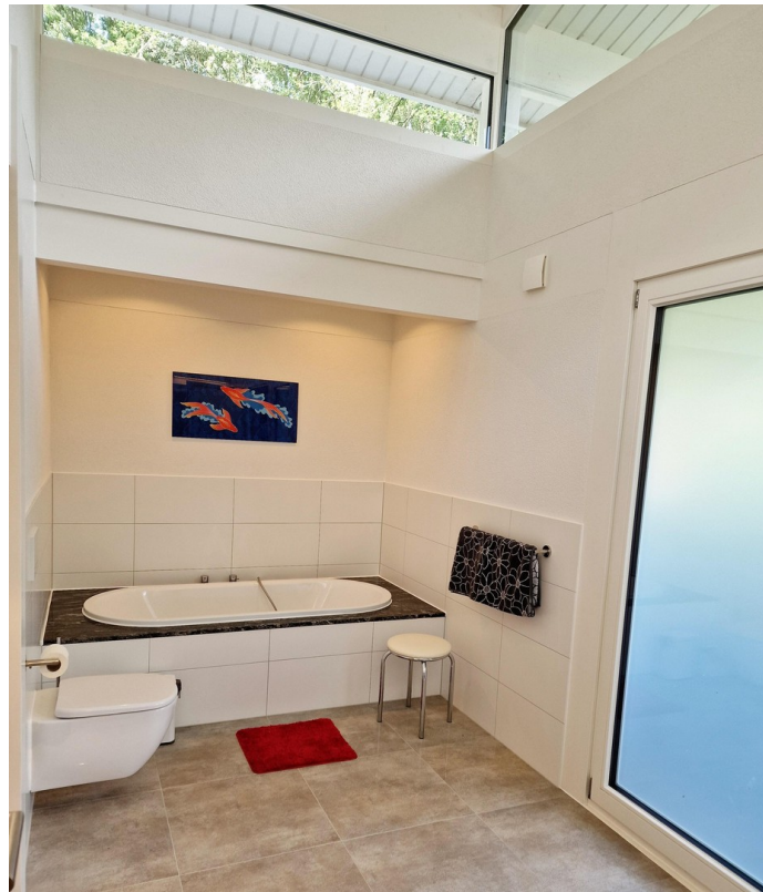
Bad mit Wanne und Lichtband