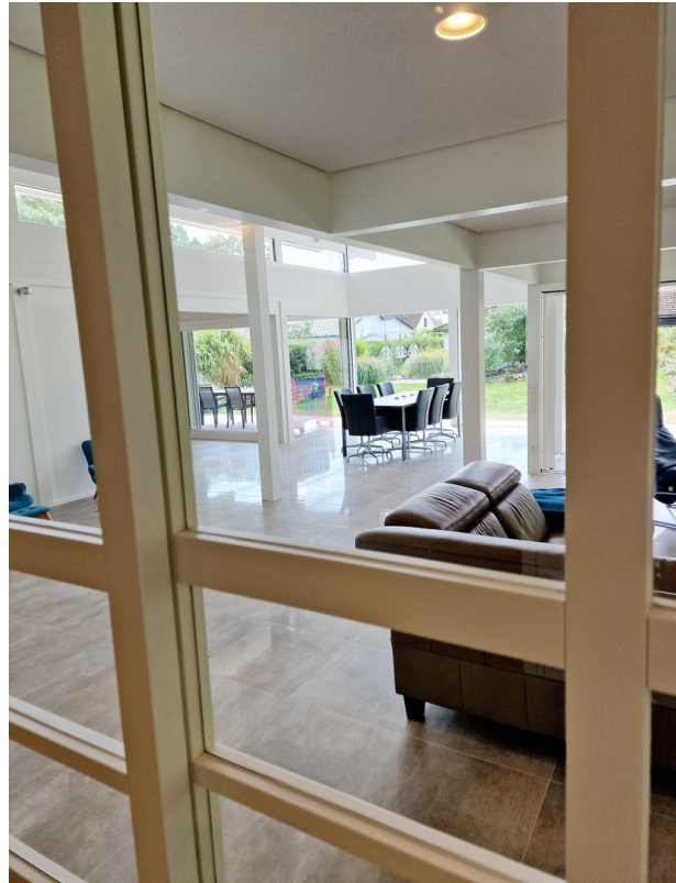
Schiebetür zum Wohnraum