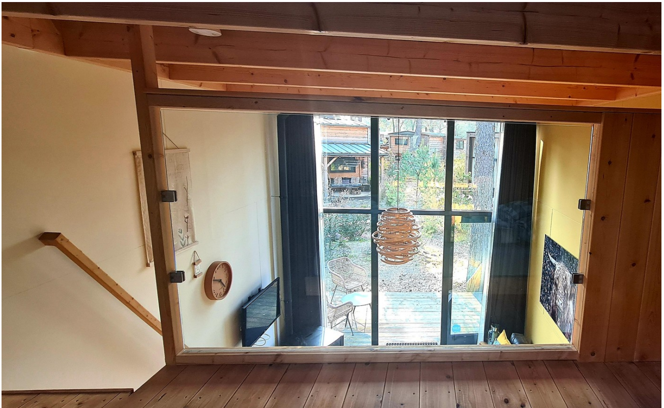
Blick aus dem Schlafbereich