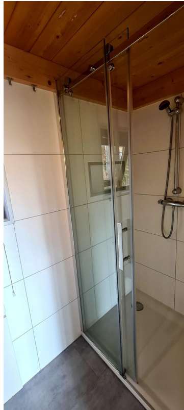
Bad mit Dusche und WC