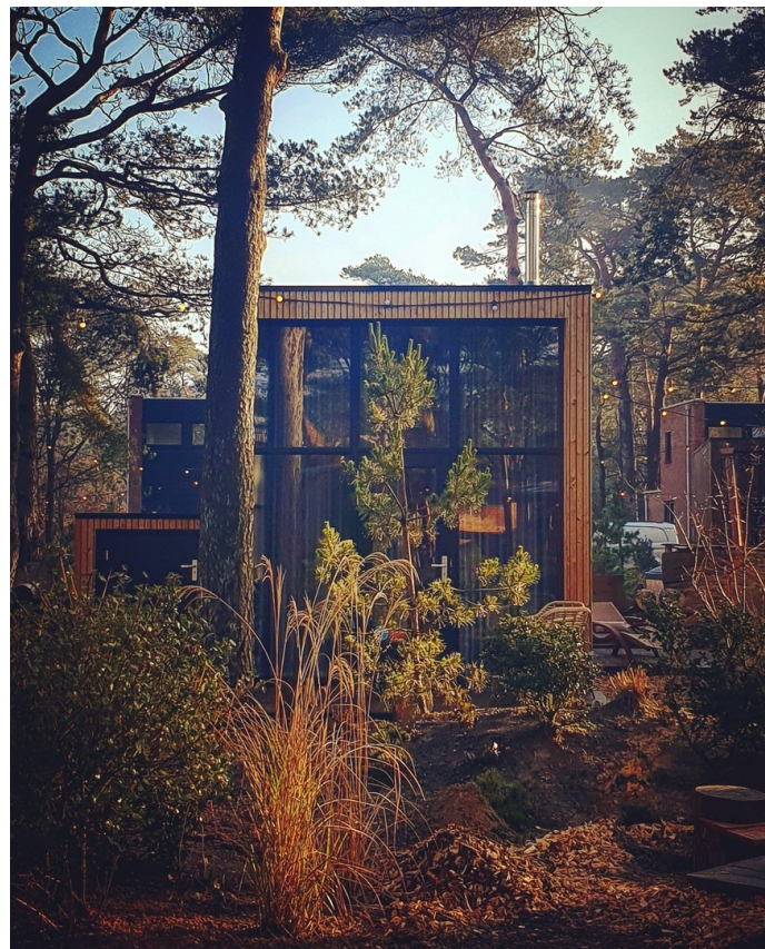
Blick aus der Community