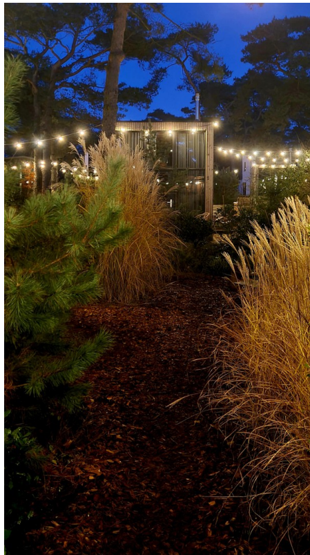
Beleuchtung bei Nacht