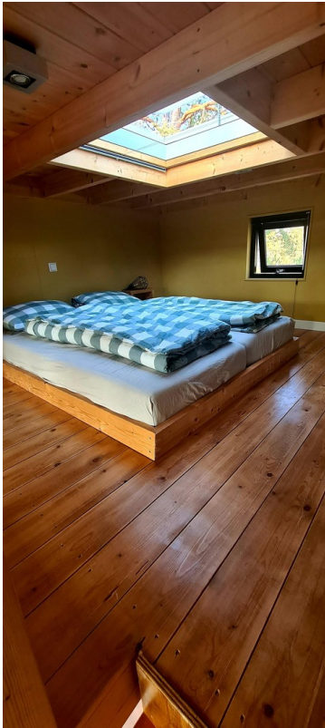
Schlafbereich mit Dachfenster