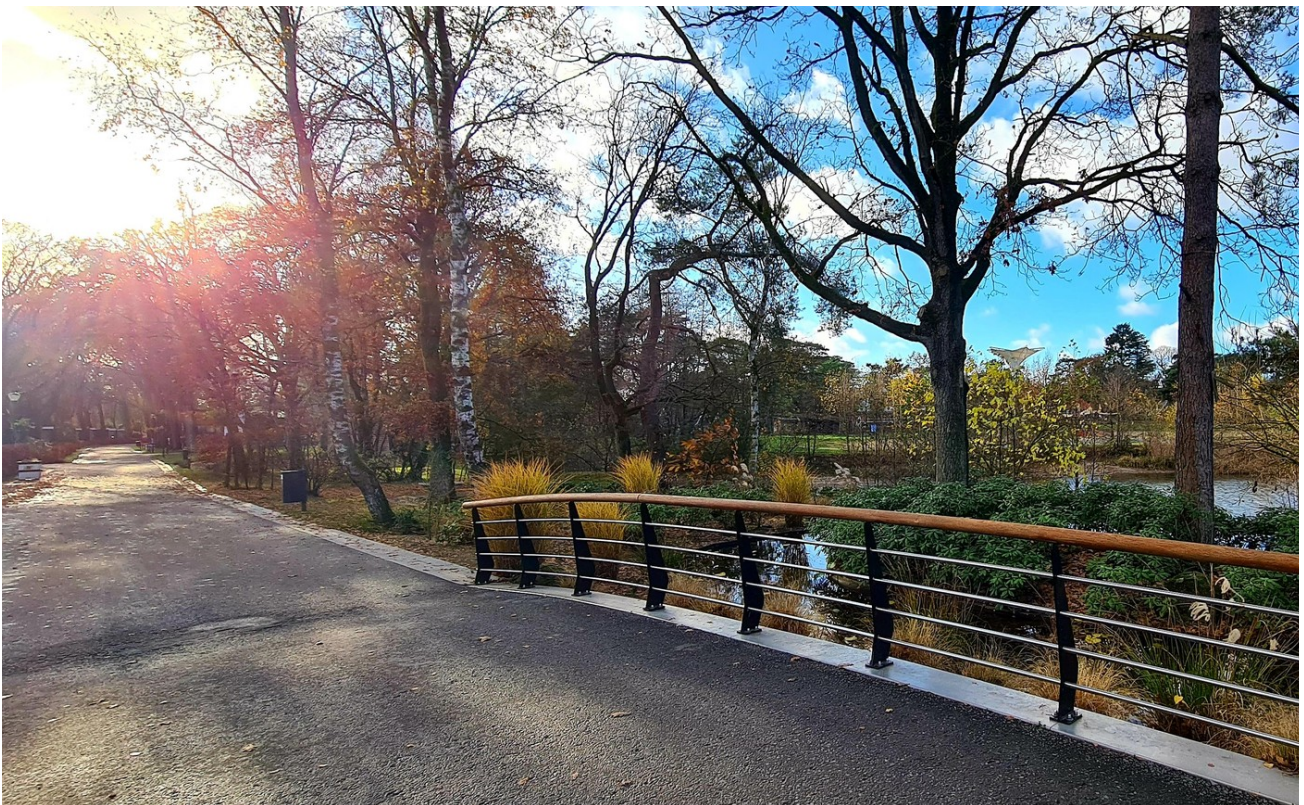
EuroParcs de Zanding