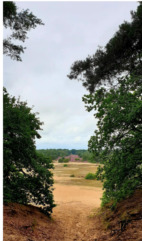
Umgebung des Parks