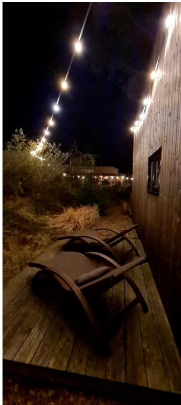
Zweite Terrasse bei Nacht