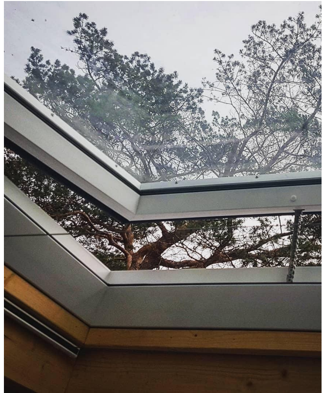
Dachfenster im Schlafbereich