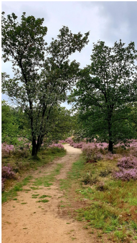
Umgebung des Parks