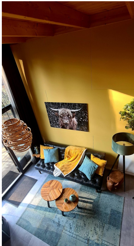
Wohnbereich von oben