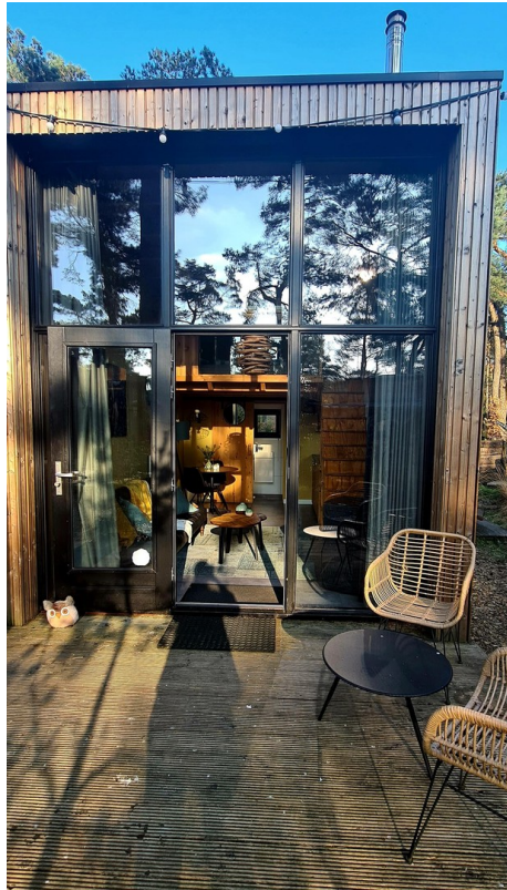
Terrasse vor dem Haus