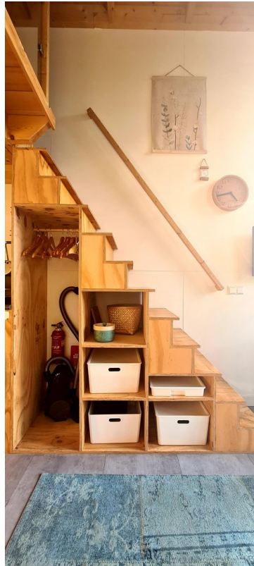
Stauraum unter der Treppe