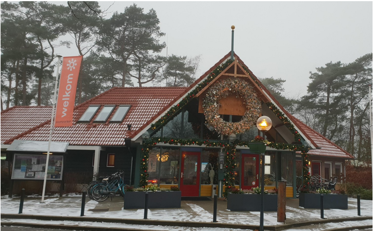
Rezeption EuroParcs de Zanding