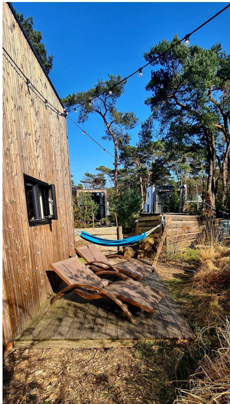
Zweite Terrasse und Hängematte