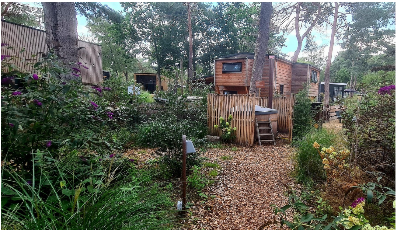
HotTub in der Community