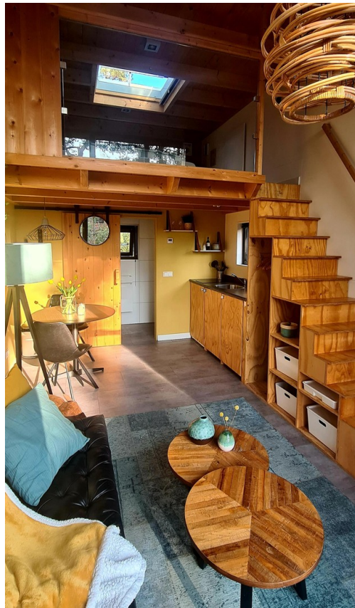
Blick ins Haus