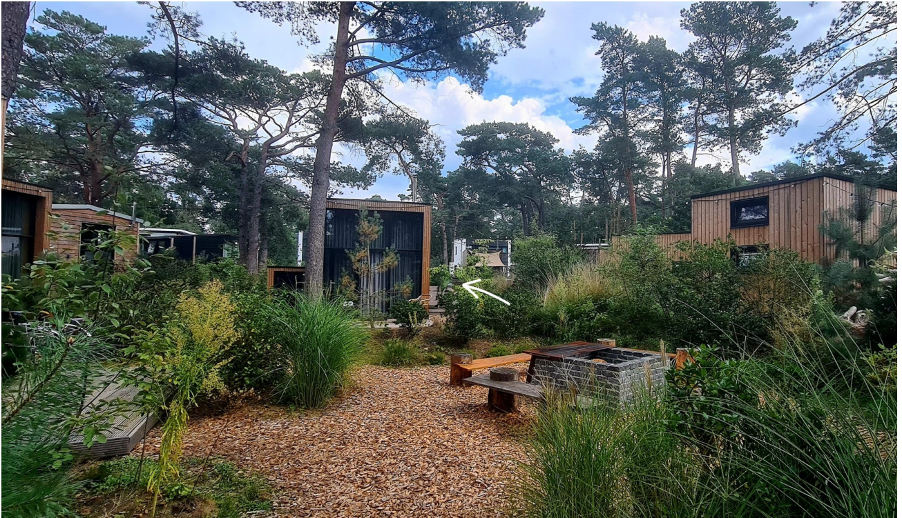
Grillplatz in der Community