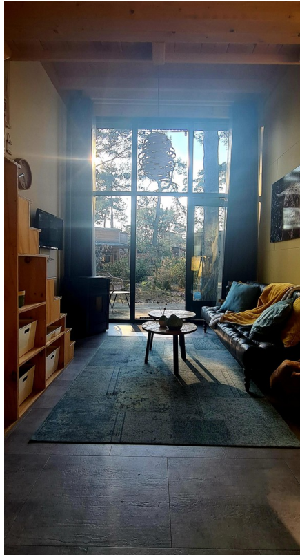
Blick nach draußen