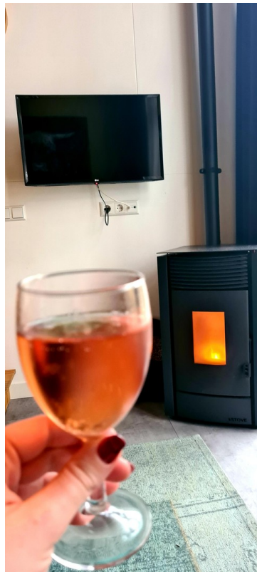
Pelletofen und TV