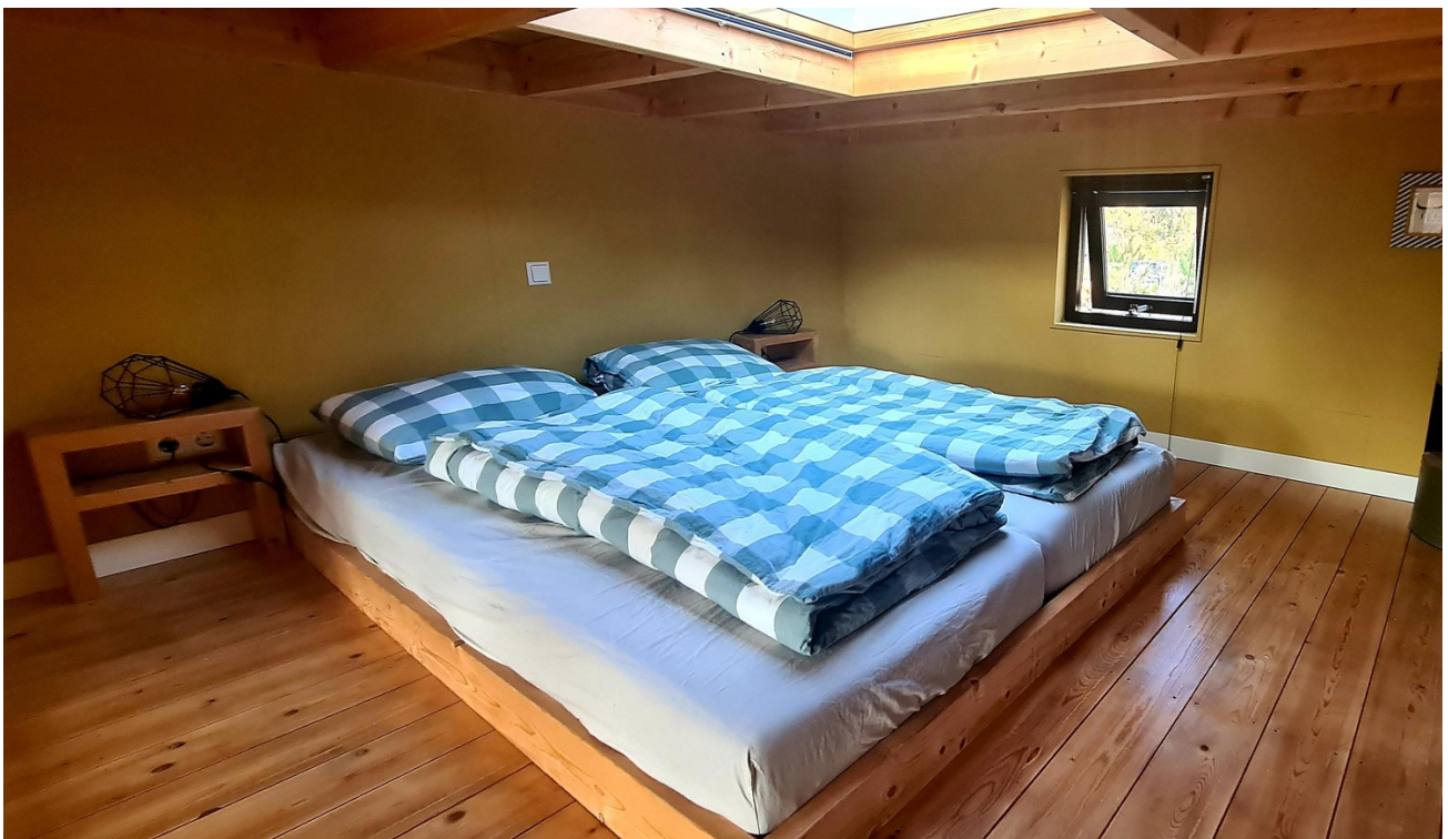
Schlafbereich unter dem Dach