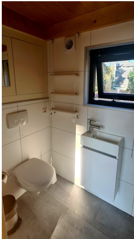
Bad mit Dusche und WC