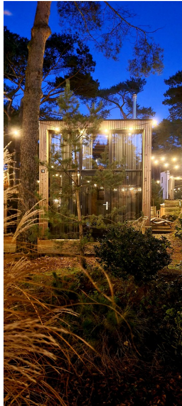
Beleuchtung bei Nacht