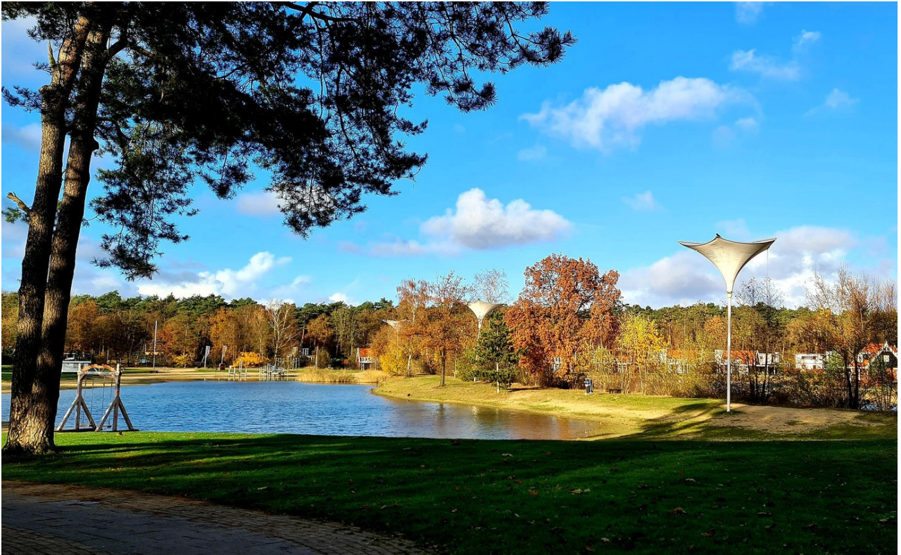
Badeseesee im Park