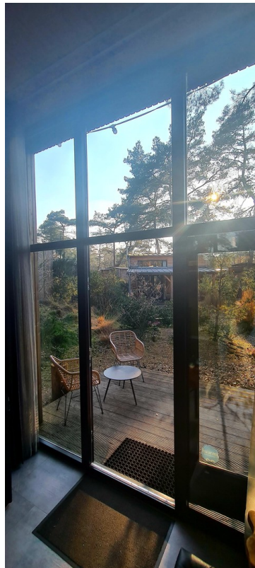
Blick nach draußen