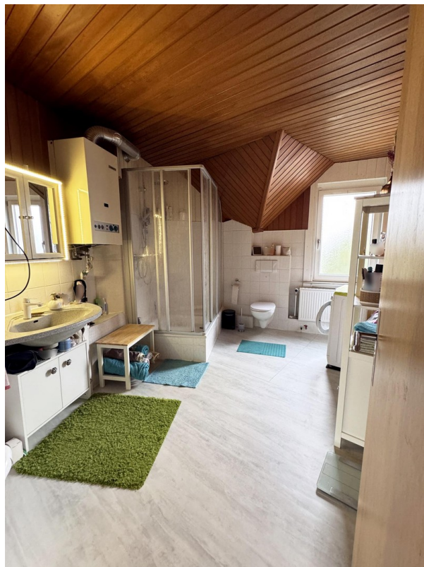
Bad / Sanitär