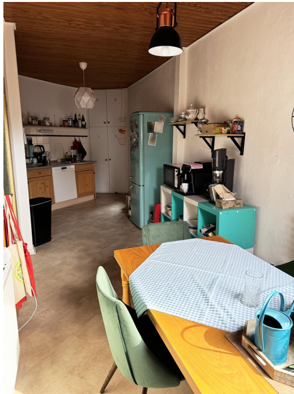
Essbereich / Küche