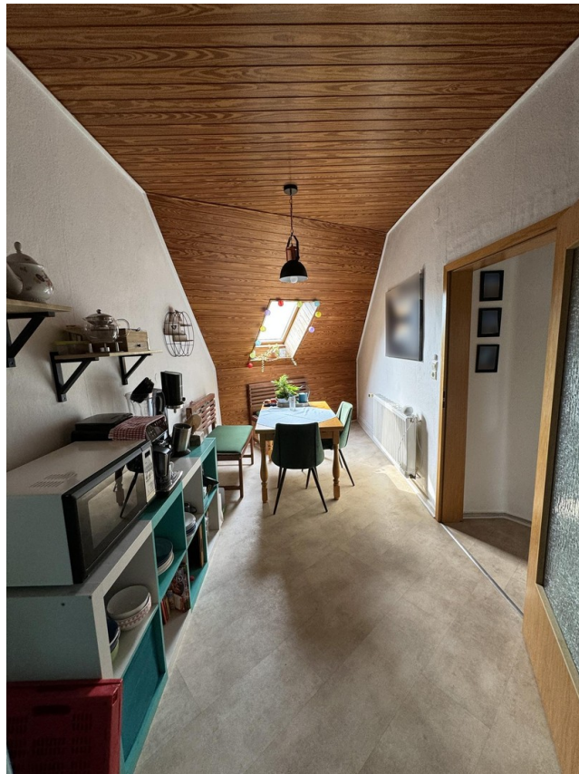
Essbereich / Küche