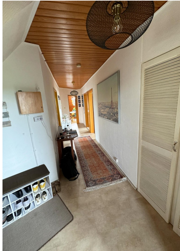
Flur / Eingang