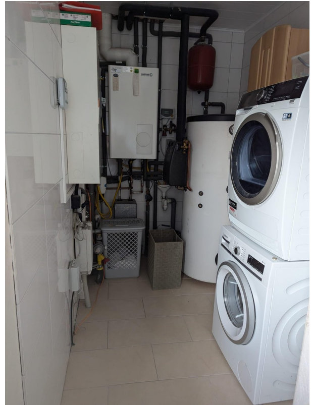
Anschluss- und Heizungsraum