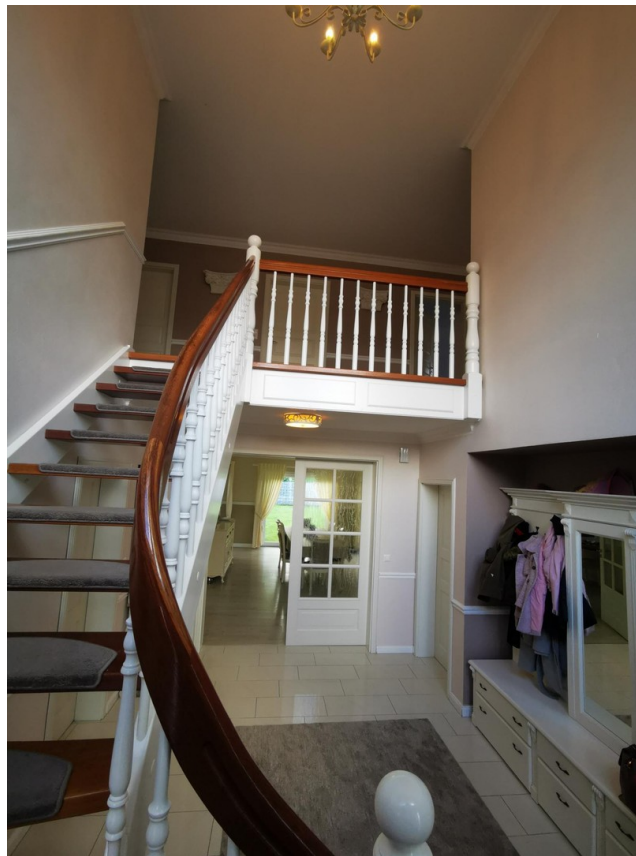
Foyer mit Galerie