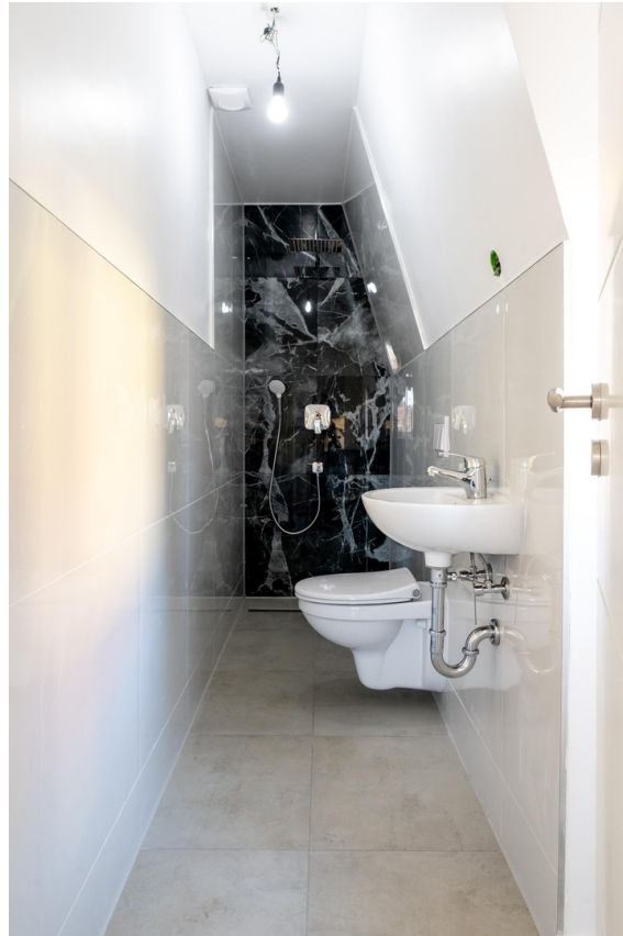
Bad OG mit Walk-In-Dusche