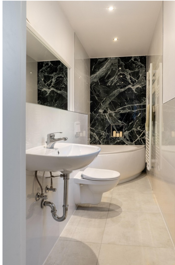
Bad EG mit Wanne