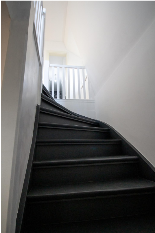
Treppe zum OG