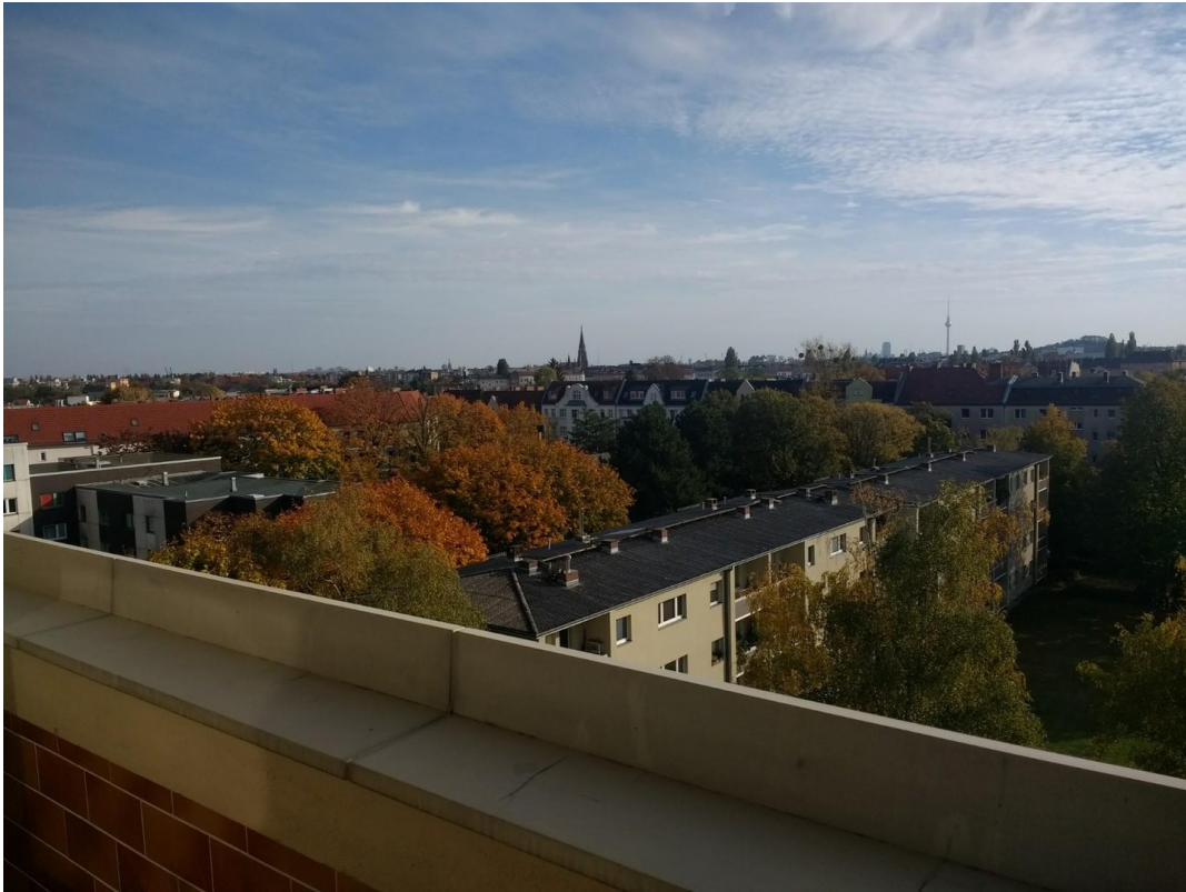
Blick vom Balkon nach Süden