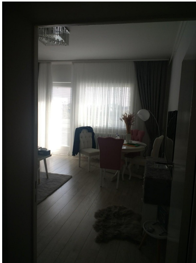
Wohnraum mit Balkon