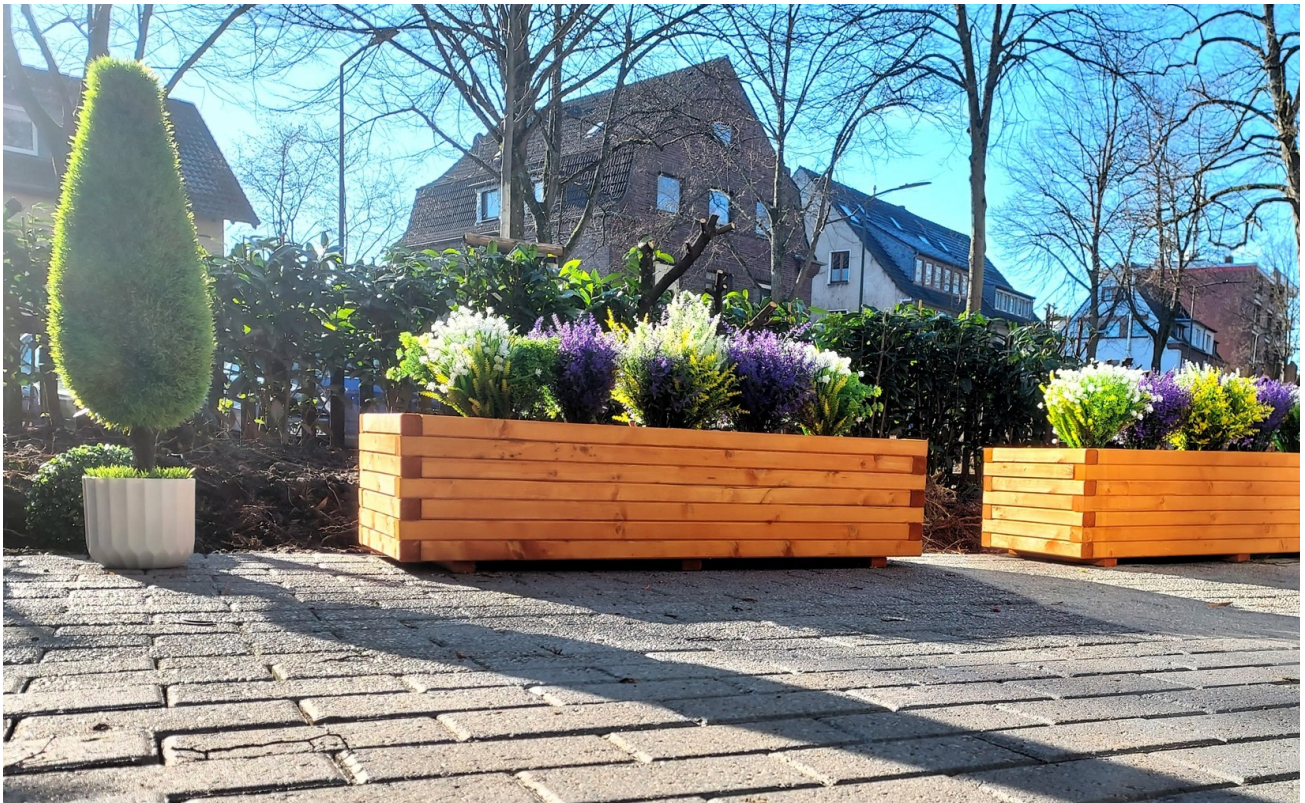
Terrasse 18 qm Rasen 21 qm