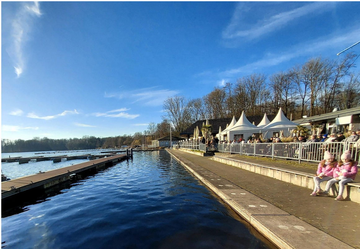
Zum Bootshafen in 5 Minuten