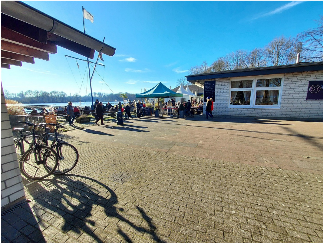
Zum See Restaurant 5 Minuten