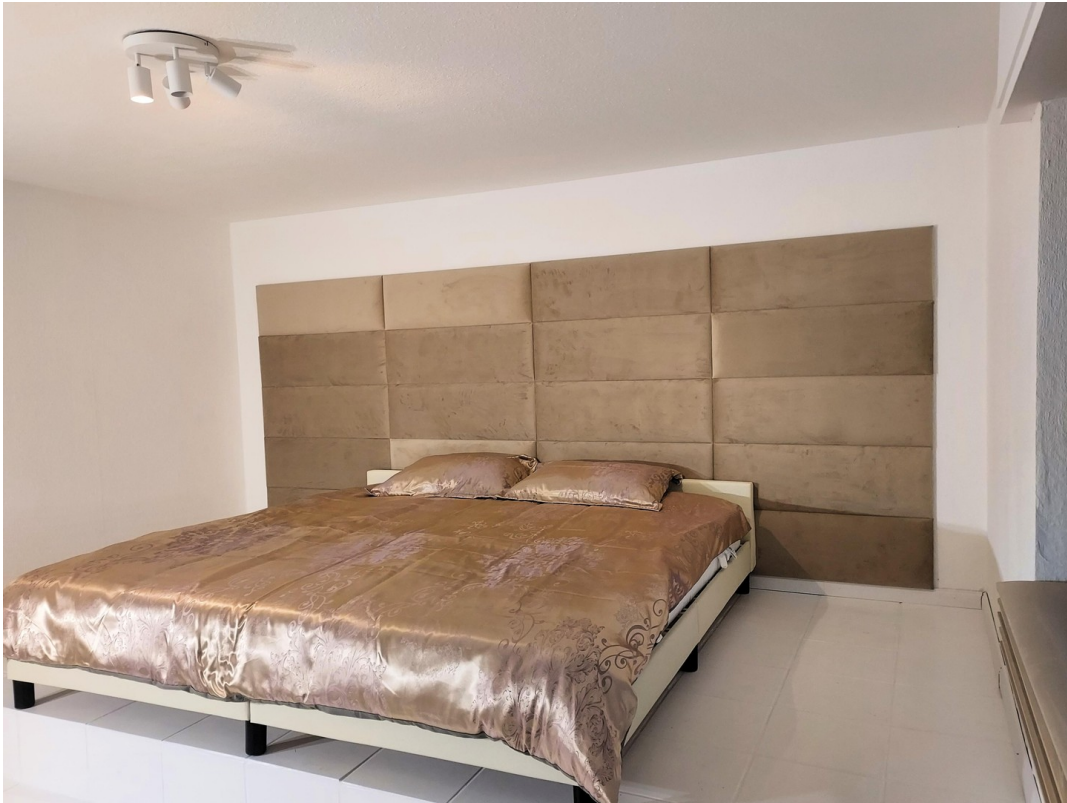
1. Schlafzimmer 18 qm