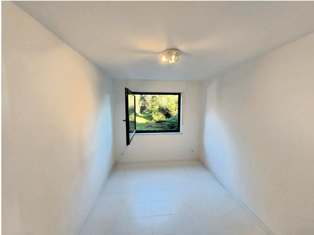
2. Schlafzimmer 11 qm