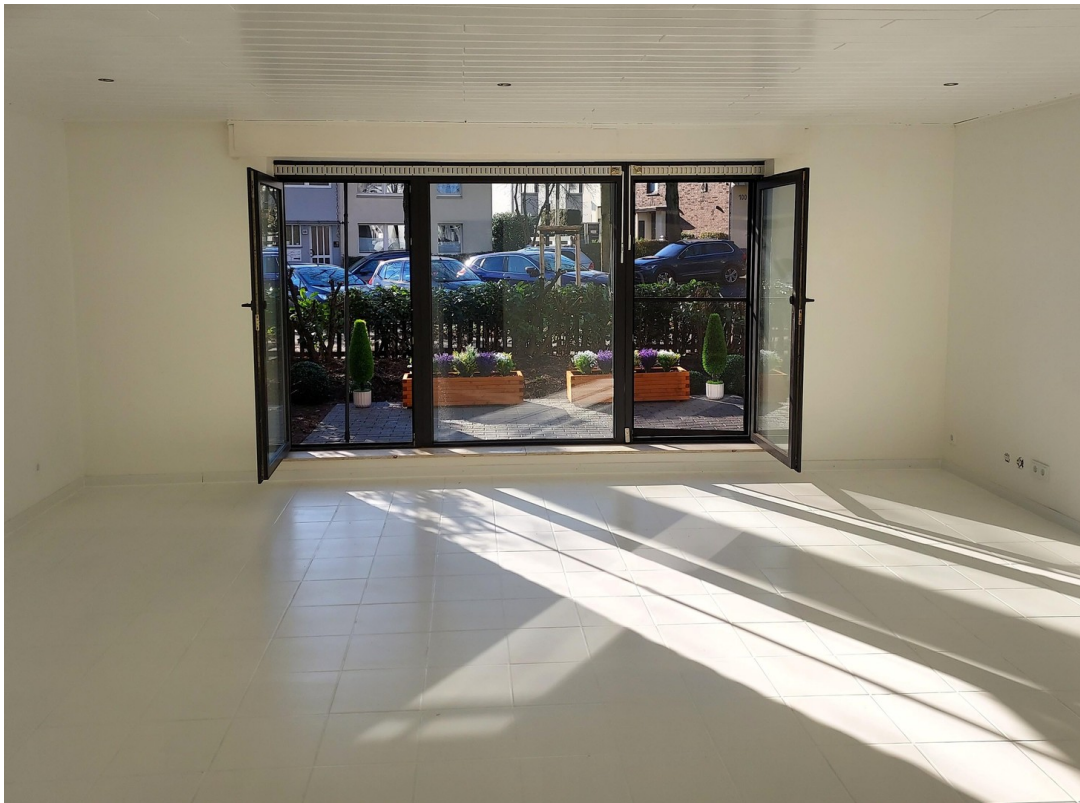
Vorgarten Zaun bis zu 2 Meter