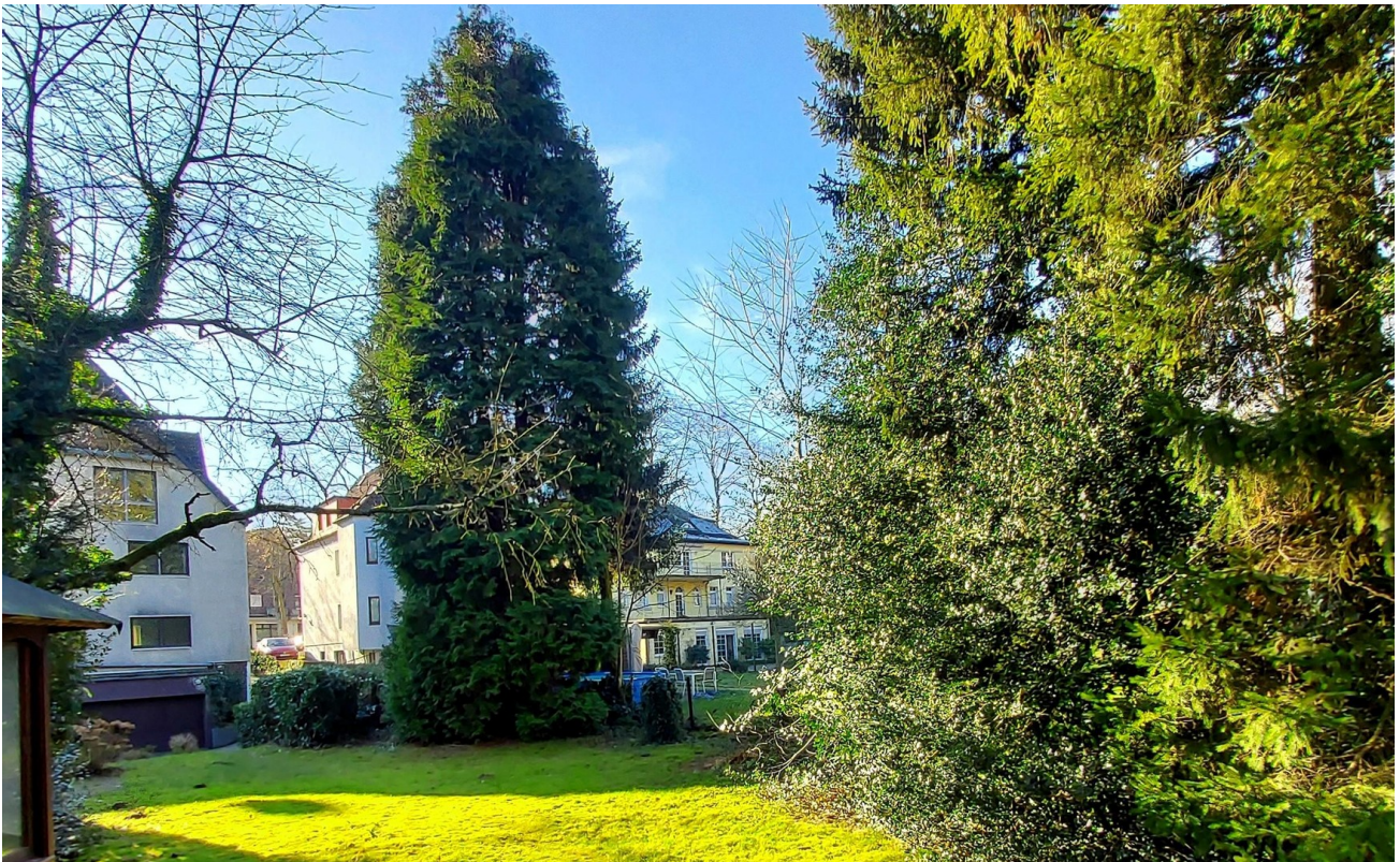
Rückansicht und Nachbargarten