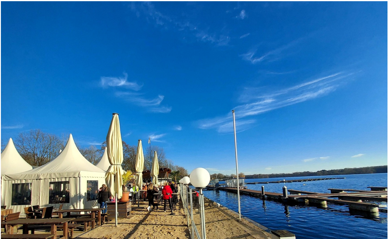
See Restaurant Terrasse