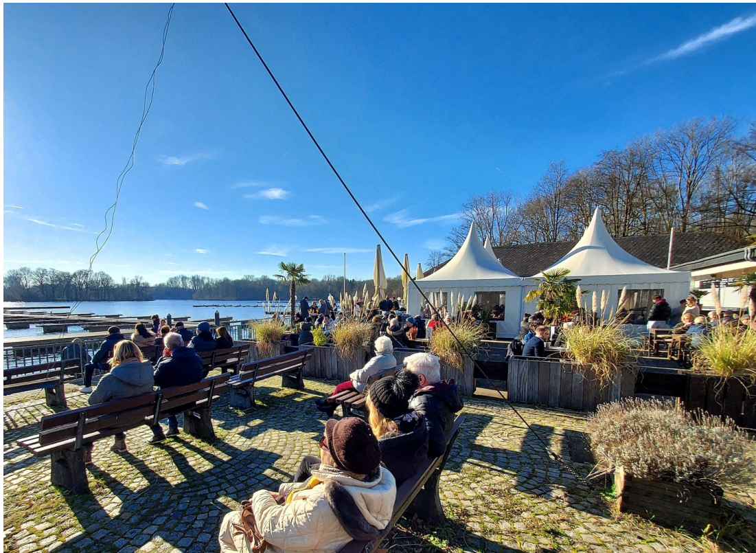
Sonnenbad im Winter