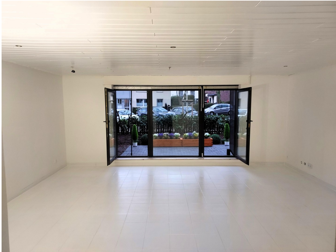
Wohnzimmer 35 qm erweiterbar