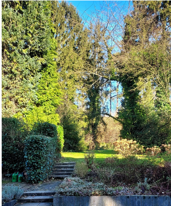
Ruhiger Garten für 6 Wohnungen