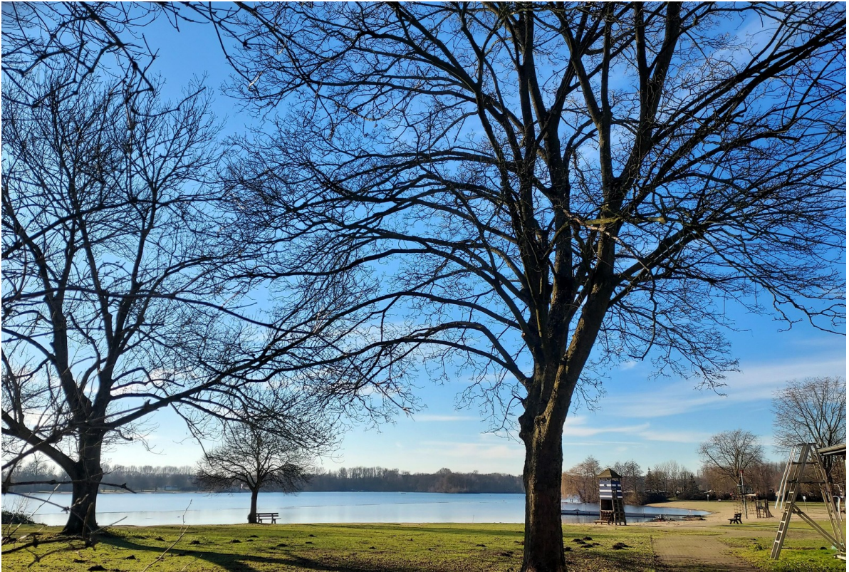
Zum Strandbad Nord 3 Minuten