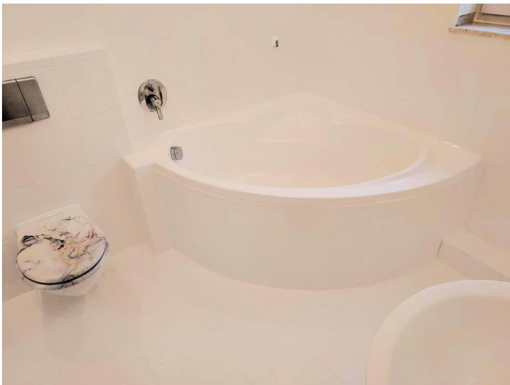
Badezimmer 6 qm