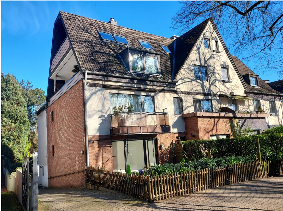
Vorgarten 39 qm Alleinnutzung