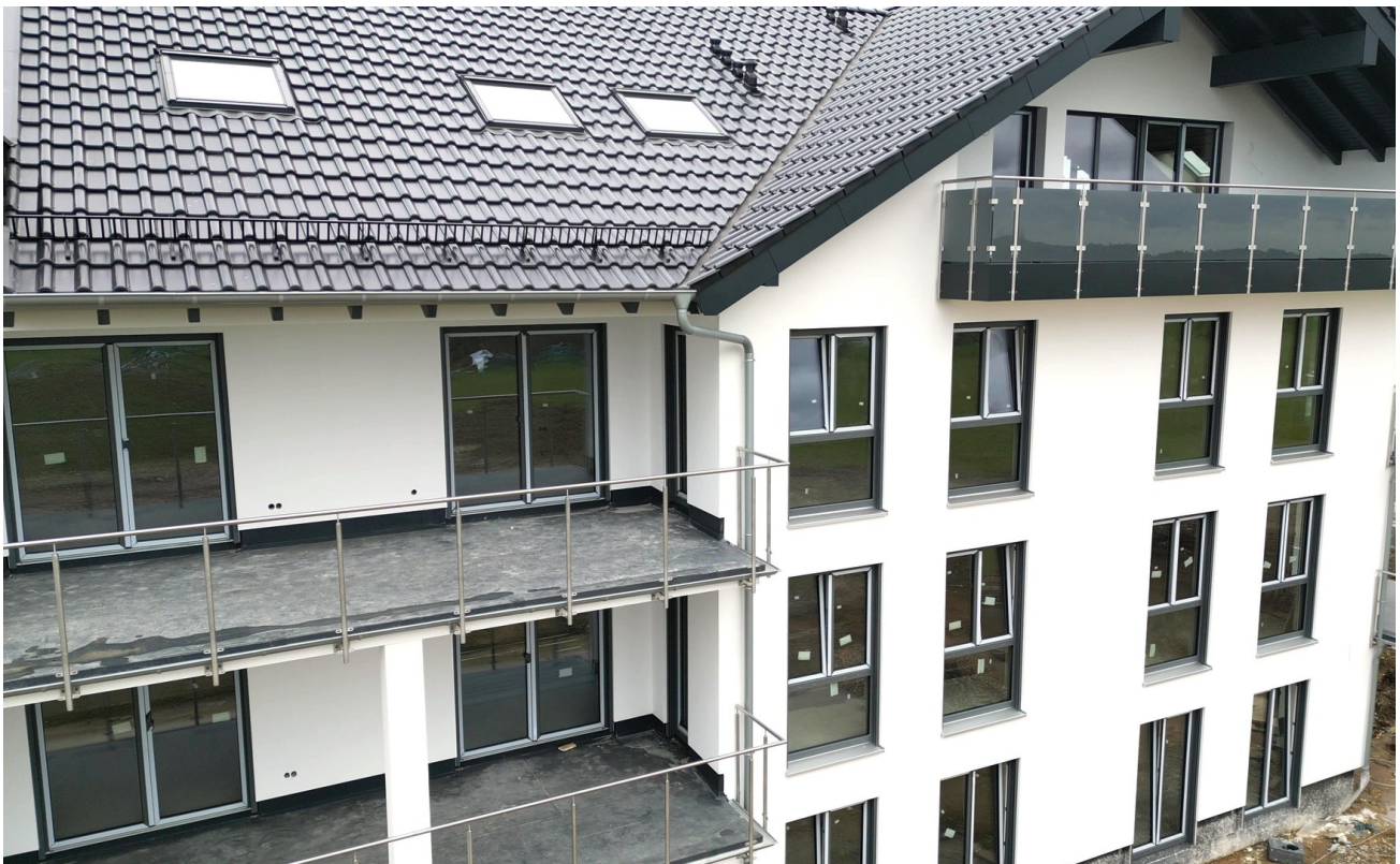
von der Nähe