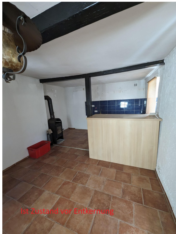
Küche - Ist Zustand