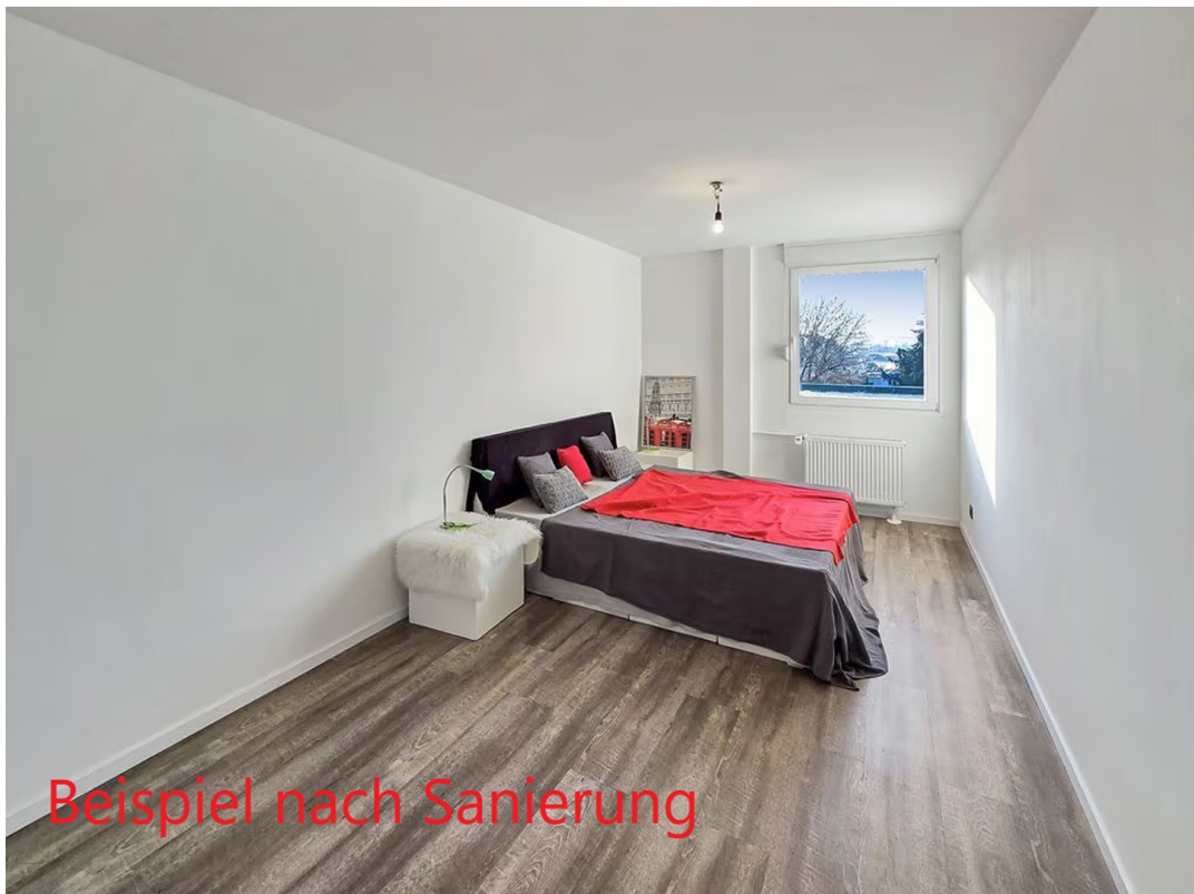
Schlaf - Renovierungsvorschlag