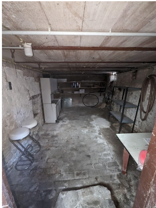
Keller - Ist Zustand