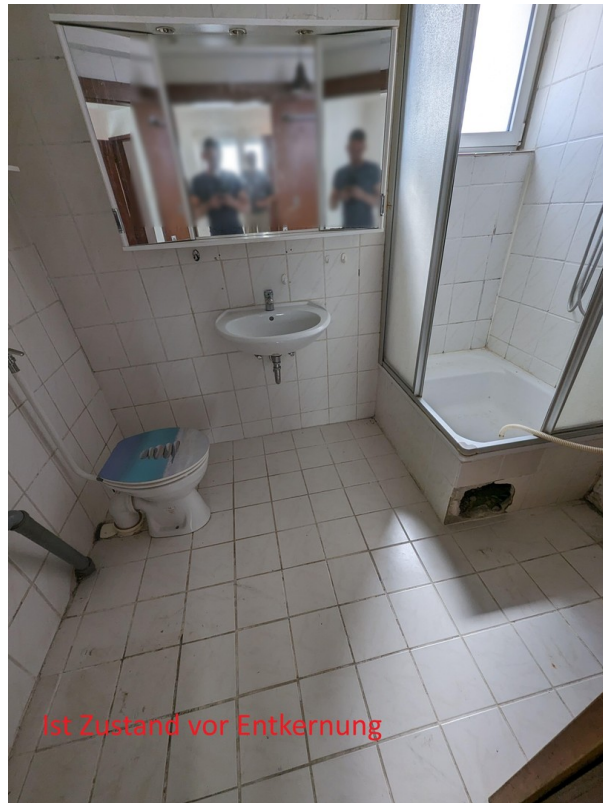
Bad - Ist Zustand