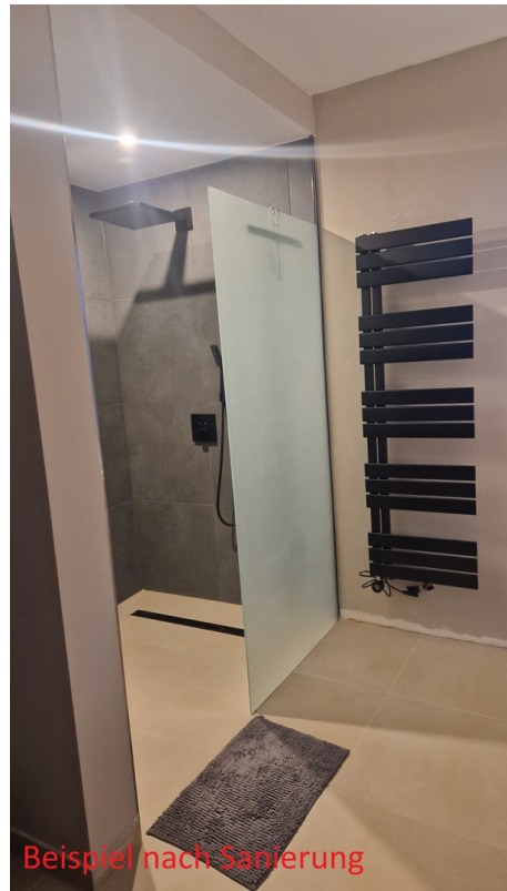
Dusche - Renovierungsvorschlag