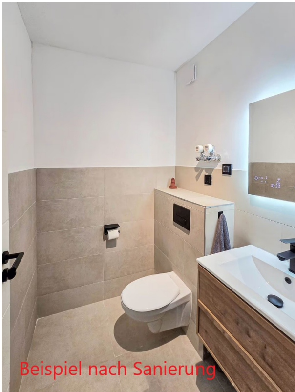
Bad - Renovierungsvorschlag