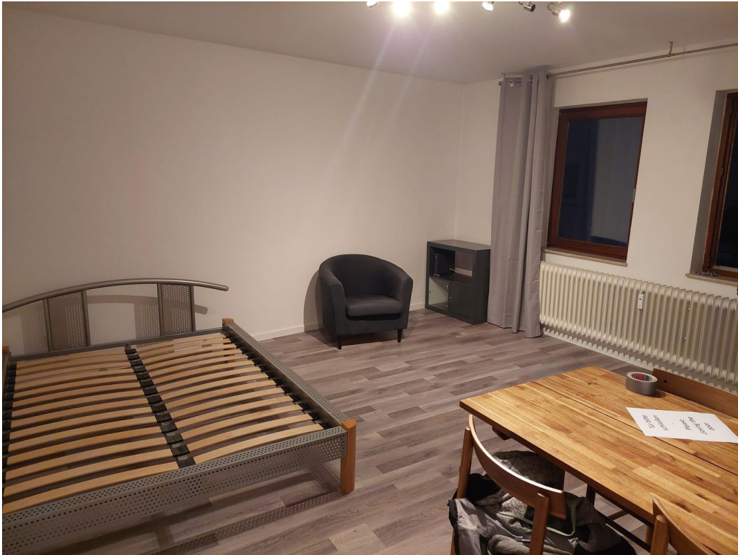
Bett+Sessel + Regal