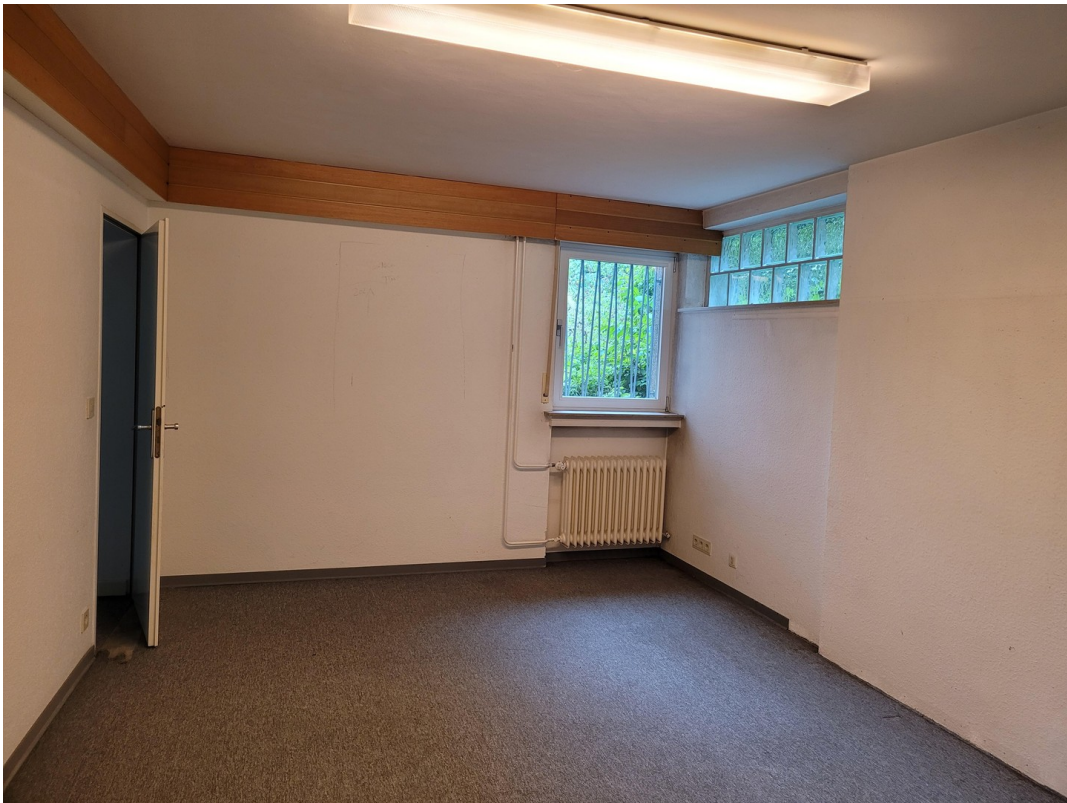
BÜRO 1 KG