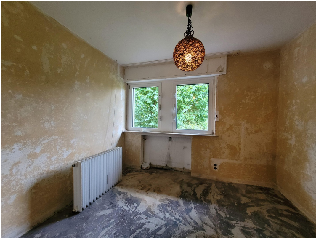
ZIMMER 2 EG