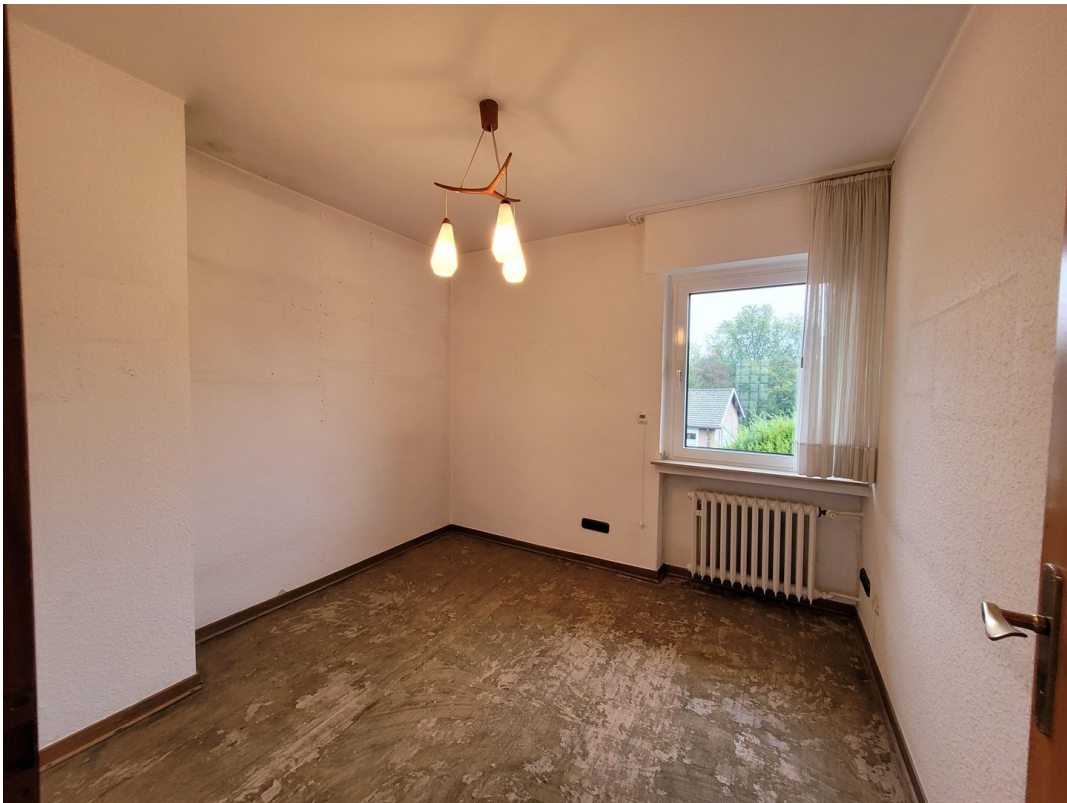
ZIMMER 1 EG