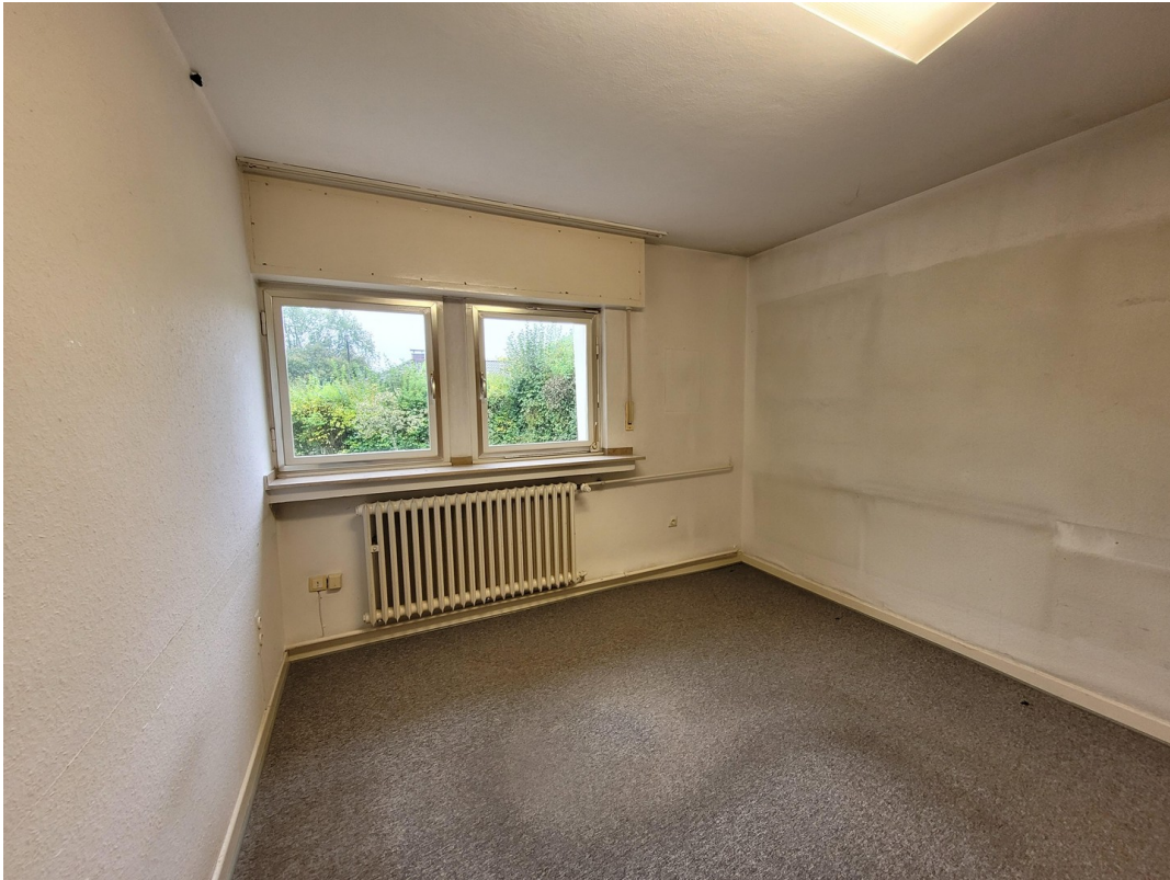
BÜRO 2 KG