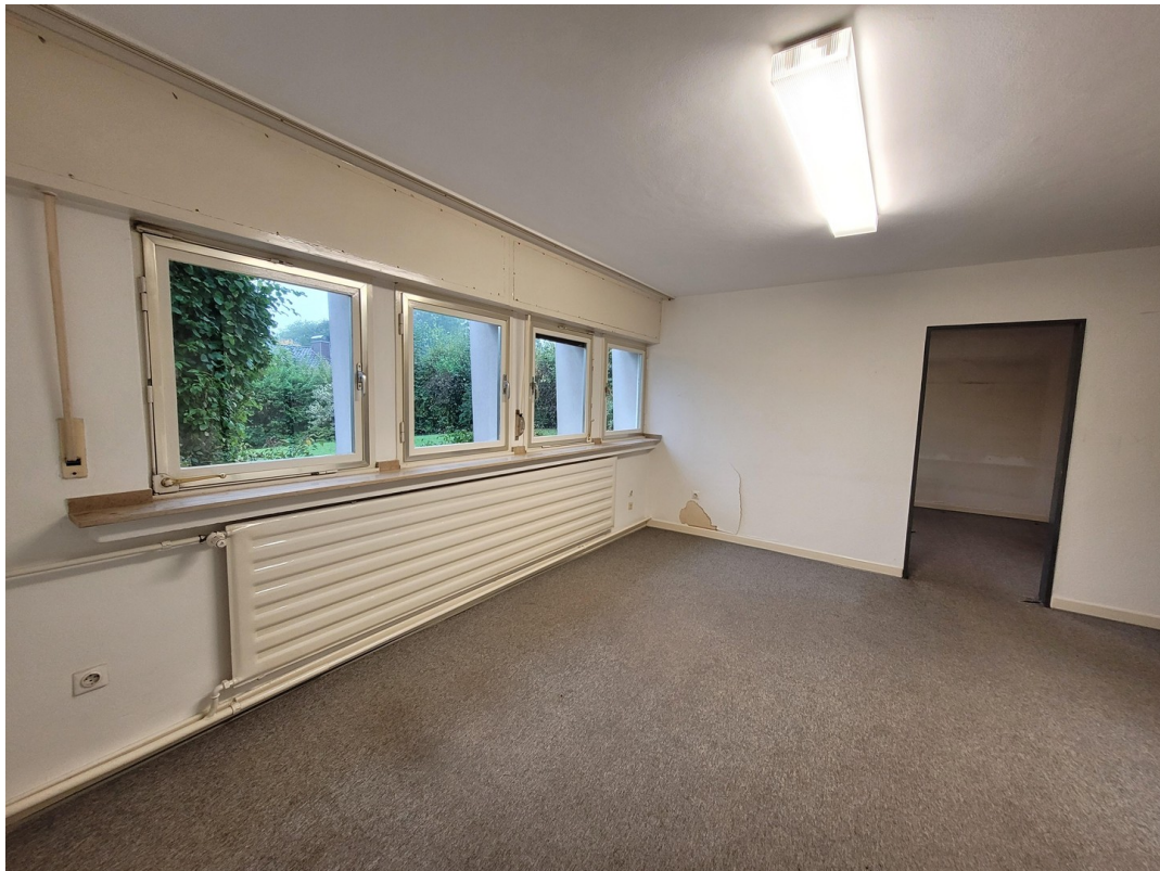
BÜRO 3 KG