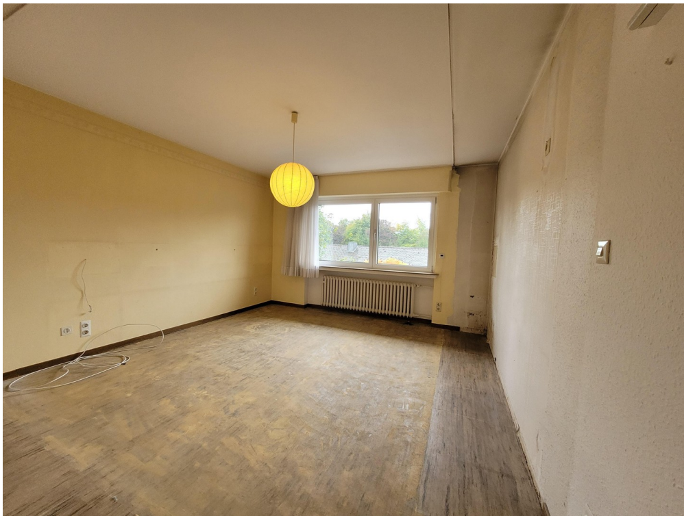
ZIMMER 3 EG