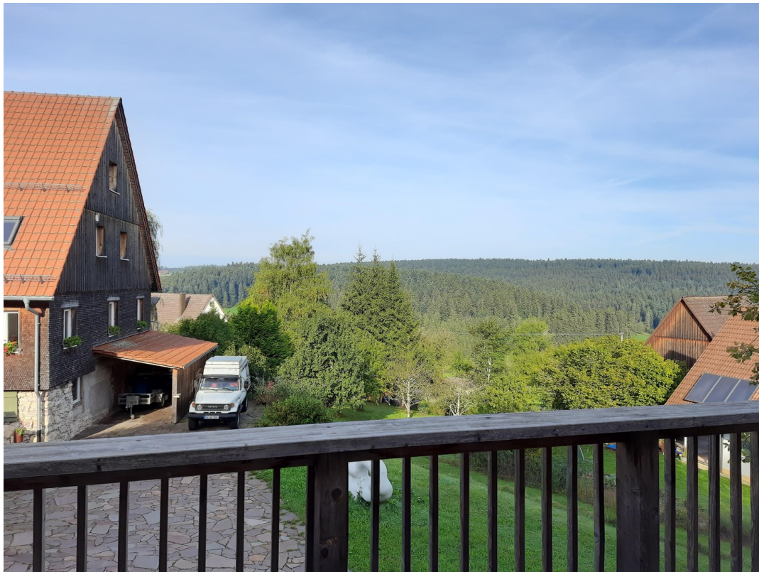
Blick vom neuen Balkon